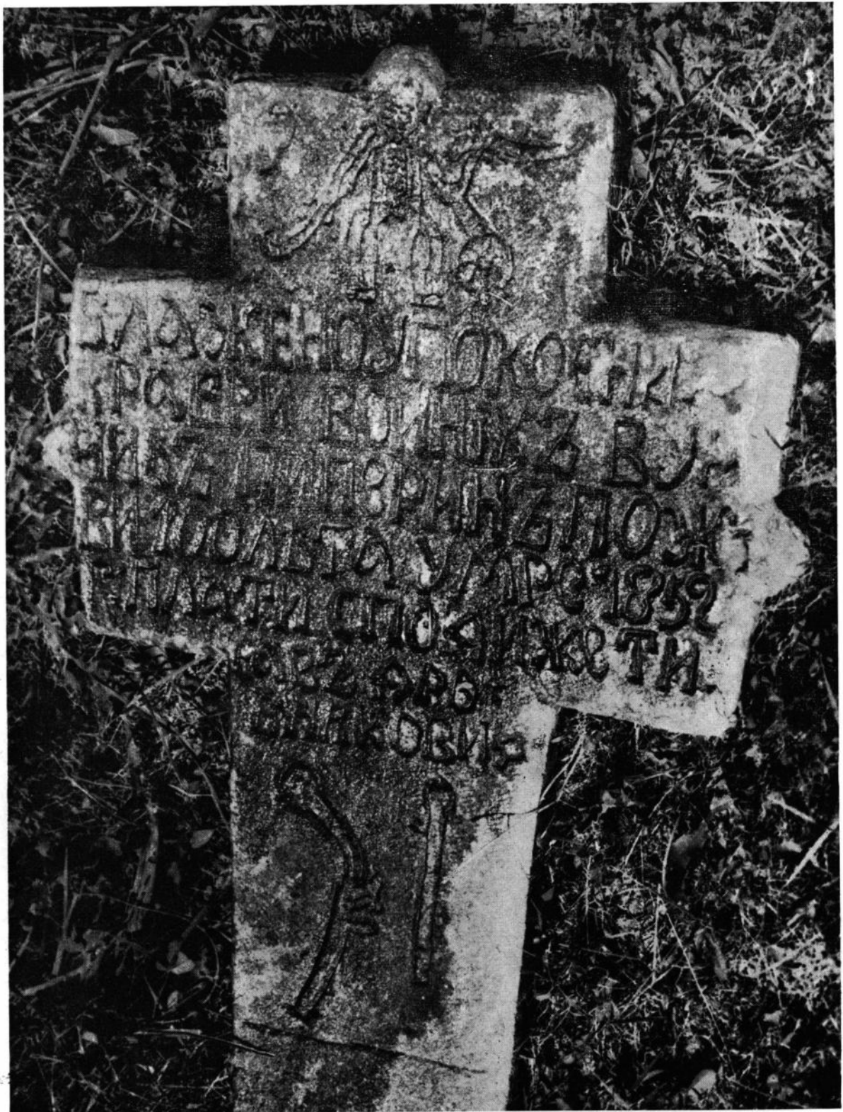
Сл. 5. Надгробни белег Вучићу Пиперину, „крабром војнику“ који „плати (и) сподиже“ Тијосав Дробњаковић