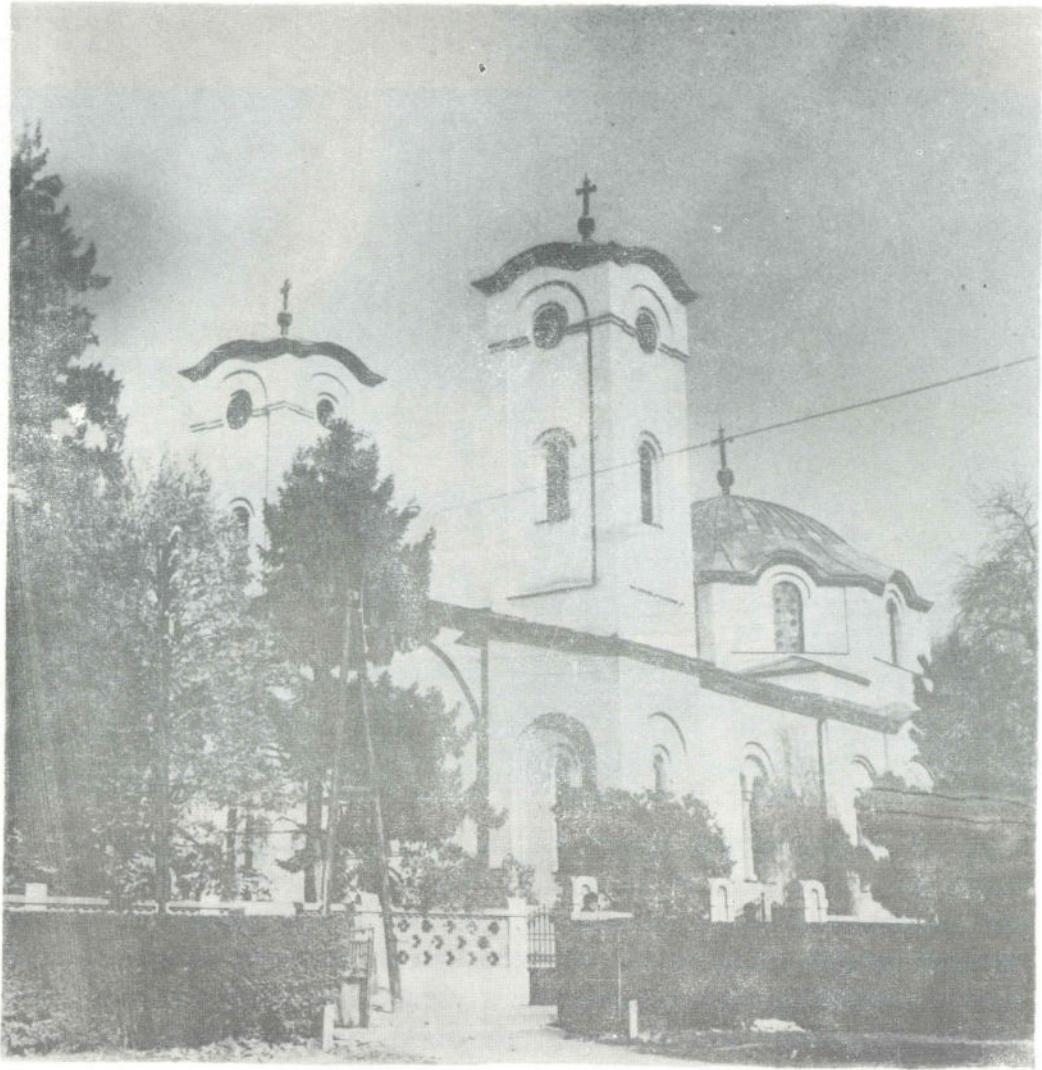
Сл. 1. Данашњи изглед цркве у Чачку