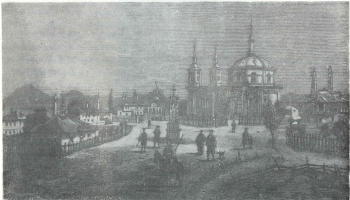
Сл. 3. Чачанска црква након прекривања бакром у 1879. години