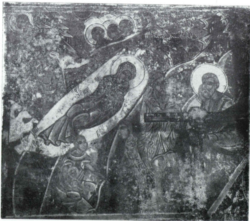
Сл. 8 Никоље, наос, Рођење Христово, 1697.