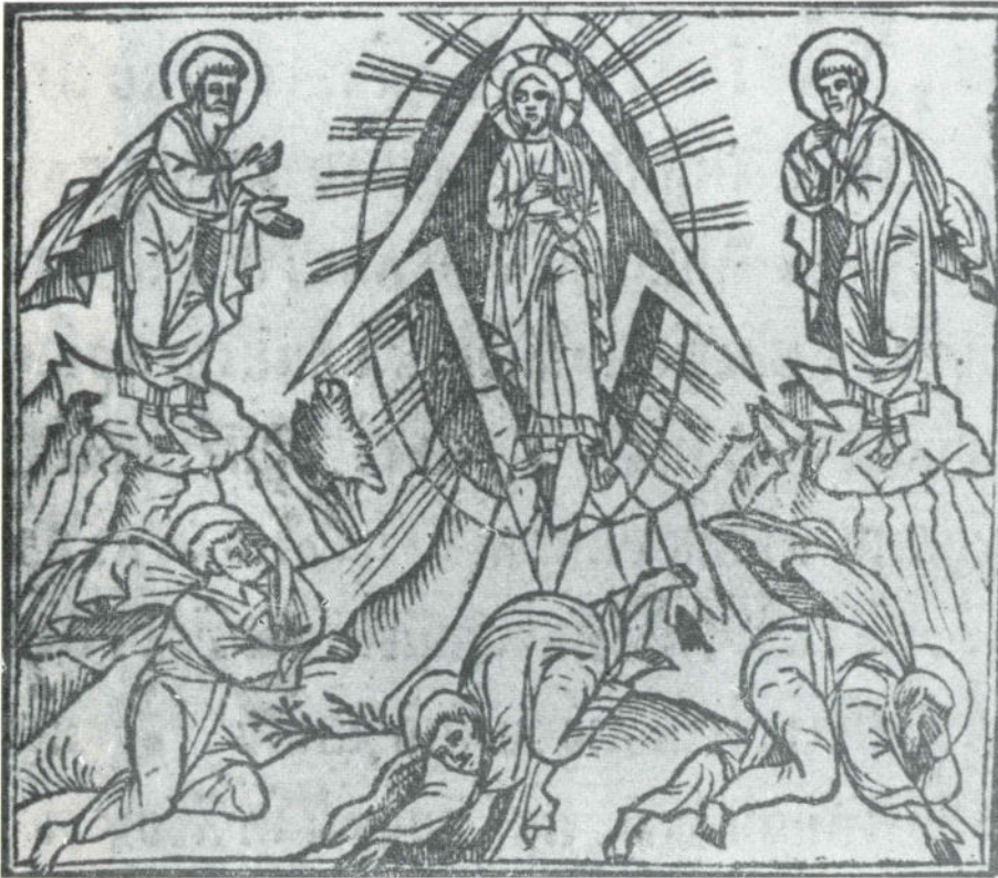
Сл. 11 Празнични минеј Божидара Вуковића из 1538, Преображење