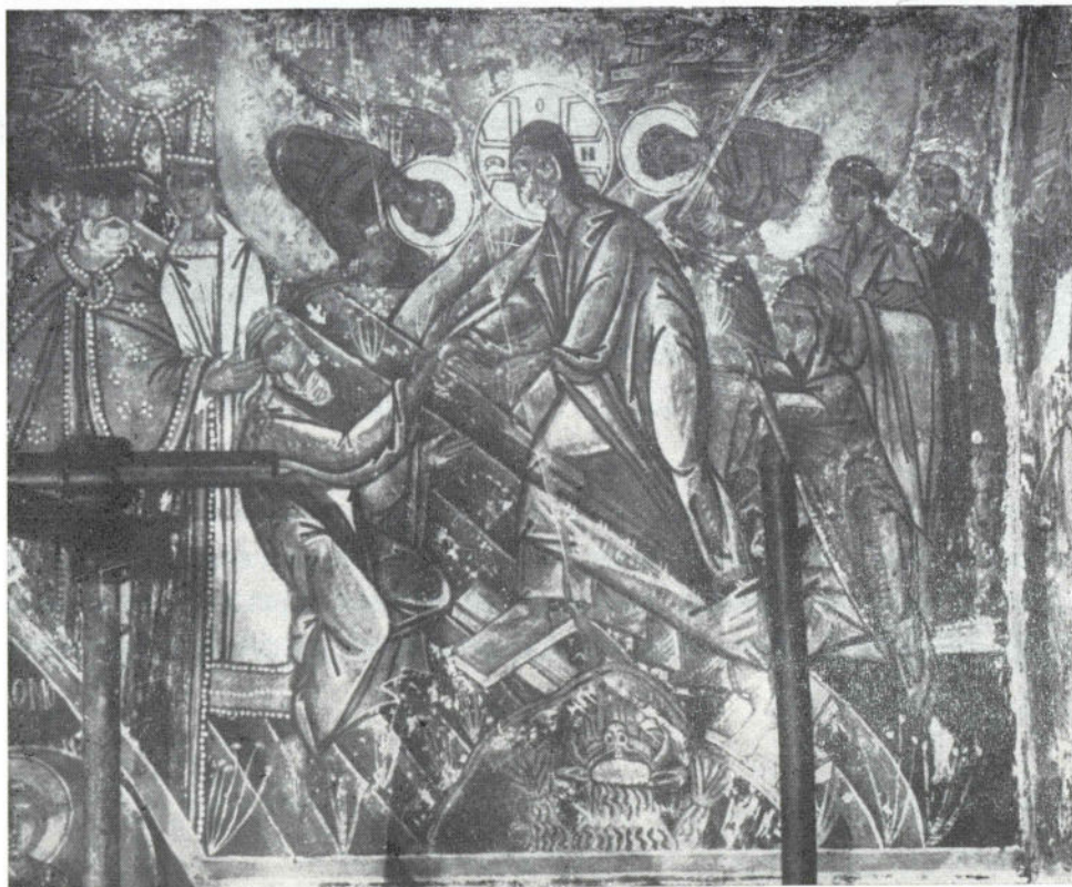
14. Никоље, наос, Васкрсењије Христово, 1697.