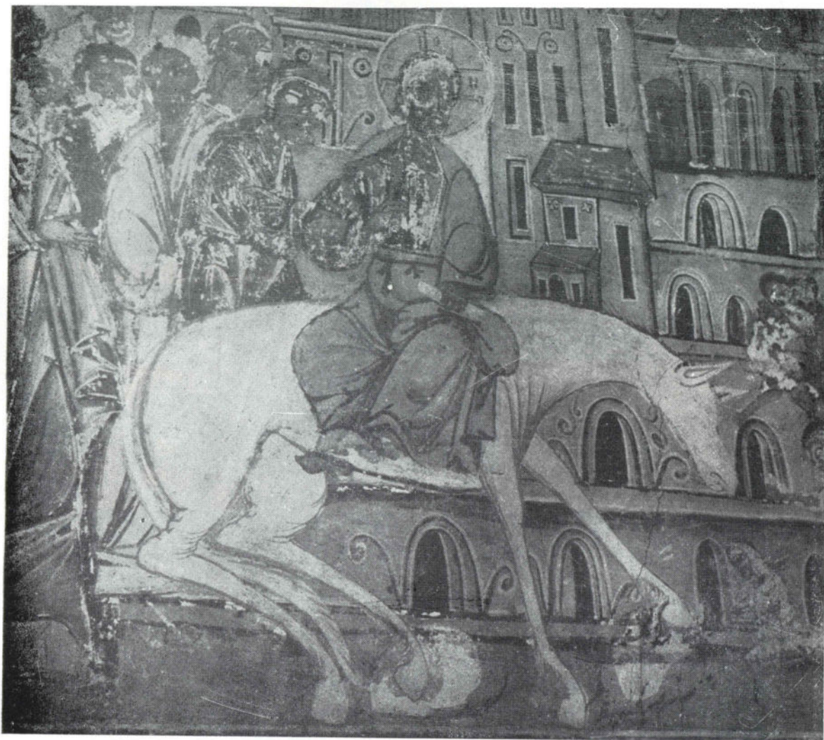
15. Никоље, наос, Улазак у Јерусалим. 1697.