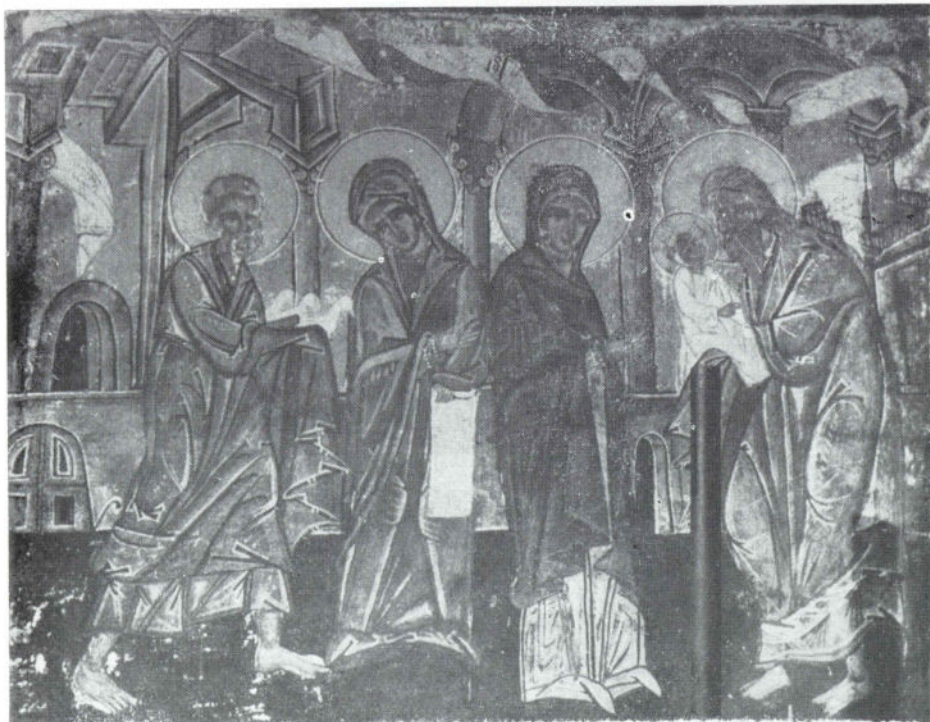
Сл. 6 Никоље, наос, Сретење, 1697.