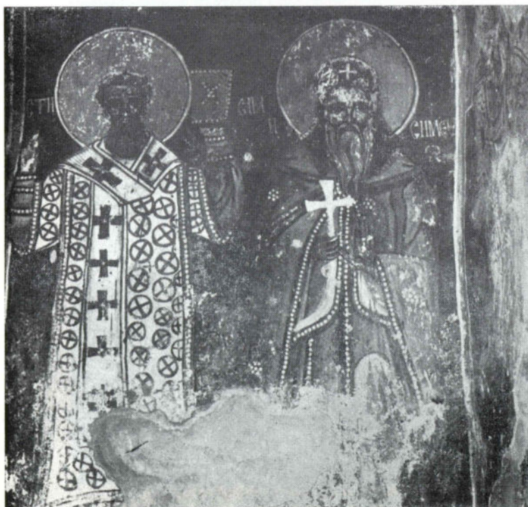
Сл. 2 Никоље, наос, Св. Сава и Симеон Српски, 1697.