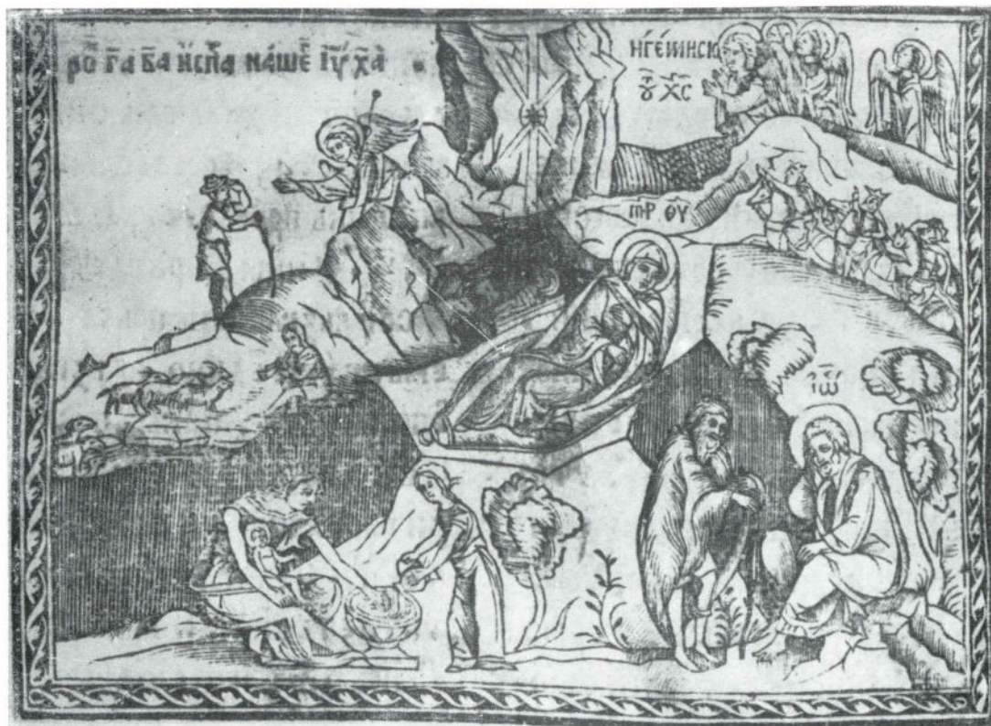
Сл. 9 Празнични минеј Божидара Вуковића из 1538, Рођење Христово