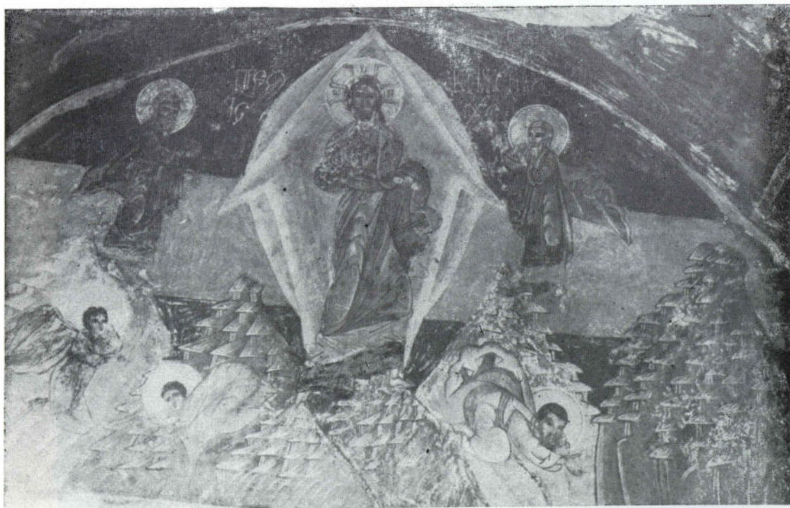
Сл. 10 Никоље, наос, Преображење, 1697.