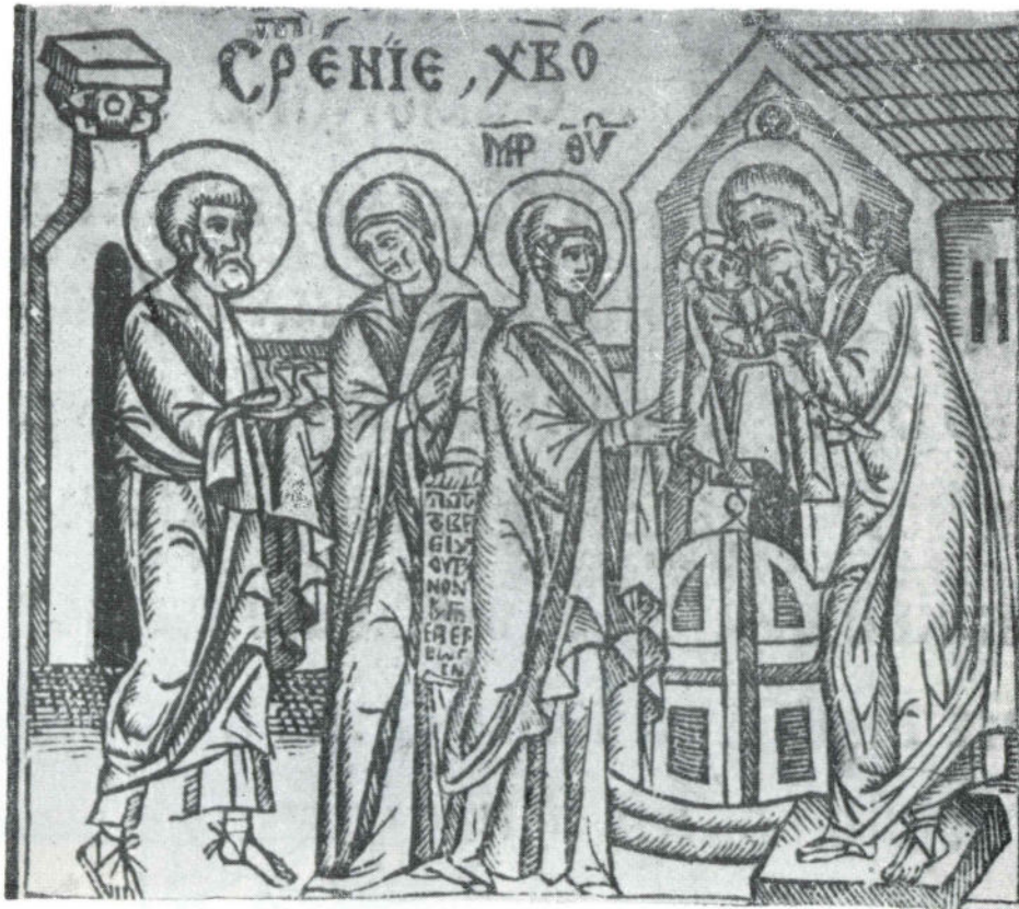
Сл. 7 Празнички минеј Божидара Вуковића из 1538, Срећење