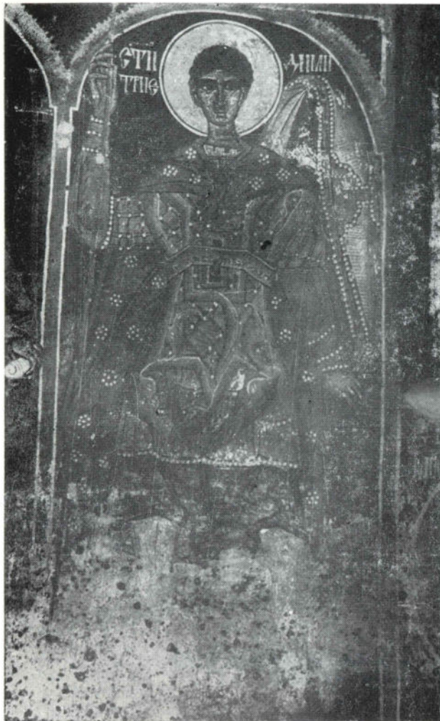
Сл. 1 Никоље, наос, Св. Димитрије 1697.