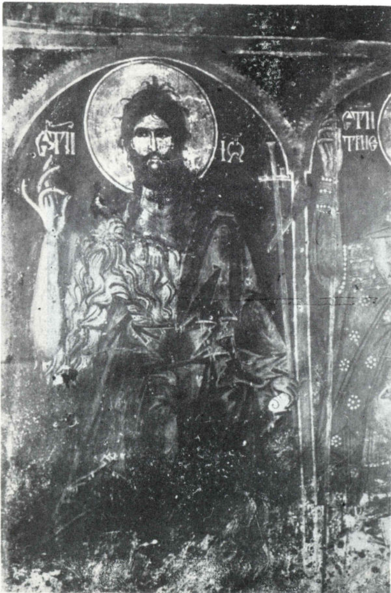
Сл. 12 Никоље, наос. Св. Јован Крститељ, 1697.