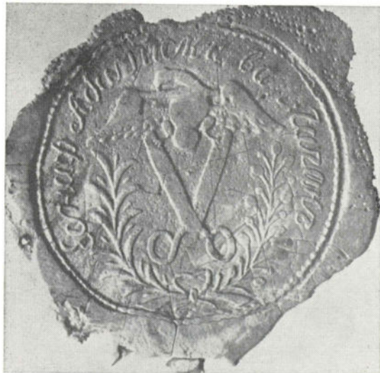
Сл. 2. Печат еснафа абацијског