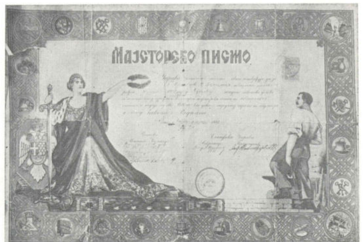
Сл. 3. Мајсторско писмо