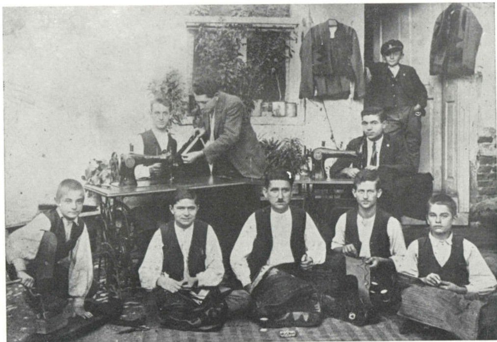
Сл. 4. Чачанске абације на свом свакодневном послу