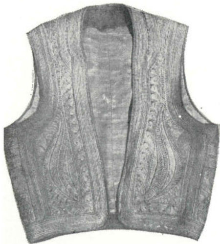
Сл. 5. Мушки фермен