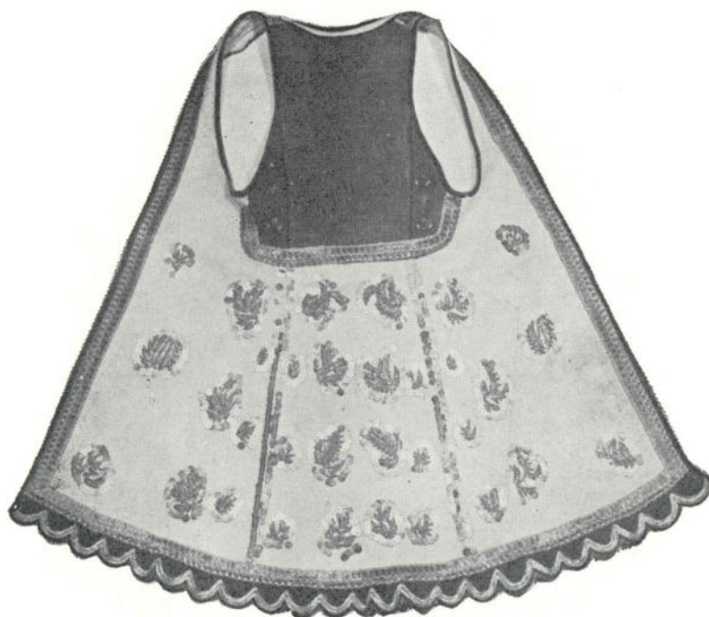
Сл. 6. Зубун кнегиње Љубице