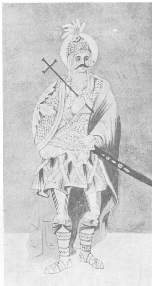
Сл. 4. Стеван Никшић Лала, Милош Обилић, копија фреске, 1906.