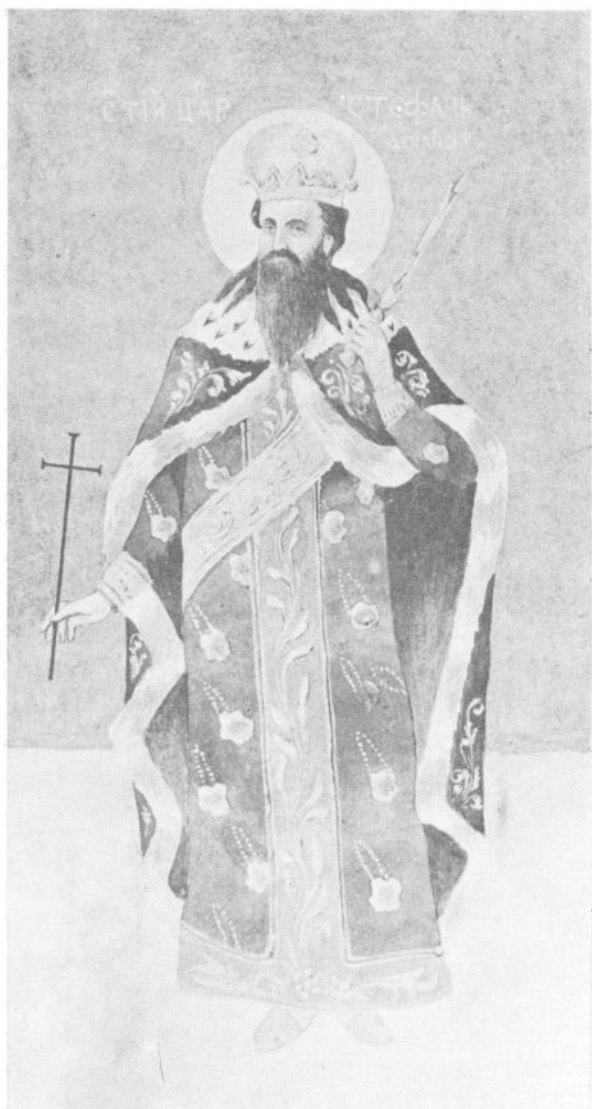
Сл. 3. Стеван Никшић Лала, Цар Стефан Дечански, копија фреске, 1906.