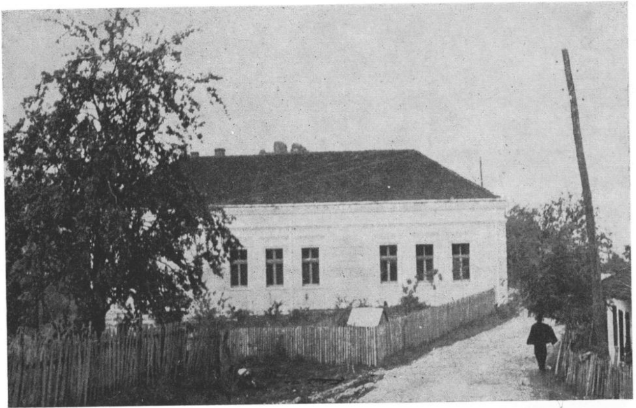
Сл. 5. Школска зграда у Каони саграђена 1905. године