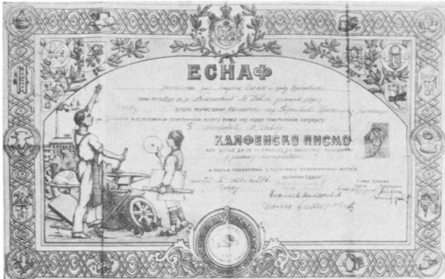
Сл. 5. Калфенско писмо качарског заната из 1930. године.