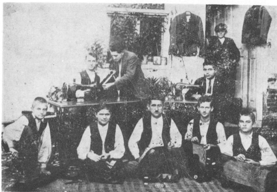
Сл. 1. Чачанске абације на свакодневном послу, 1938. године