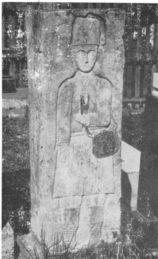
Сл. 8. Надгробни споменик у Гојној Гори, крај XIX века, рад локалних мајстора.