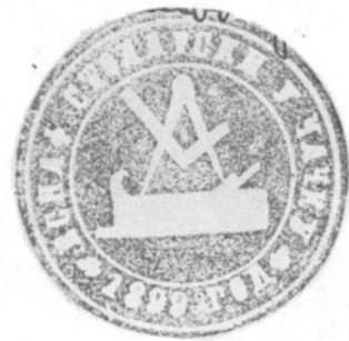
Сл. 6. Печат столарског еснафа у Чачку из 1899. године.