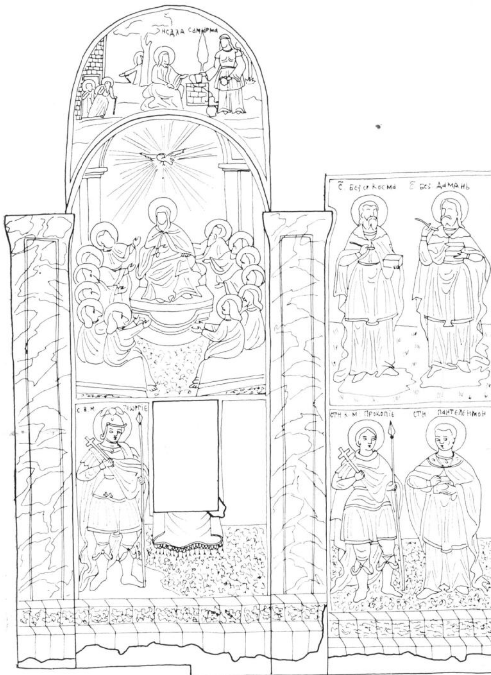
Сл. 3 Манастир Никоље у Доњој Шаторњи, живопис на северном зиду наоса (цртеж Драгана Милосављевић)