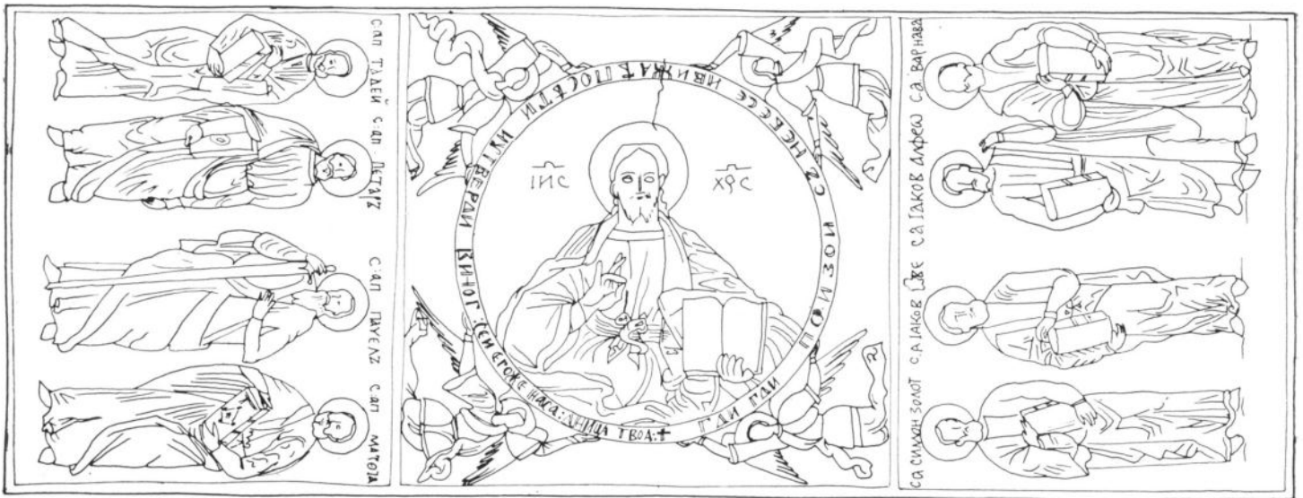
Сл. 5 Манастир Никоље у Доњој Шаторњи, живопис на своду источног травеја (цртеж Милана Ђокића)