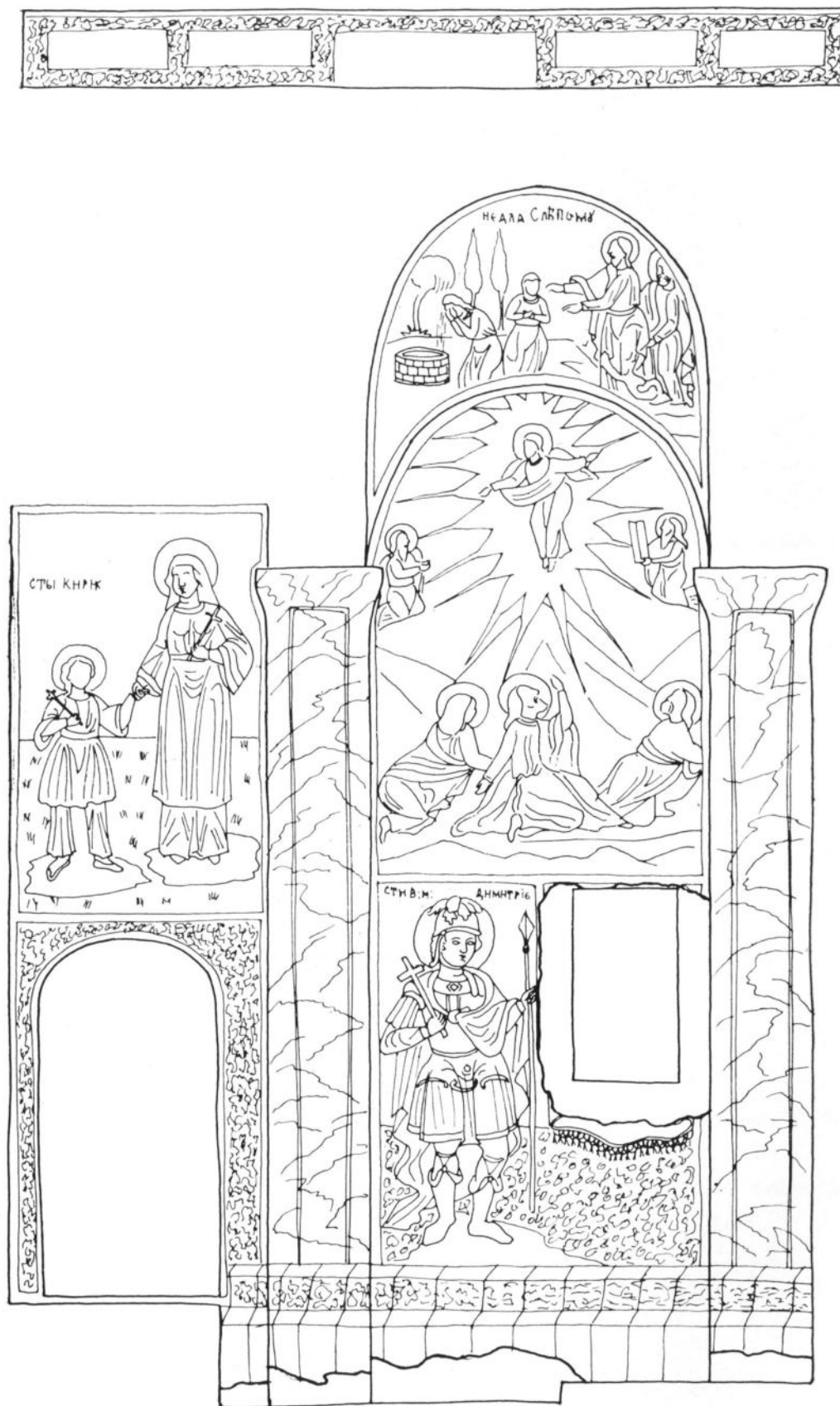
Сл. 4 Манастир Никоље у Доњој Шаторњи, живопис у јужном зиду наоса (цртеж Драгана Милосављевић)