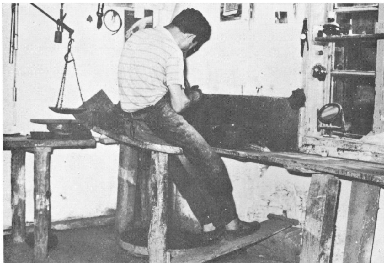
Сл. 2 Грнчар при раду