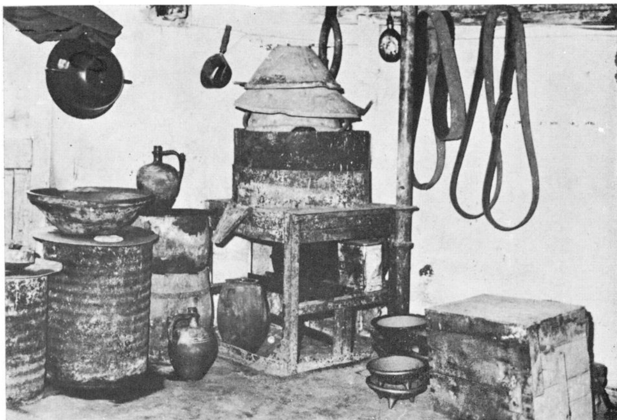
Сл. 3 Машина за млевање глеђи