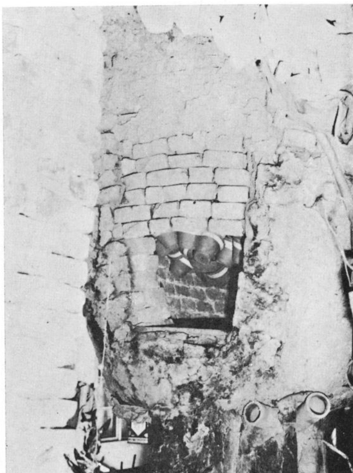
Сл. 4 Грнчарека фуруна