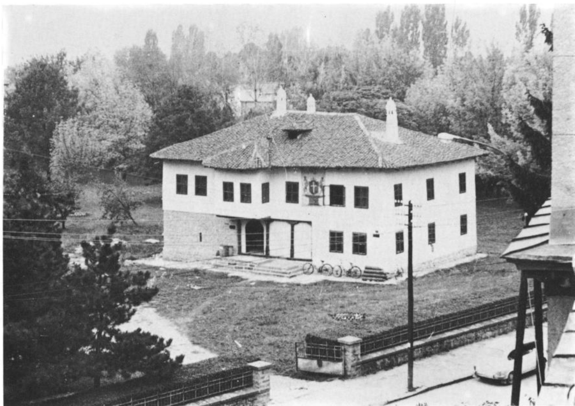
Сл. 4: Конак господара Јована Обреновића – данас Народни музеј