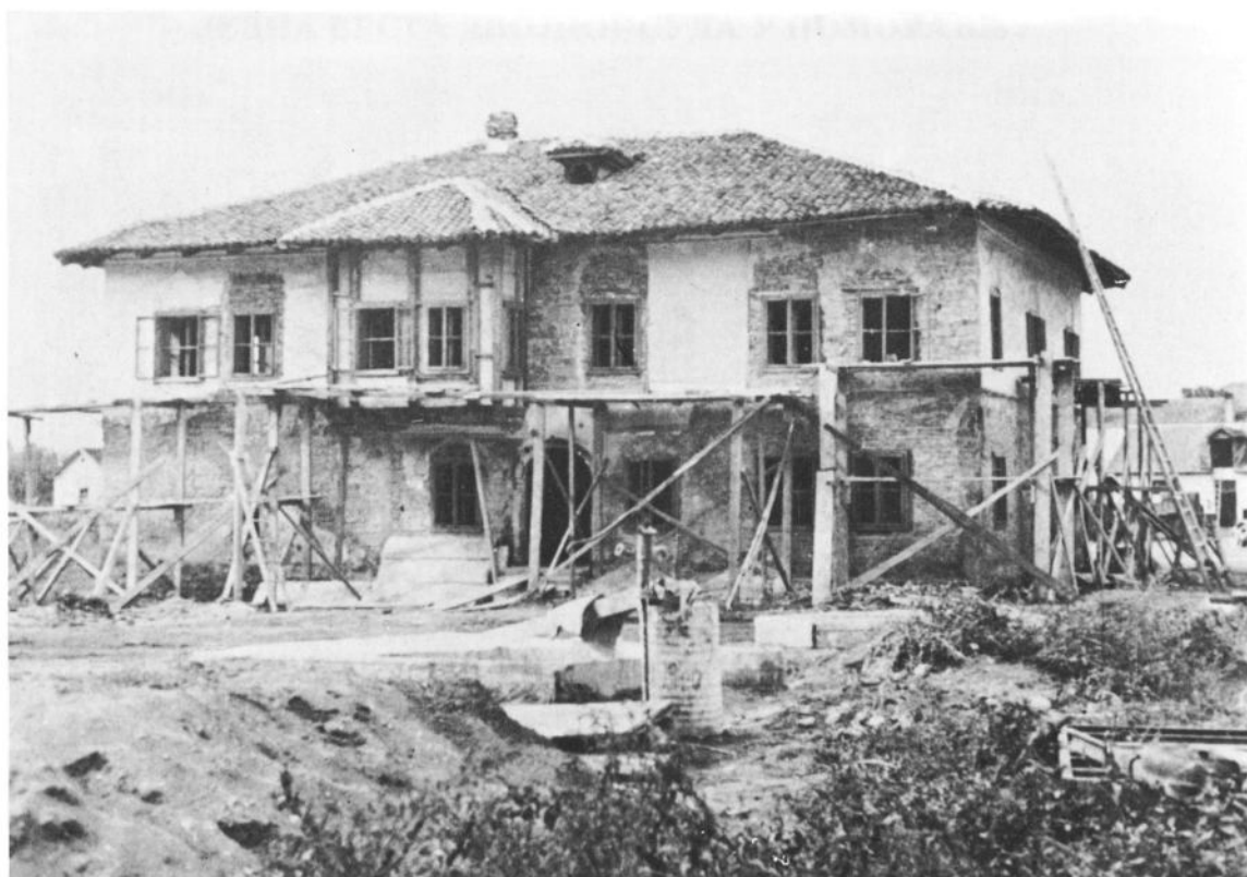
Сл. 2: Реставраторски радови на конаку господара Јована Обреновића