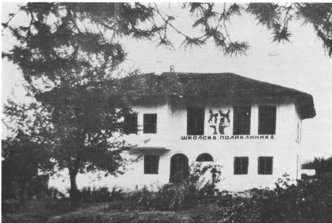
Сл. 1: Конак господара Јована Обреновића као школска поликлиника