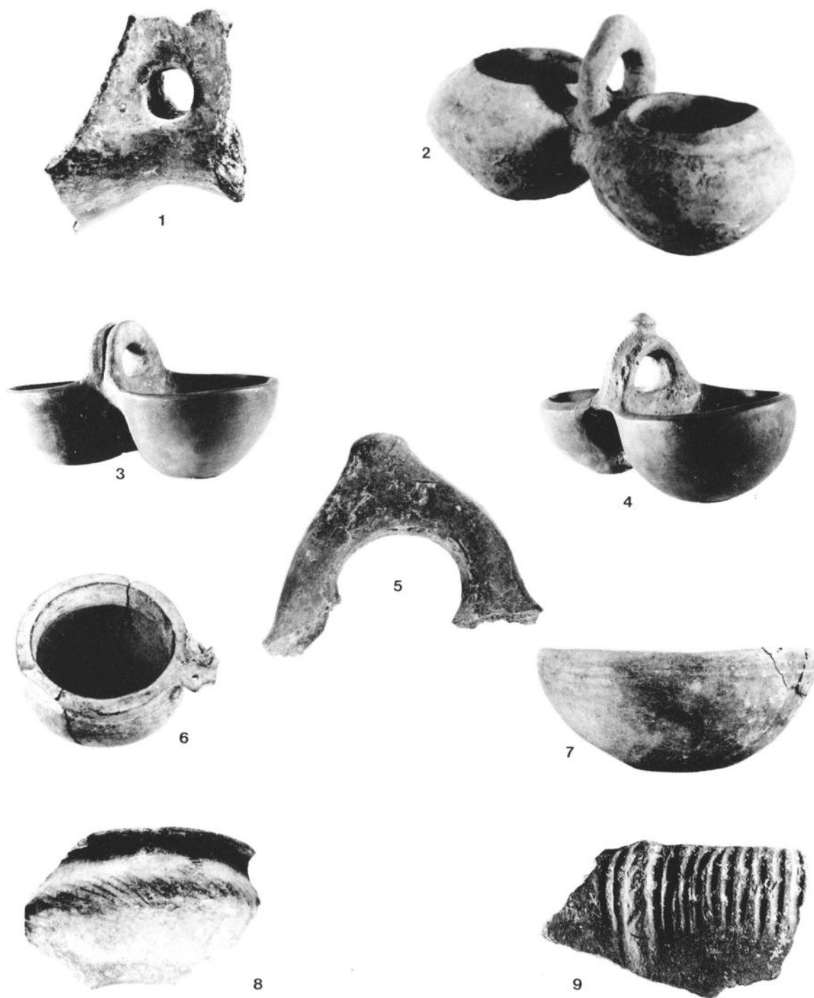
Сл. 1-3: Мајур, локалитет Вецина мала; сл. 2: Параћин, локалитет Глождан; сл. 4: Доње Штипље, локалитет Милићевска река; сл. 5, 7 и 9: Драгоцвет, локалитет Врбице; сл. 6 и 8: Свилајнац, локалитет Гробље