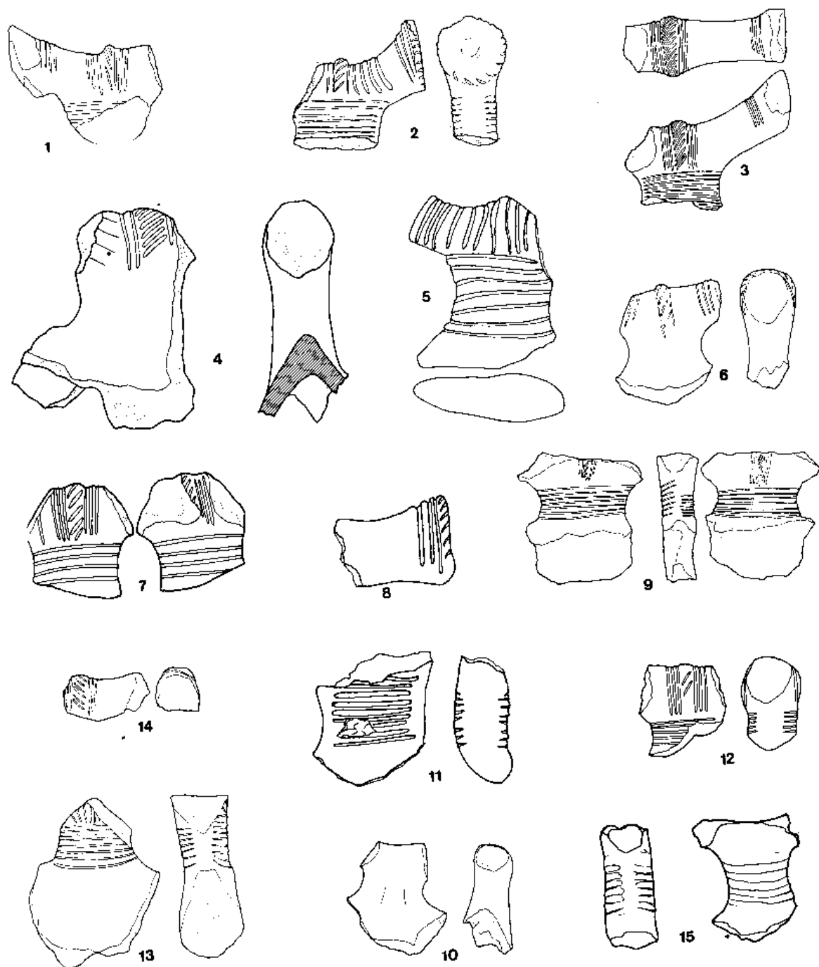
Сл. 1-4; 6-7; 9-15: Јагодина, локалитет Пањевачки рит; сл. 5: Ниш, локалитет Медијана; сл. 8: Топола, локалитет Виначко поље