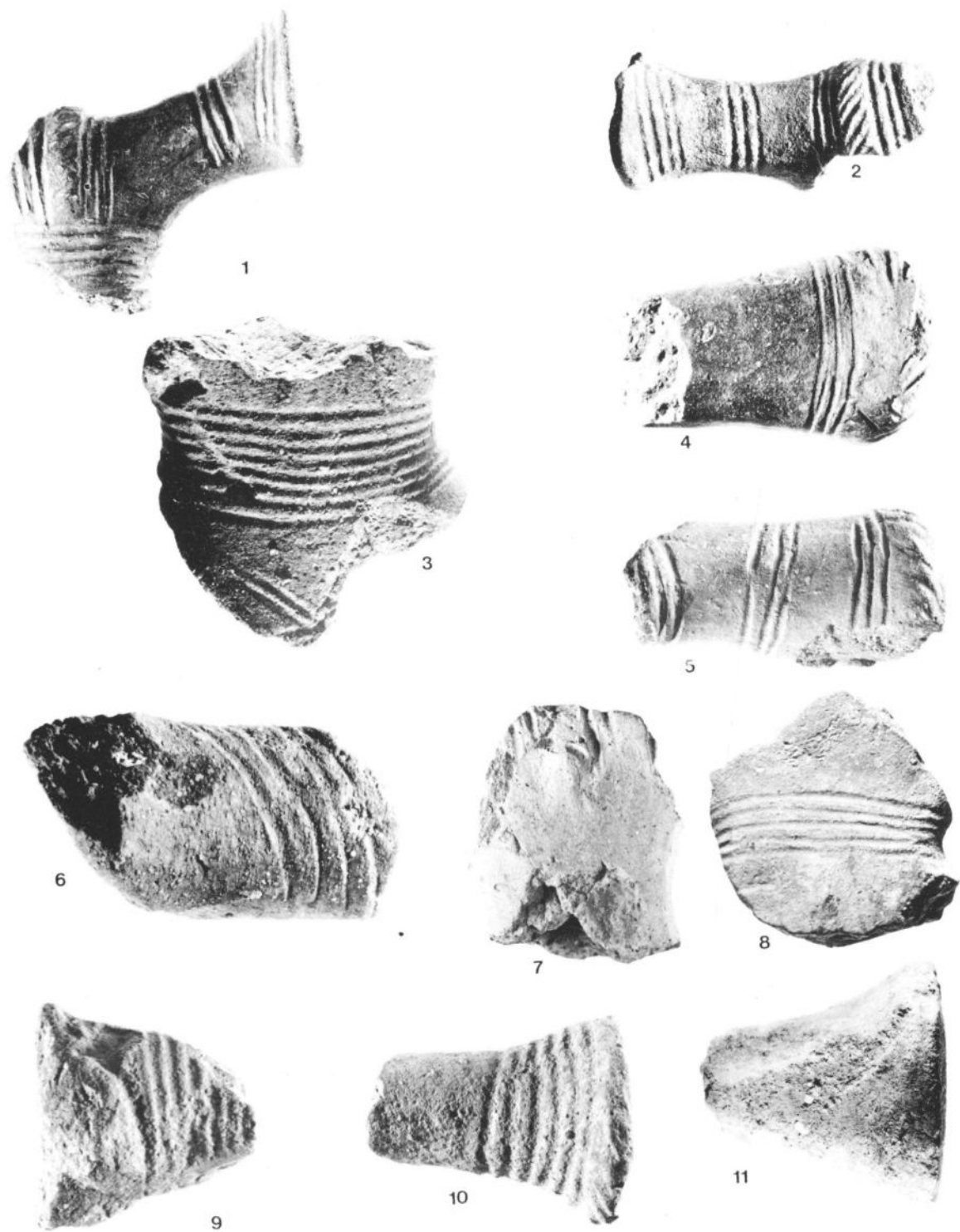
Сл. 1-3: Драгоцвет, локалитет Врбица; сл. 4-7: Винорача, локалитет Баре; сл. 8: Доње Штиплје, локалитет Милићевска река; сл. 9-10: Шуљковац, локалитет Ћосин поток; сл. 11: Дубока, локалитет Селиште