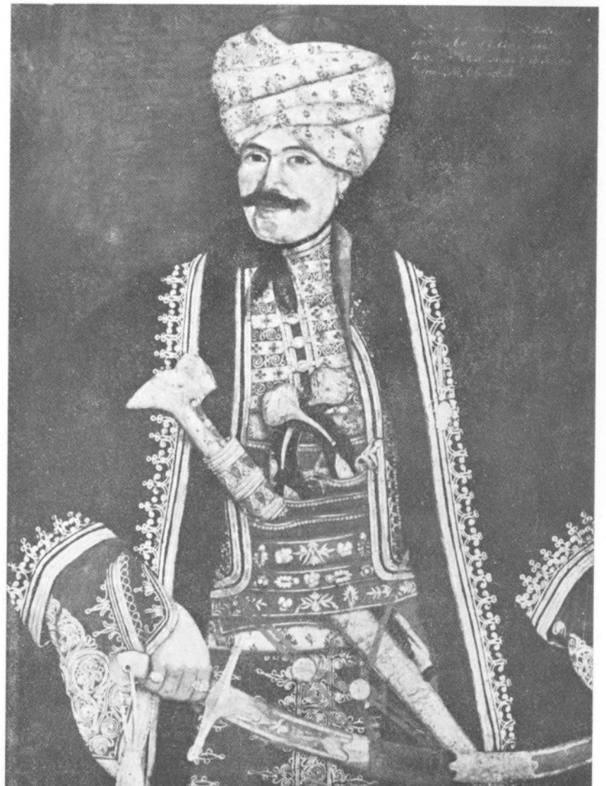
Сл. 3. Урош Кнежевић: Генерал Јован Обренивић (власник Народни музеј у Београду)