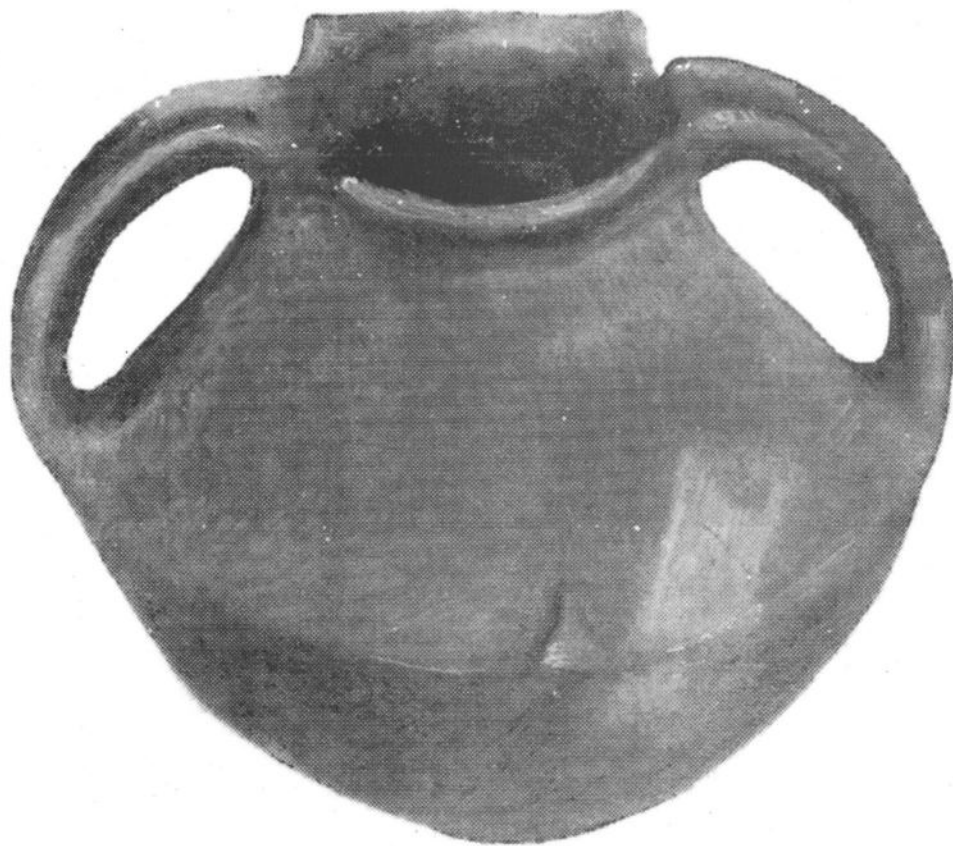
Остра - Соколица, ватински пехари