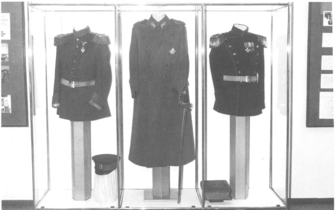
Из збирке униформи историјског одељења