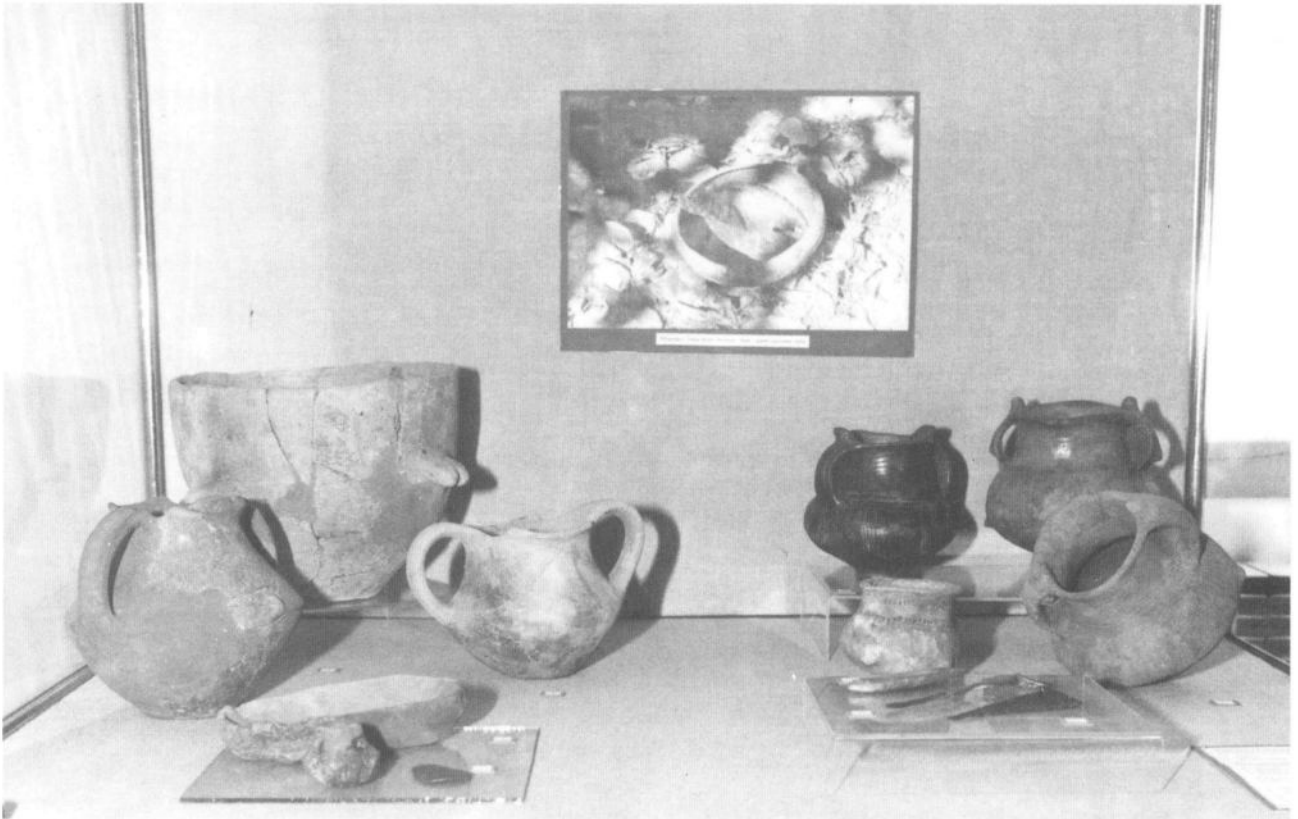
Из збирке археолошког одељења