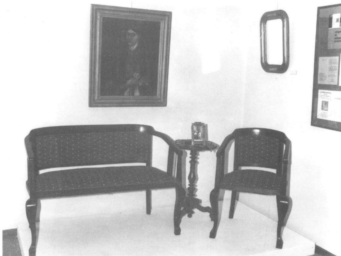
Из збирке уметничког одељења