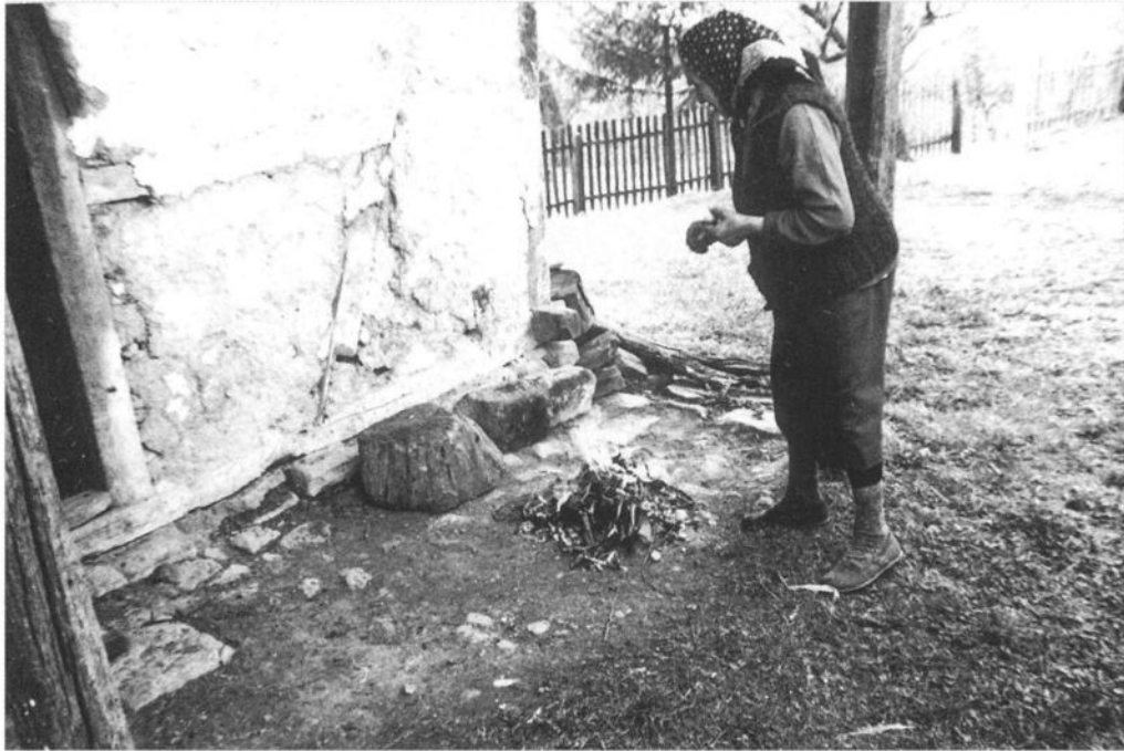
Спаљивање кора од јаја на Беле покладе село Остра код Чачка, 2002.