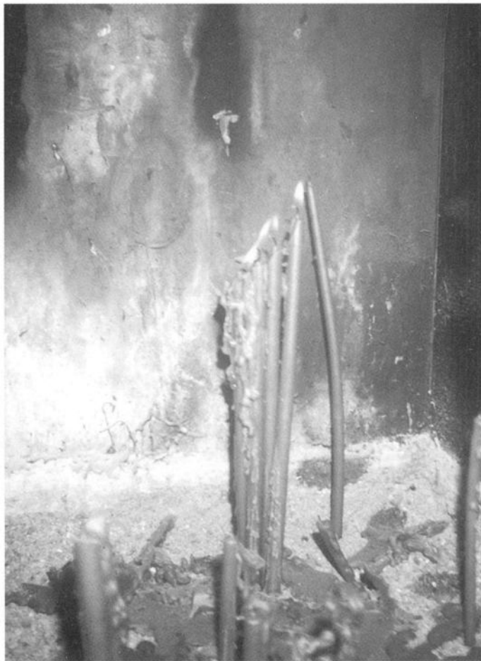
Свеће упаљене „за здравље“, манастир Вујан, Чачак, Васкрс, 2003.