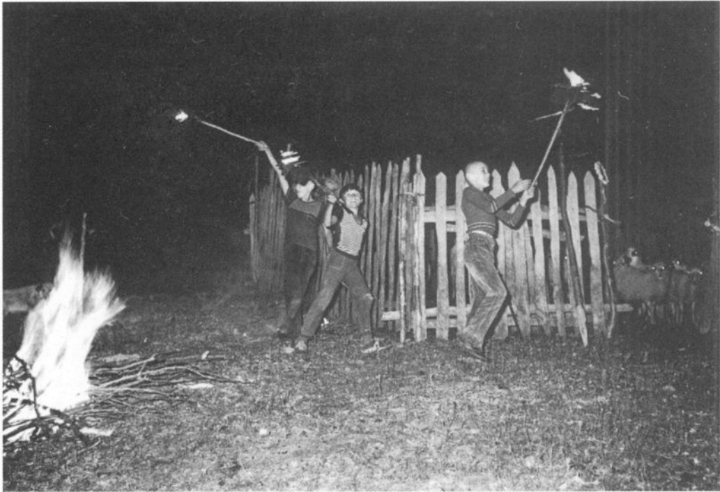
Паљење Лила у целу Ерчеге, Ивањица уочи Петровдана, 1976.