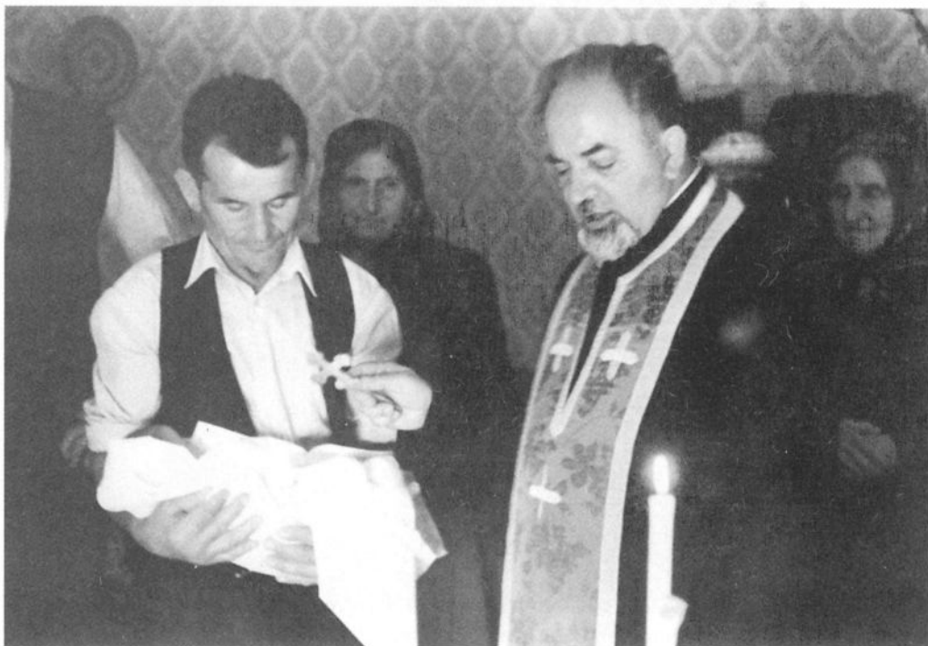
Крштење детета, Чачак, 1991.