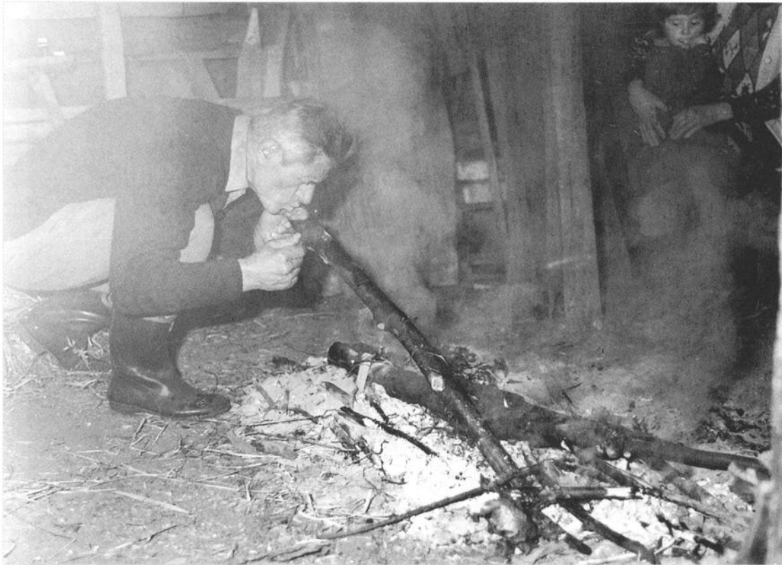
Домаћин љуби бадњак на кућном огњишту, село Зеоке, Драгачево 1993.