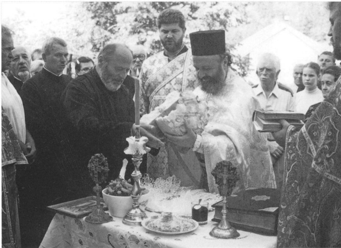
Ломљење славског колача, порта манастира Вујан, Млади Арапђеловдан, 2000.