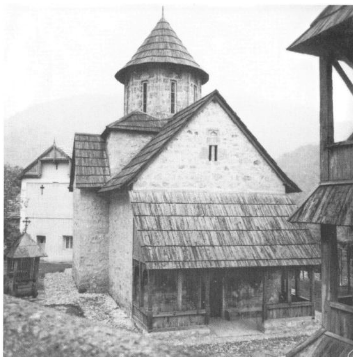
Манастир Благовештење, поглед са северозапада