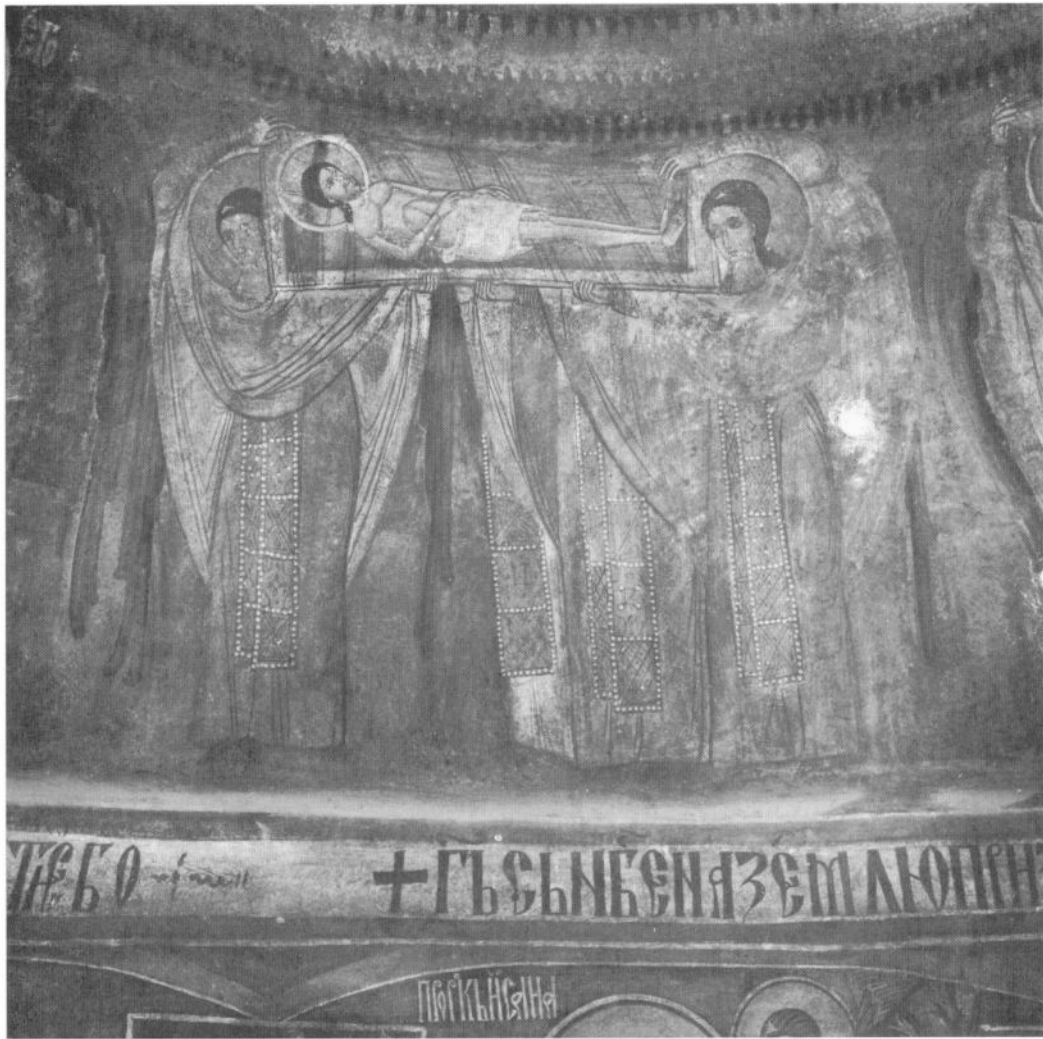
Црква манастира Благовештења, купола, Велики вход