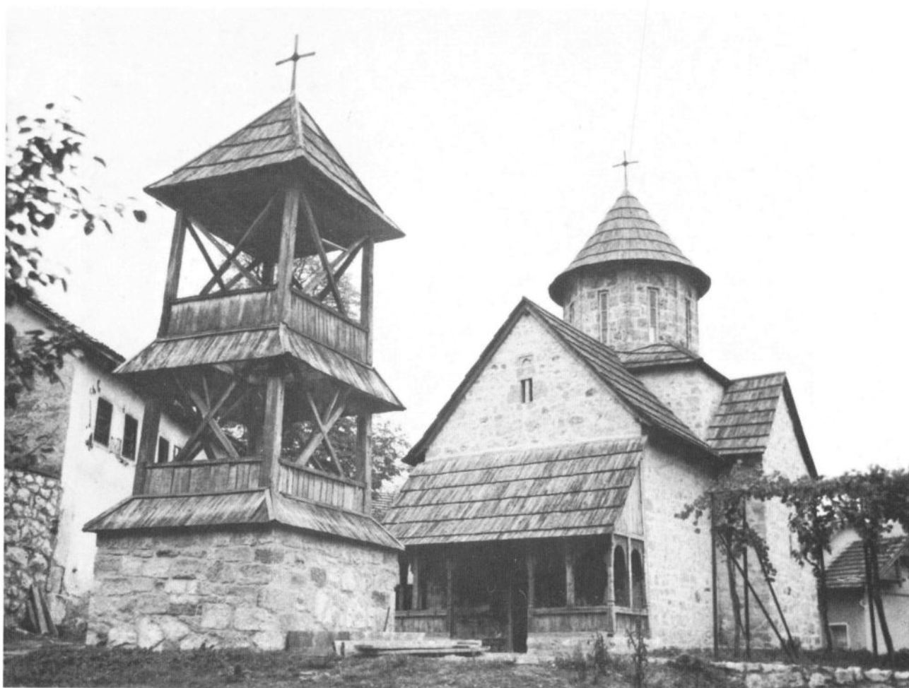
Манастир Благовештење, поглед са југозапада