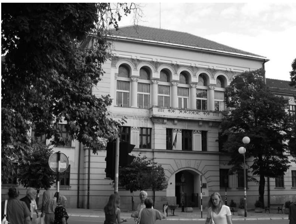
Гимназија, данашњи изглед