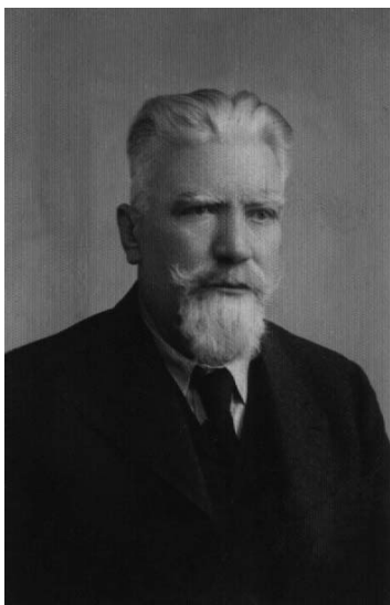
Портрет Драгутина Маслађа