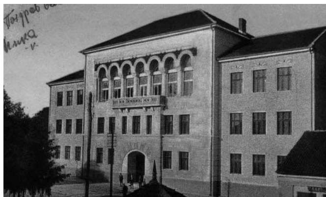
Гимназија у Чачку - разгледница (4. децембар 1927)