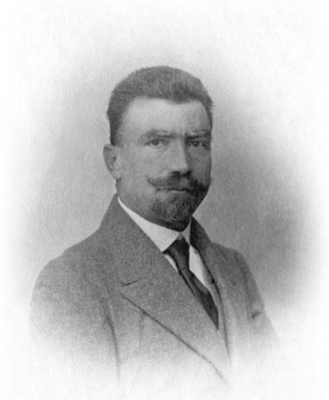
Портрет Драгутина Маслаћа