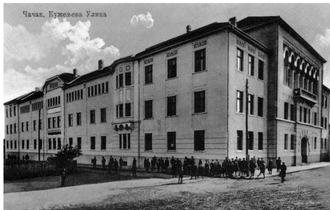
Гимназија у Чачку - разгледница (19. новембар 1935)