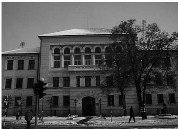
Гимназија у Чачку, данашњи изглед