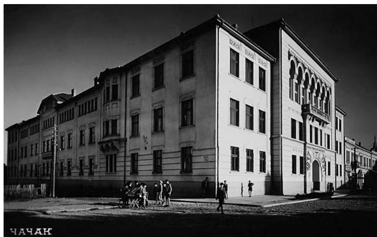
Гимназија у Чачку - разгледница (12. април 1946)