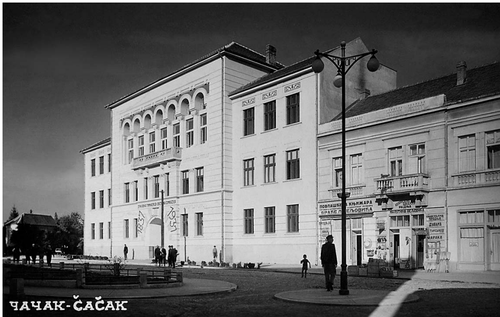
Гимназија у Чачку - разгледница (13. јул 1940)