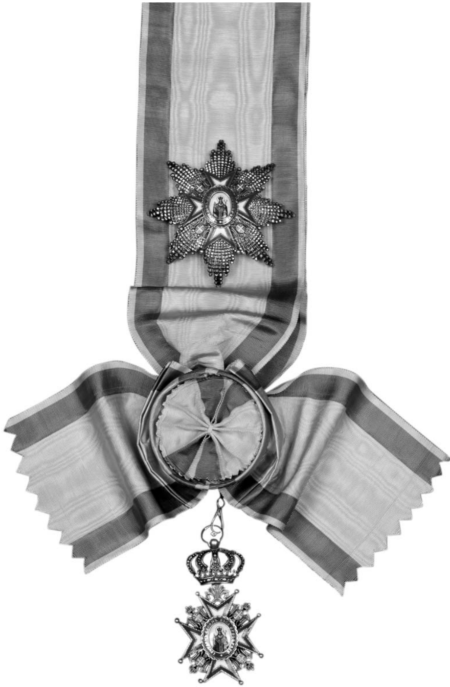
Сл. 1 Орден Светог Саве I реда