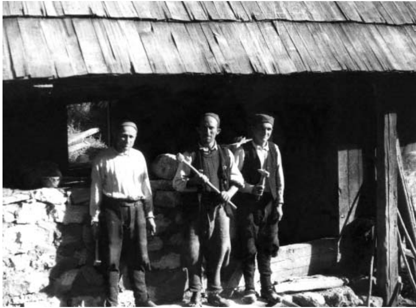
Група зидара у Медовинама код Ивањице