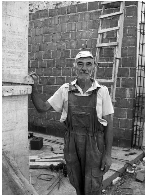
Главни мајстор грађевине