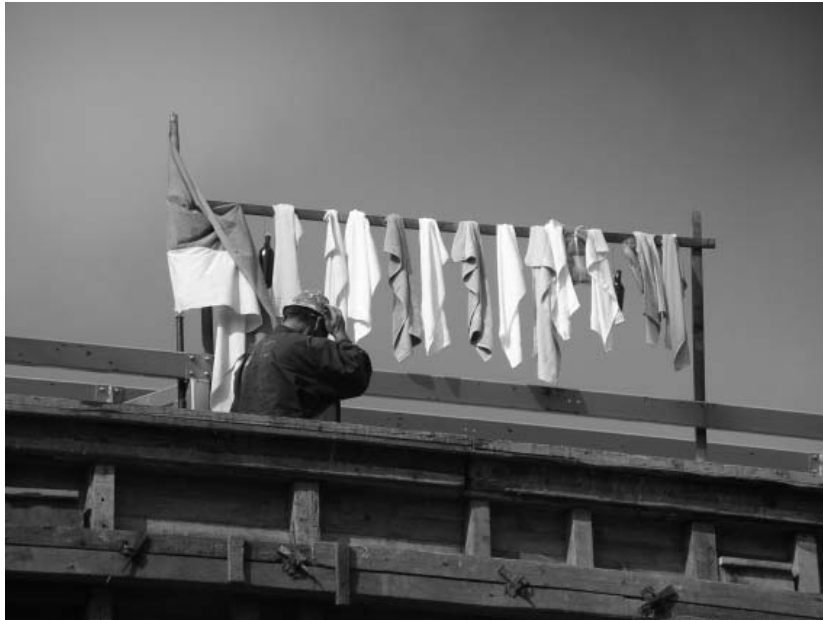
Рогови парохијског дома цркве Светог Вазнесења у Чачку