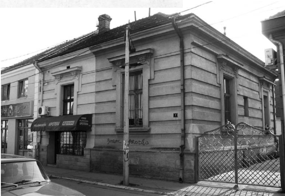
Некадашња кућа В. Миликића (данас у Обилићевој 7)