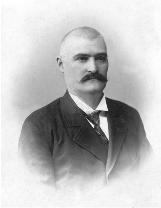
Веселин Миликић 1908. године