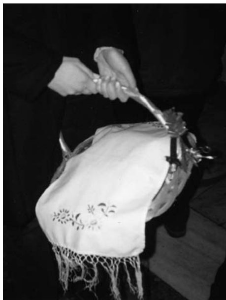
Сл. 4 Славски колача у цркву, Чачак, Јовањдан, 20. 1. 2004. године