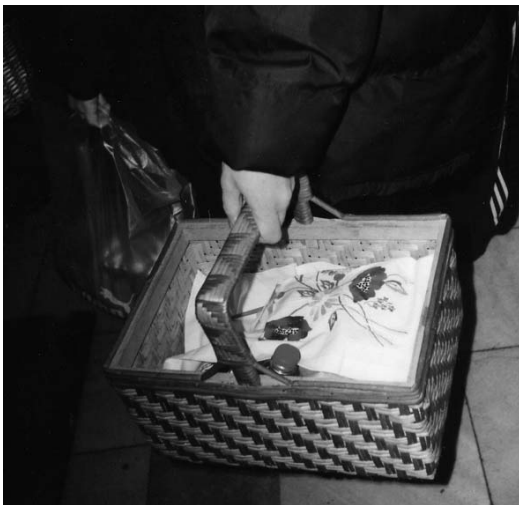
Сл. 3 Ношење Славског колача у цркву, Чачак, Јовањдан, 20. 1. 2004. године