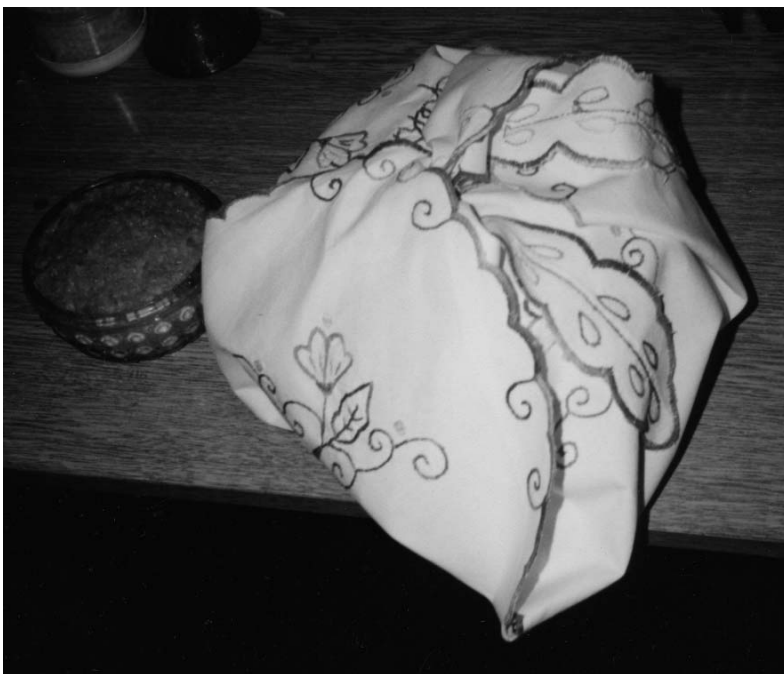
Сл. 5 Славски колач и жито у цркви, Јовањдан, Чачак, 20. 1. 2004. године