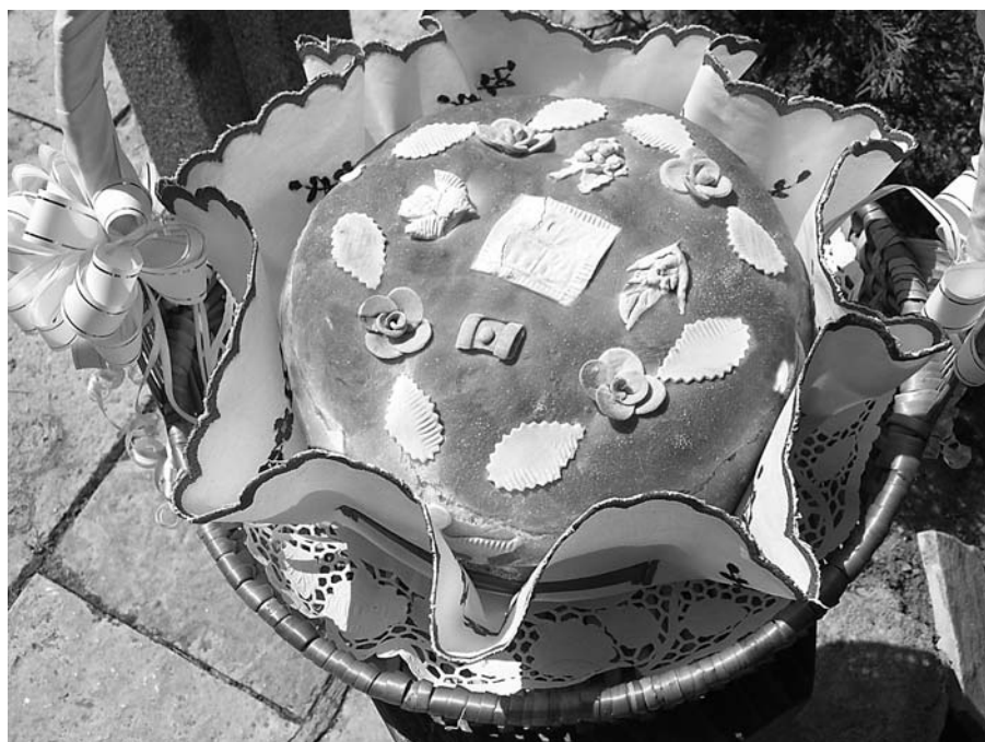
Сл. 2 Славски колач