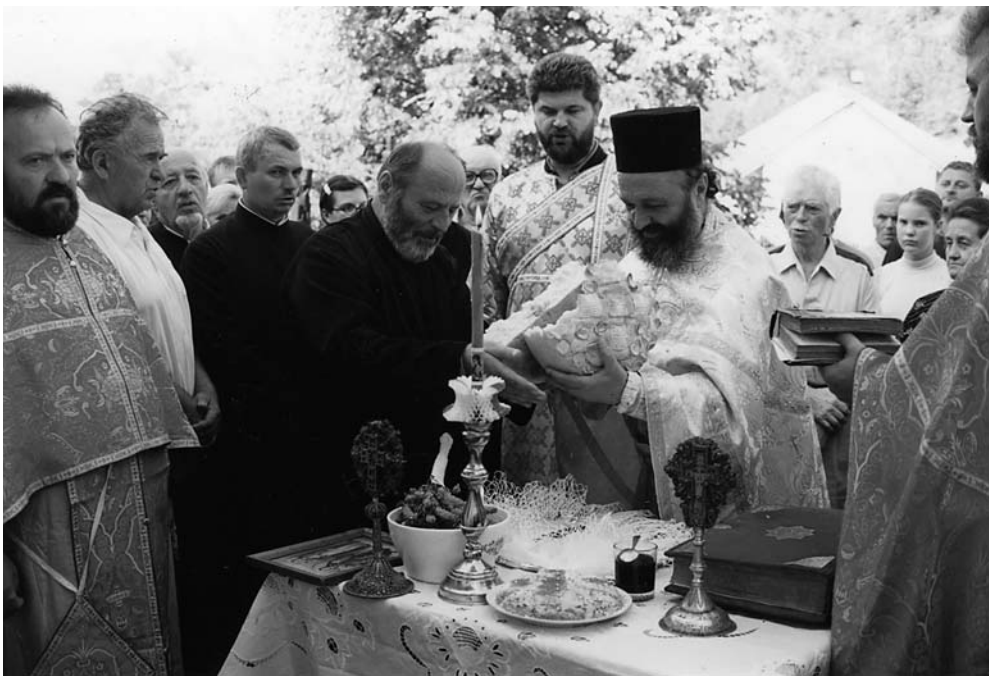
Сл. 9 Ломљење славског колача, порта манастира Вујан, млади Аранђеловдан, 2000. године