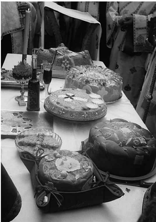
Сл. 8 Спасовдан, Чачак, 2004. године