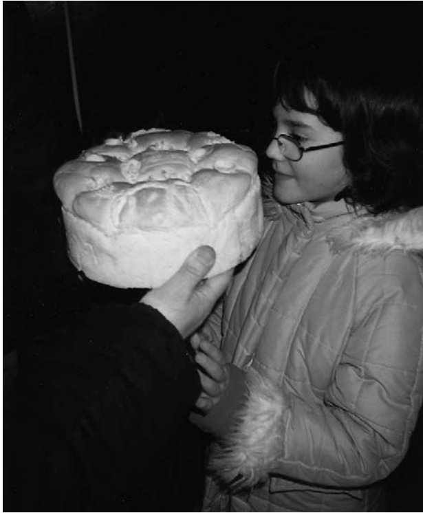
Сл. 6 Окретање Славског колача за светог Јована, Чачак, 20. 1. 2004.