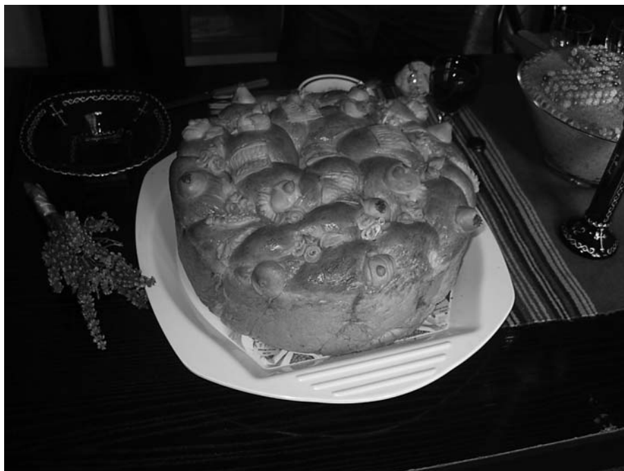
Сл. 1 Славски колач, жито