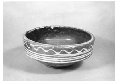
Сл. 14 Чинија, Горњи Милановац, инв. бр. 1546/84, каталошки бр. 55