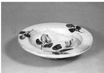
Сл. 15 Тањир, Бресница, Чачак, инв. бр. 1543/82, каталошки бр. 72