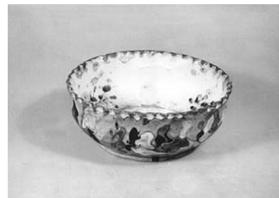
Сл. 16 Чанак, Рошци, Чачак, инв. бр. 1544/80, каталошки бр. 82