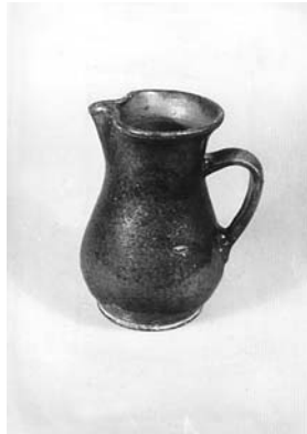
Сл. 20 Бокал, Парменац, Чачак, инв. бр. 1547/79, каталошки бр. 120