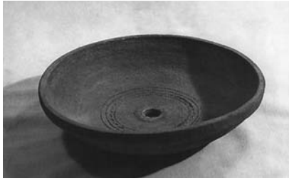
Сл. 11 Црепуља, Горња Крварица, Лучани, инв. бр. 571/68, каталошки бр. 3