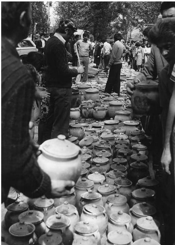
Сл.1 Продаја грнчарских производа на вашару у Чачку 1974. године