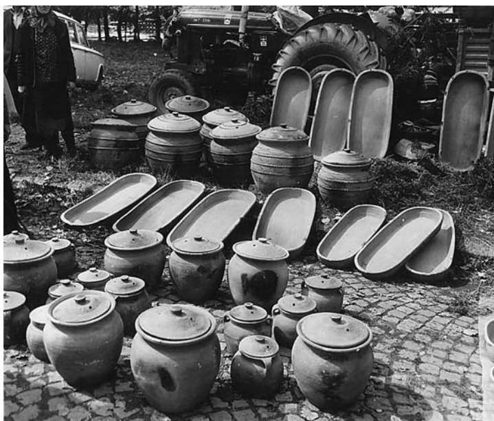
Сл. 2 Продаја земљаних лонаца и пека на вашару у Чачку 1974. године