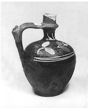
Сл. 22 Тестија, Чачак, инв. бр. 725/81, каталошки бр. 126