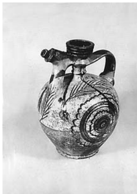
Сл. 23 Бардак, Бресница, Чачак, инв. бр. 1549/82, каталошки бр. 137