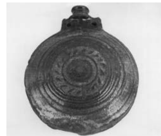
Сл. 24 Пљоска, Ерчеге, Ивањица, инв. бр. 1908/81, каталошки бр. 147