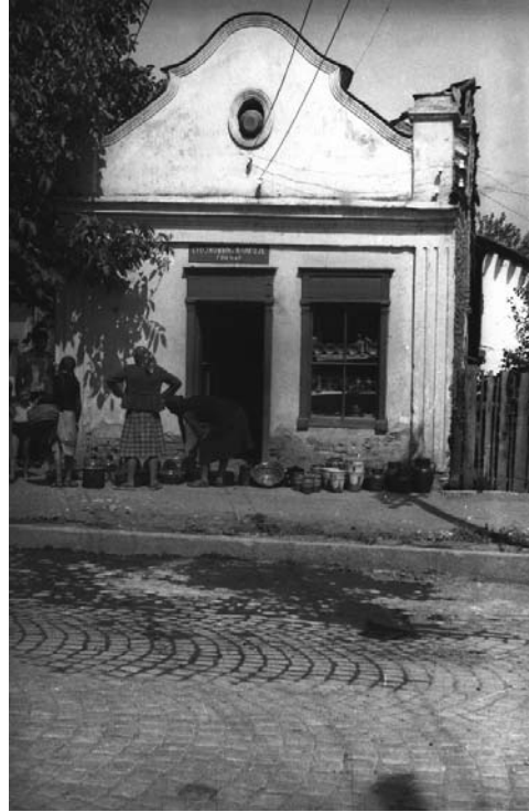
Сл. 4 Грнчарска радња Благоја Стојковића у Чачку