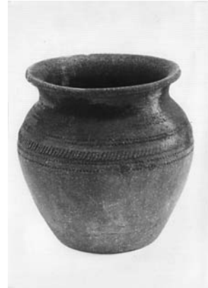
Сл. 12 Лонац, Бељина, Чачак, инв. бр. 1905/79, каталошки бр. 37