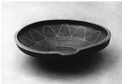
Сл. 13 Керамичка карлица, Прислоница, Чачак, инв. бр. 1456/82, каталошки бр. 49