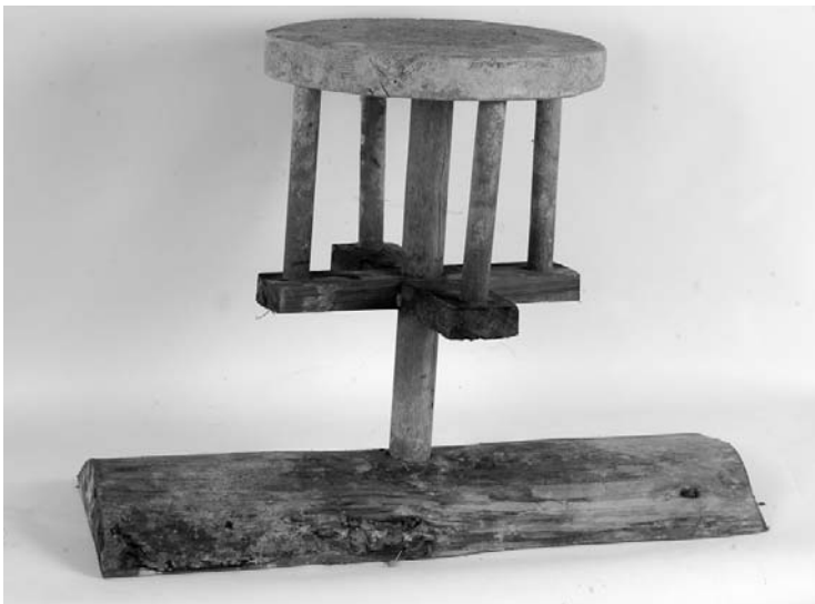
Сл. 5 Ручно грнчарско коло, Сирогојно, Ужице, инв. бр1605/92