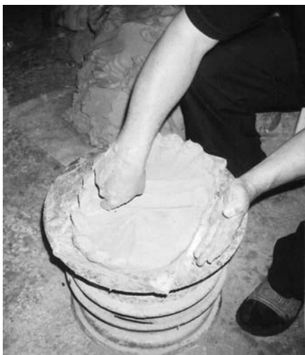
Сл. 6 Грнчар ради на ручном колу, Злакуса 2003. године