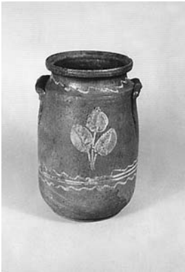
Сл. 19 Ђуп, Бресница, Чачак, инв. бр. 1538/82, каталошки бр. 103