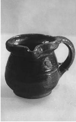
Сл. 17 Лонче, Котража, Лучани, инв. бр. 546/68, каталошки бр. 91