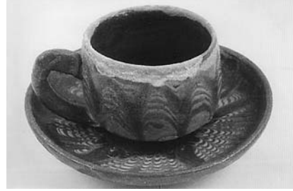
Сл. 18 Шољица за кафу, Катићи, Ивањица, инв. бр. 1573/81, каталошки бр. 101