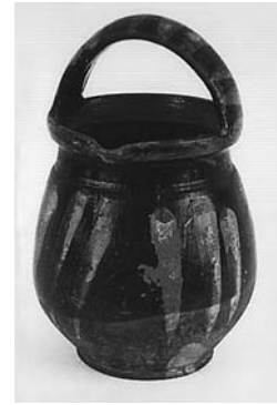
Сл. 21 Ручка, Мочиоци, Ивањица, инв. бр. 835/85, каталошки бр. 124