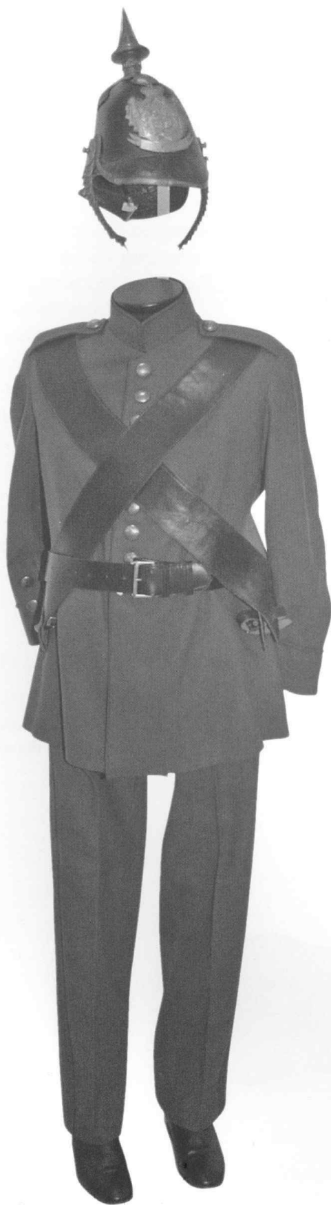
Униформа српског редова М.1847, власништво Војног музеја