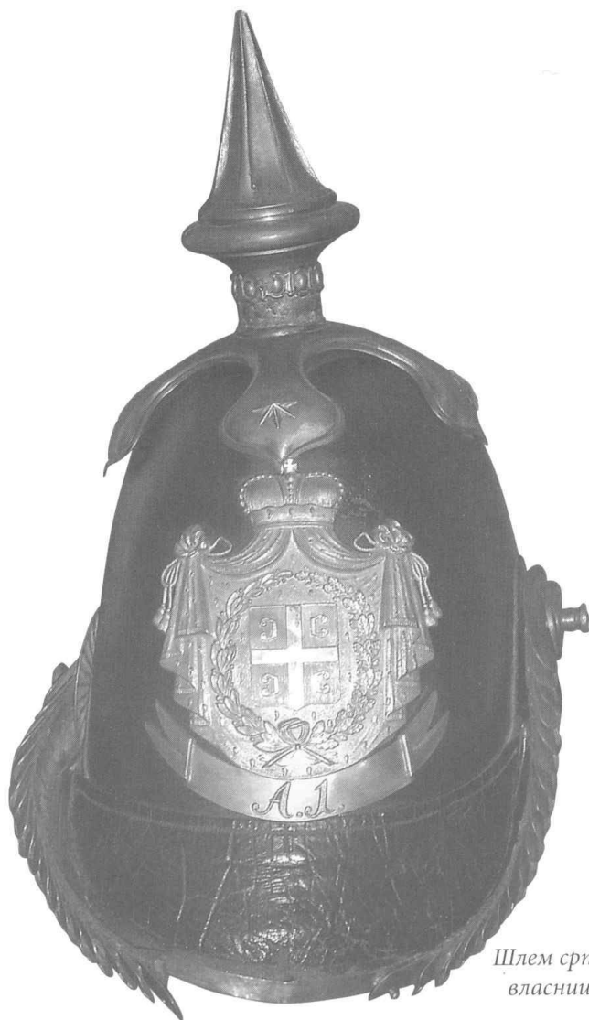
Шлем српског редова М. 1847, власништво Војног музеја