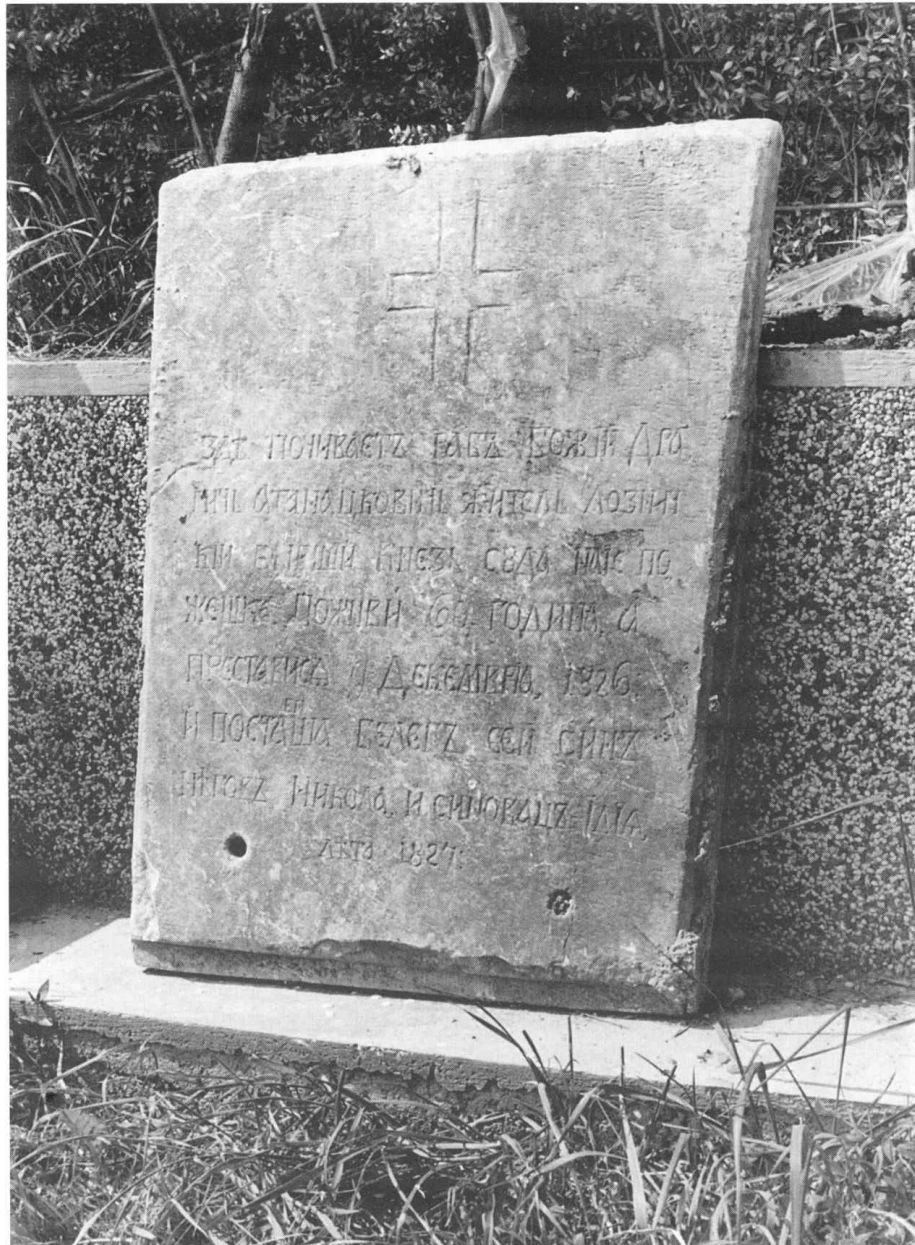
1 – Надгробни споменик, најстарији датирани споменик у Горњем лозничком гробљу. Измештен је са првобитног места тако да се не зна да ли је имао још неки део.