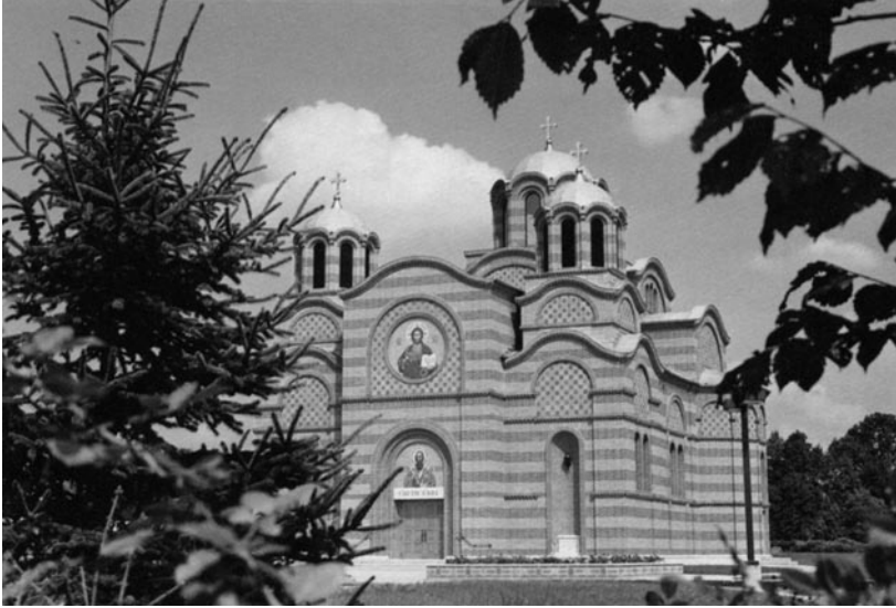
Слика 3 - Црква Светог Саве, проглашена за грађевину године у Кливленду, Охајо