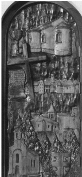
Слика 9 - Јужна врата