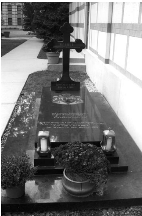
Слика 12 - Гроб са спомеником Иринеју митрополиту Ново Грачаничком Септембар 6. 1914 Фебруар 2. 1999 На мермерној плочи уписан текст: За слободу Српског рода цео живот радио је, да се Срби Богу моле Грачаницу подиг"о је." Исти текст уклесан је и на енглеском језику. Гроб је поред јужног зида Нове Грачанице