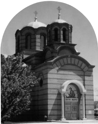
Слика 4 - Црква Светог апостола Марка у Лорену