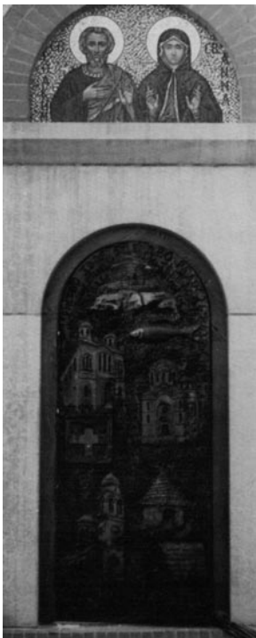
Слика 8 - Северна Врата