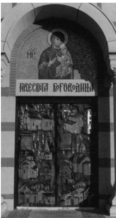
Слика 10 - Западна врата