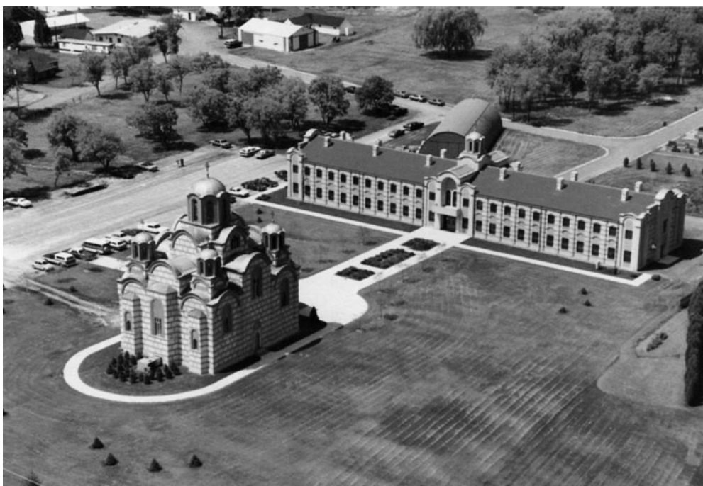
Слика 7 - Нова Грачаница и владичански двор