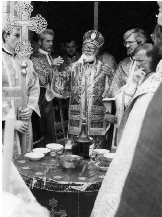
Слика 5 - Епископ Иринеј освећује Нову Грачаницу