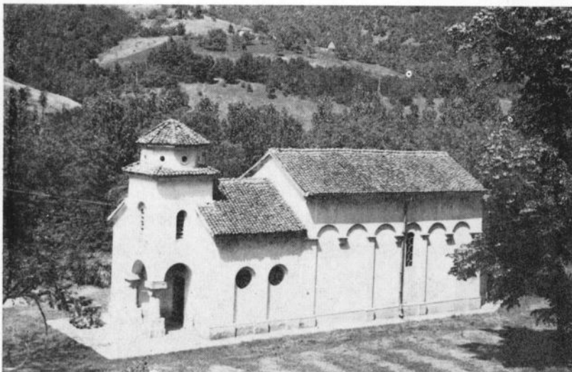
Сл. 2. Манастир Ваведење, југозападна страна