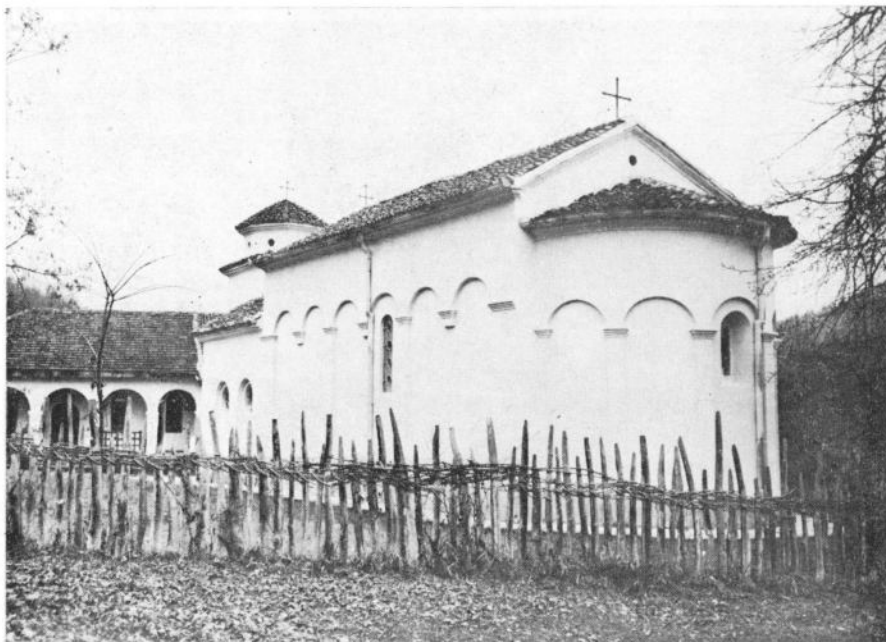
Сл. 3. Манастир Ваведење, југисточна страна