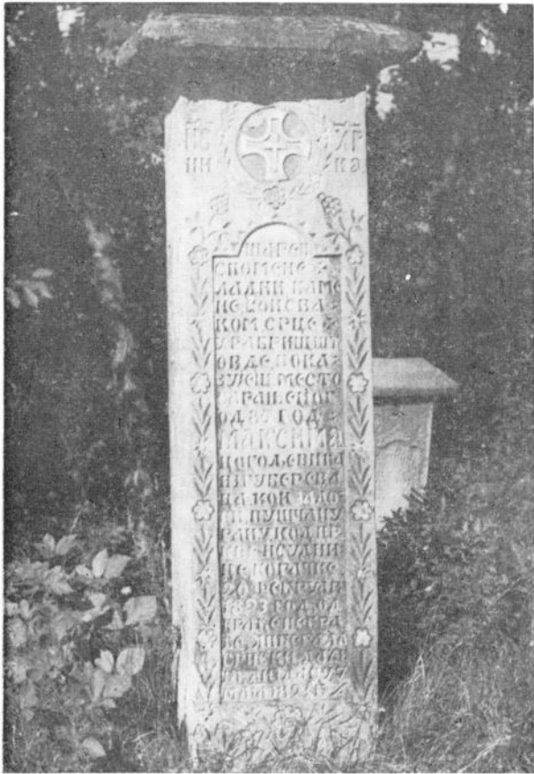
Сл. 3. Споменик Максиму Цогољевићу (Плазичића гробље — Горачићи)