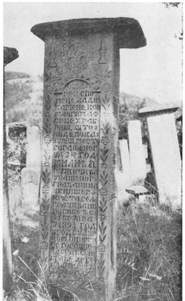
Сл. 2. Споменик Милићу Ружичићу (Ружичића гробље — Горачићи)