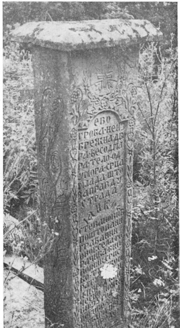
Сл. 4. Споменик Јанку Стевановићу (Сје- ничкића гробље — Горачићи)