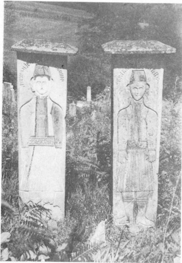
Сл. 1. Споменици браћи Басарић (Гендића гробље — Губеревци)