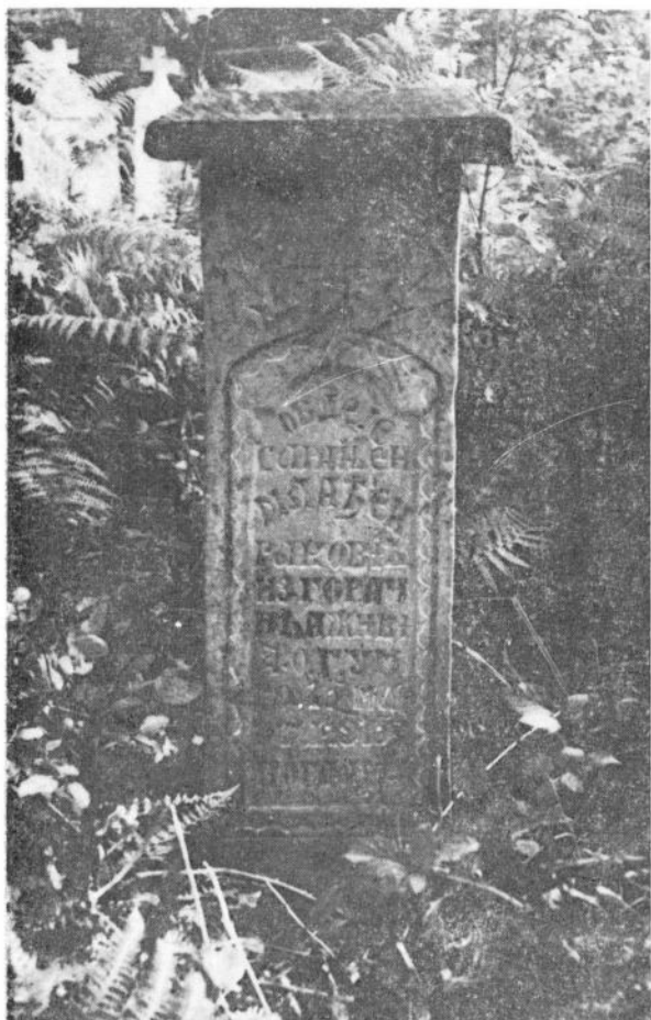
Сл. 5. Споменик Млађена Раковића (Су- рудића гробље — Гџрачићи)