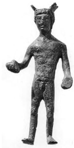
Сл. 9 – Меркур из Харлена