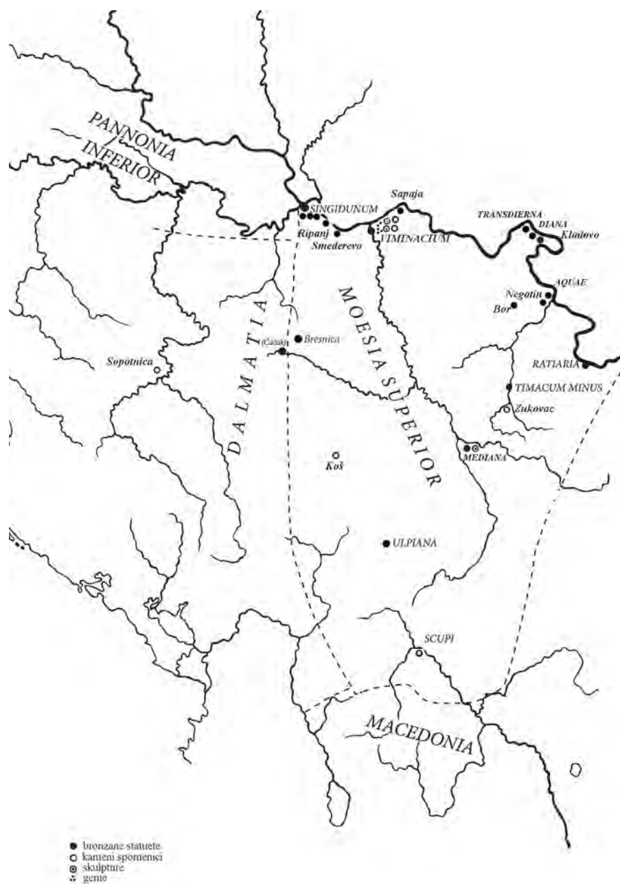
Табла I – Сл. 1 Карта распрострањености споменика Меркуровог култа у Горњој Мезији (приредила Г. Јерemiћ)