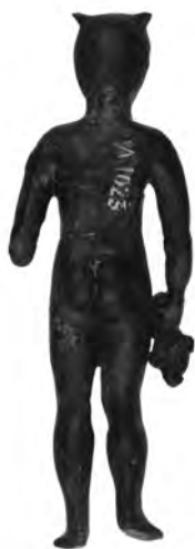
Сл. 5 (задња страна)