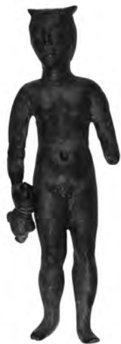
Сл. 2 (фронтална страна)