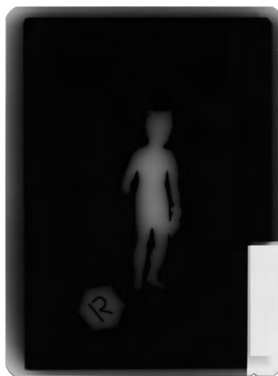
Сл. 6 (рендгенски снимак)