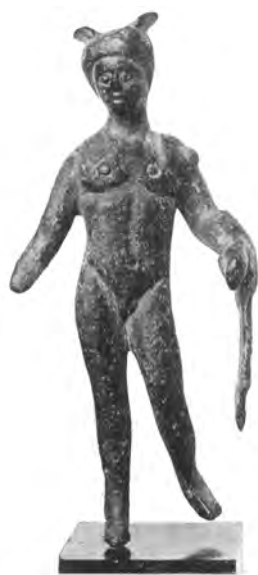
Сл. 8 – Меркур из Кладова (према: Brunšmid 1914, kat. 29)