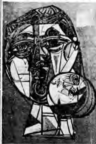
Лазар Возаревић: Материнство (Са изложбе у Чачку)

вић продубљује своје раније тежње, с циљем да што више обогати колористички доживљај, да га што више оплемени у изразу, супротно ранијим радовима у којима је био више испољено графички карактер. Иван Табаковић је један од неуморних истраживача који каткада све стављају на коцку. Његово интересовање за хармоније основних боја, за приказивање неуобичајених мотива који су увек подвргнути строгим ликовним постулатима, уздижу га на нарочито истакнуто место међу нашим сликарима. Јован Бијелић се са више одлучности приближио фигуративном домену него раније, унесећи у то ранија схватања о форми и о валерским односима, која много потсећају на његово сликарство с почетка тридесетих година, иако су мотиви сасвим другачији. Лазар Возаревић је један од најистакнутијих излагача на изложби. Његова слика „Обешени“, иако рађена у његовом познатом стилу, представља на изложби нешто ново и занимљиво, један истраживачки напор, који Возаревићу обезбеђује лепо место у нашем сликарству.