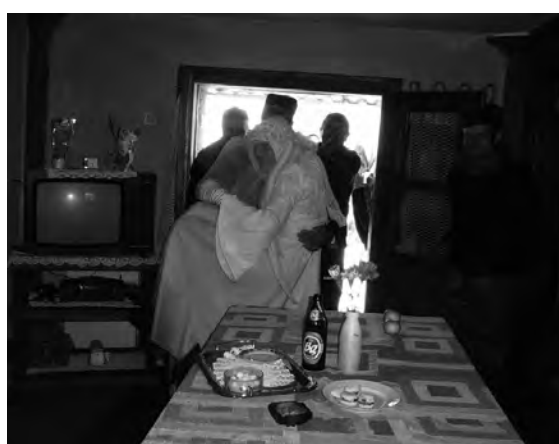
Уношење младе, Бела недеља, Остра (2005), фото др Весна Марјановић