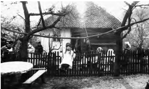
Обредно љуљање, Остра (2004), фото С. Ашанин