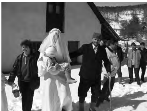
Млада у рукама држи дете, Остра (2005), фото С. Ашанин