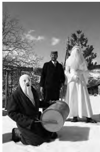
Маскирани бубњар, Остра (2005)