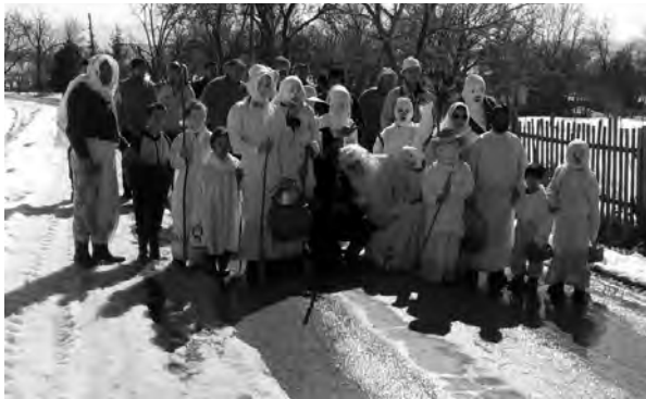
Бела недеља, Чачак, (2005)