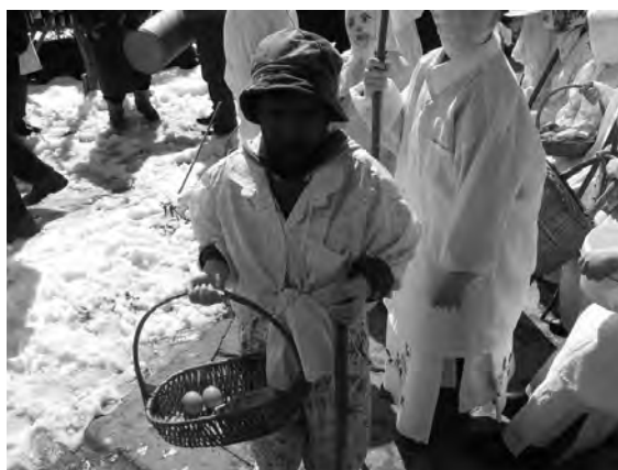
Прикупљање дарова, Остра (2005)