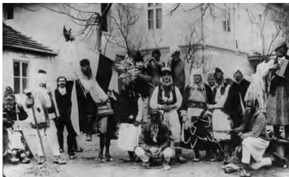
Бела недеља, Прислоница, (1935)