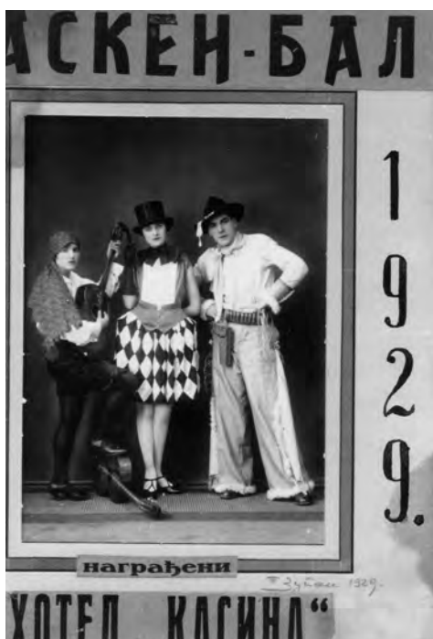
Плаката за маскенбал, Чачак (1929)