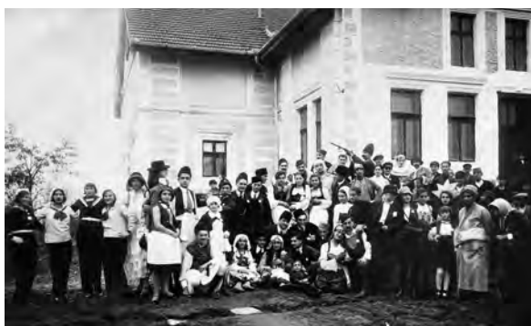
Бела недеља у Атеници, Чачак, (1931)