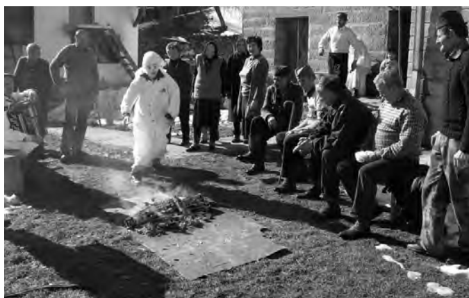
Учесници Беле покладне недеље прескачу ватру, Остра (2005)