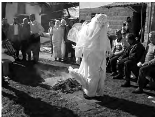
Млада прескаче ватру, Бела недеља, Остра (2005)