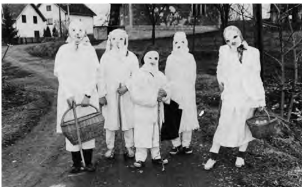
Бела недеља, Остра, (2000)