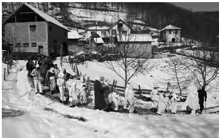
Покладни сватови, Остра (2005), фото С. Ашанин