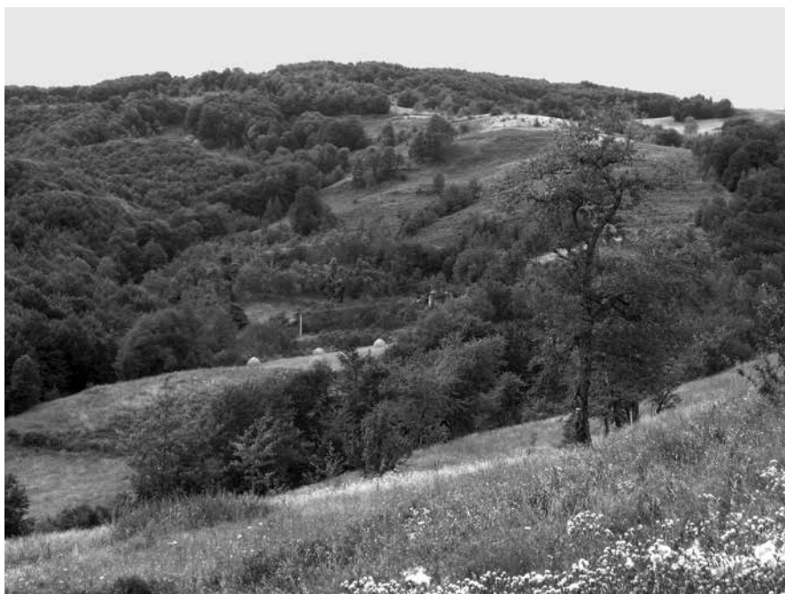
Сл. 1 - Заселак Азаници у селу Васиљевићи на Јавору (2013)