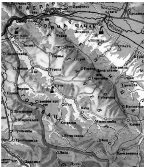
Карта 1 – Драгачево – оштинина Лучани

На географски положај општине утичу друмска и железничка саобраћајница које долином Западне Мораве на северу тангирају територију ове општине, односно омогућавају излазак на магистрални пут који повезује овај део Србије са Црногорским приморјем. Железничка пруга са станицом „Драгачево“ у Јелендолу представља излаз на прометне железничке саобраћајнице Београд-Бар и Београд-Ниш. Преко територије води друмска саобраћајница која повезује Западно Поморавље са Моравичким Старим Влахом од Чачка према Гучи-Ивањици-Сјеници. 2