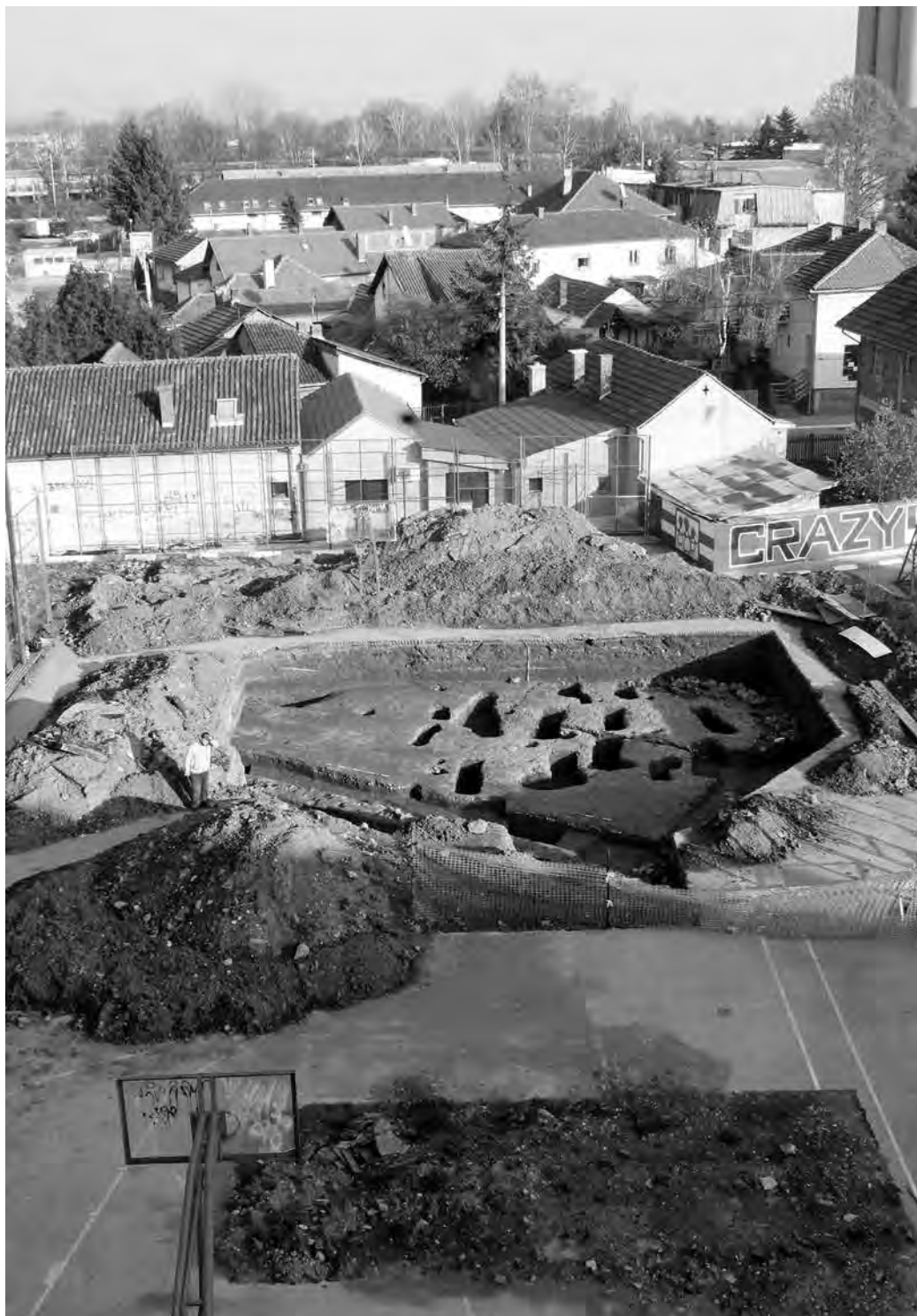
1 - Изглед налазишта након завршених радова – новембар 2014. године.