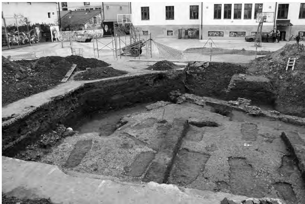
1 - Сонда 4/14: Антички објект са хришћанским гробовима на основи