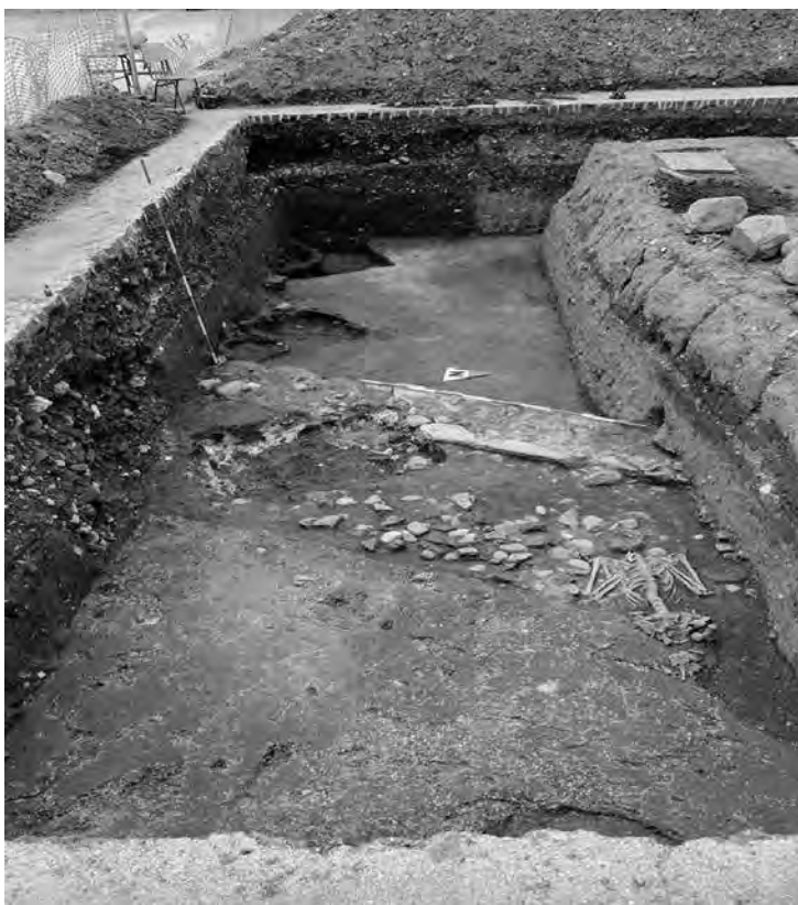
1 - Сонда 2/14: Јужно гео сонде