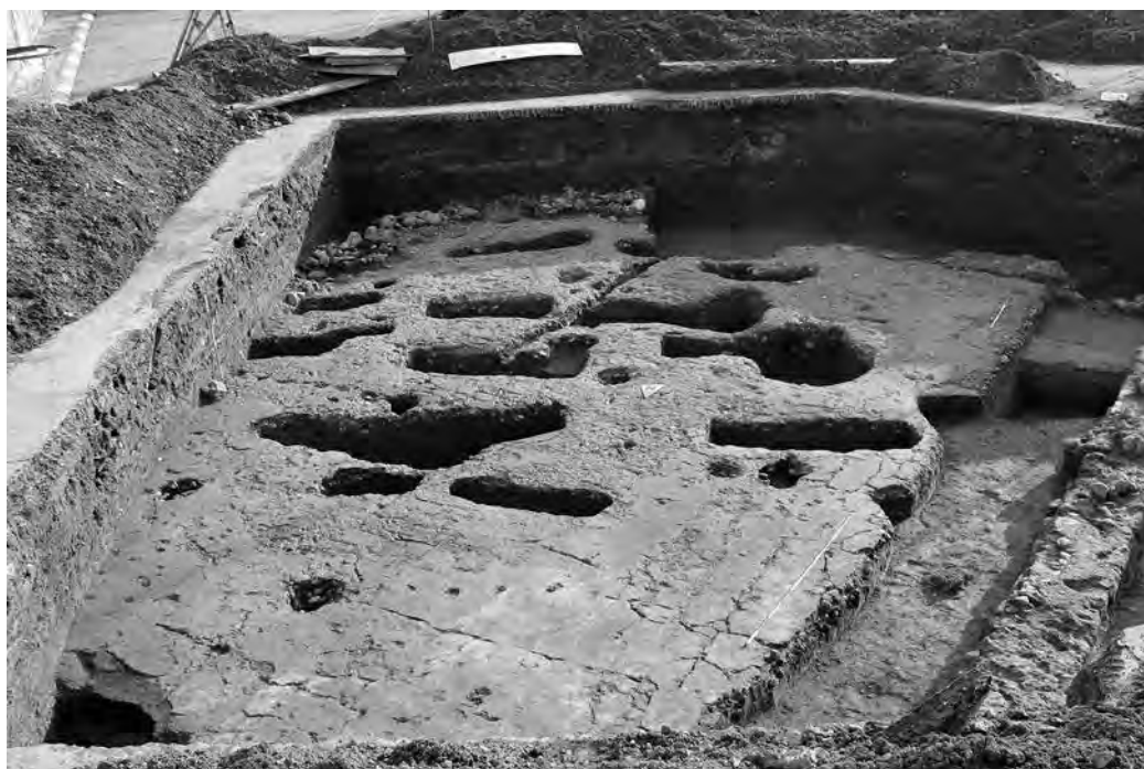
2 - Сонда 4/14: Антички објект након изражњења гробова.