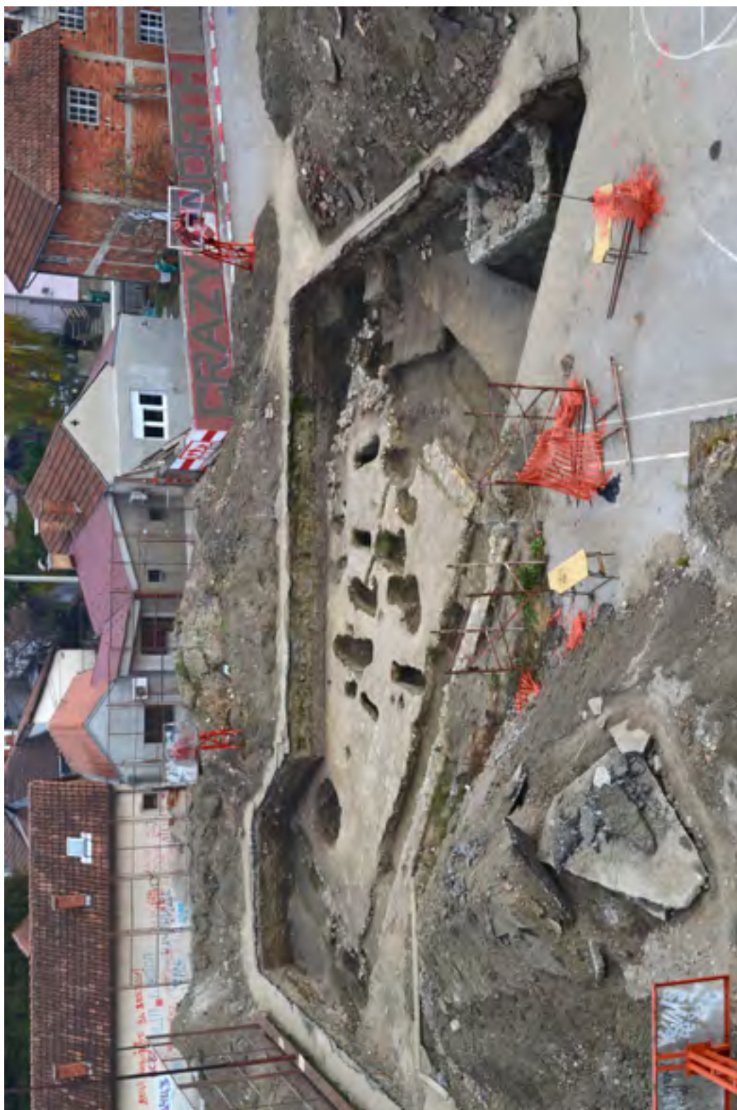
Т. V - Изглед налазишта након завршених радова – новембар 2015. године