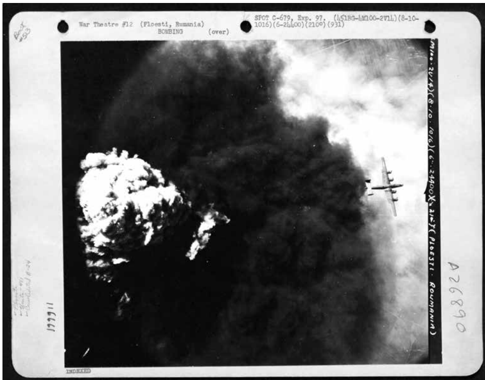
Амерички авиони Б-24 бомбардују Плоешти у Румунији