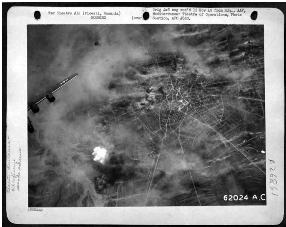
Амерички авиони Б-24 бомбардују Плоешти у Румунији