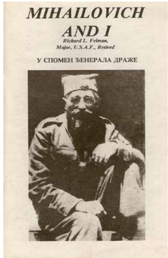
Књига Ричарда Фелмана „Михаиловић и ја”