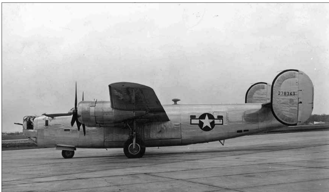
Тий авиона „Авио В-24Г-15-НТ“ йосле изласка из фабрике