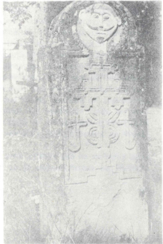
Сл. 4. Споменик Марку Радовано- вићу