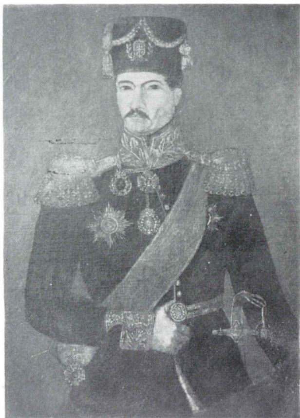
Сл. 2. Генерал Јован Обреновић, рад Уроша Кнежевића