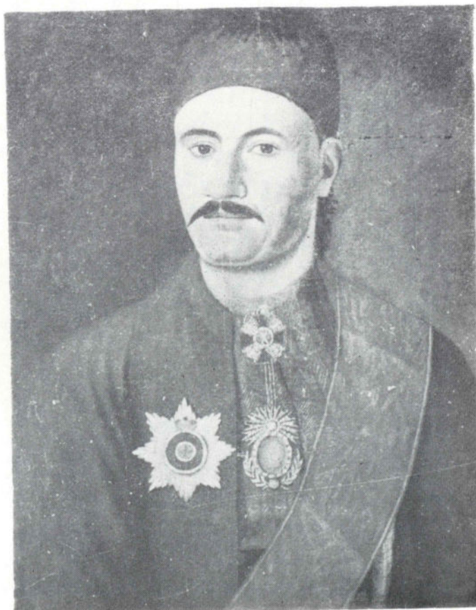
Сл. 3. Кнез Милош Обреновић, рад Павела Ђурковића