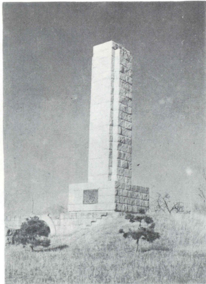
Сл. 9. Споменик Танаска Рајића на Љубићу