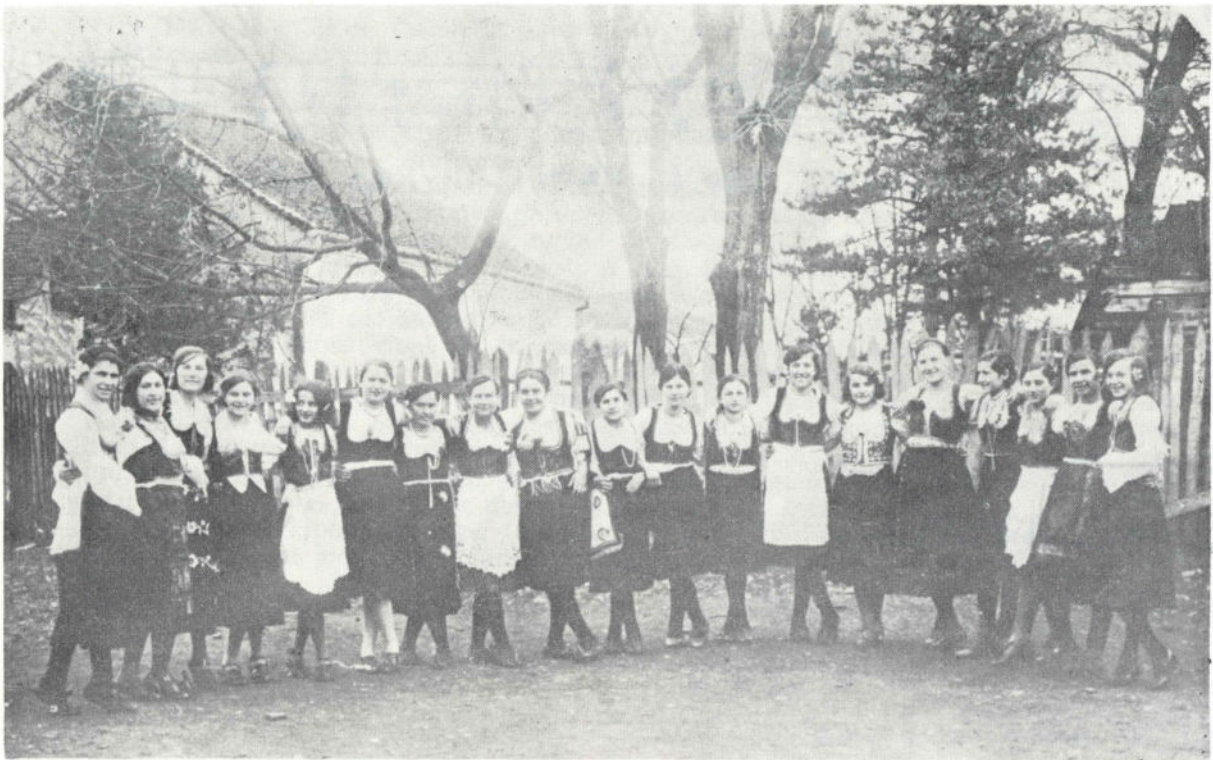
Сл. 2. Фолклорни ансамбл Женске занатске школе у Чачку из 1931. године