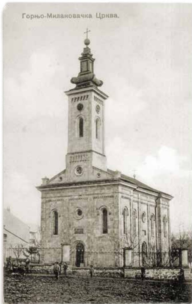
Сл. 12 - Горњомилановачка црква Свете Тројице у којој је крштена Драга Луњевица Музеј рудничко-џаковској краја

Наредног јутра краљ је упутио поздраве Конгресу Земљорадничких задруга који се тог дана одржавао у Чачку. 38 Већ у 9 сати узвишени гости су присуствовали молествију у овдашњој Цркви Свете Тројице, задужбини Милоша и Михаила Обреновића. 39 Иначе, у овој богомољи је крштена потоња српска краљица