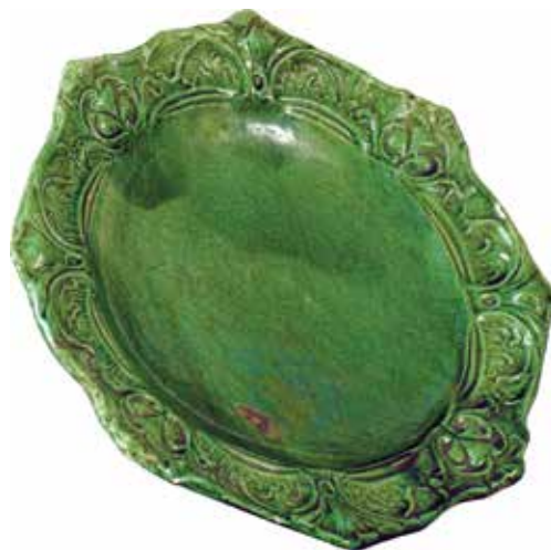
Сл. 8 - Чинија за воће из Таковској дворца Музеј рудничко-џаковској краја

салону се налазило дванаест великих слика, међу којима и портрет краља Александра. 29 У ходнику на спрату доминирали су слика Таковски усџанак и мермерно попрсје краљице Наталије. Просторије су биле намештене у народном духу, што је требало да искаже идеју о владарском пару као традиционалној српској породици.