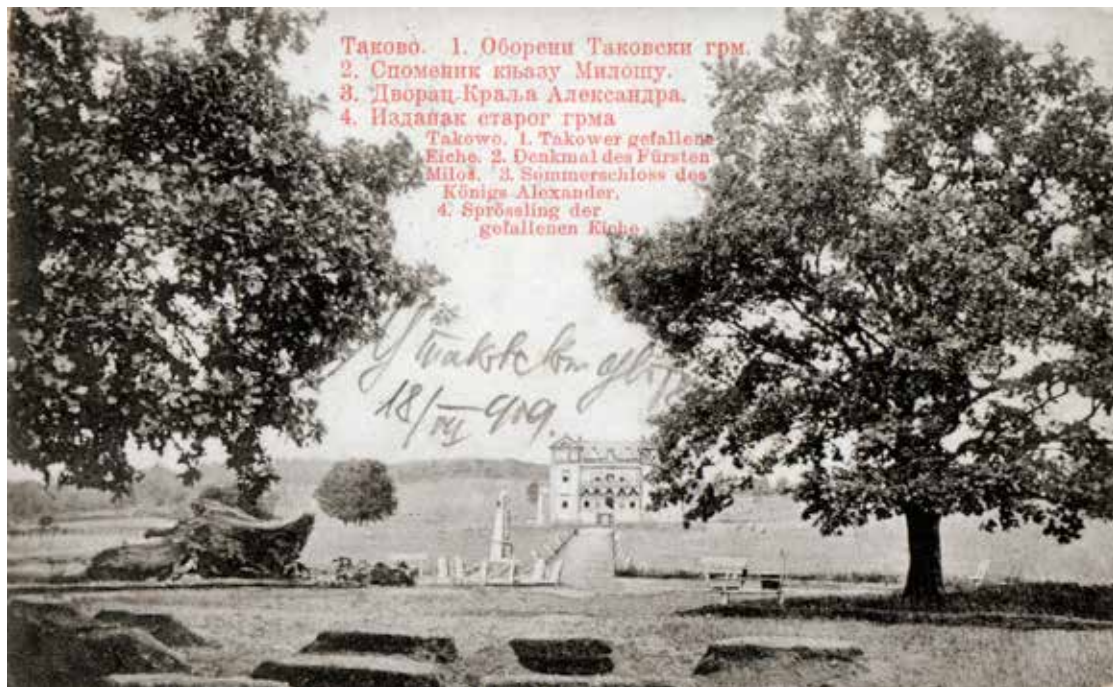
Сл. 1 - Изглед Таковокој дворца и околине почешком XX века

где су присуствовала благодарену у цркви брвнари посвећеној Вазнесењу Христовом. По окончању службе и свечаног ручка, краљ и краљица су даривали древну богомољу са 150 динара у сребру. 11