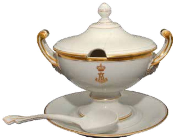
Сл. 7 - Чинија за сују из Таковској дворца (са њоклојцем, њацном и кашиком) Музеј рудничко-џаковској краја