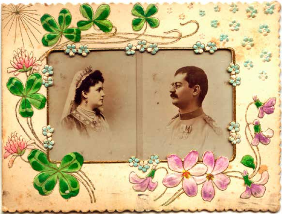
Сл. 11 - Краљевски њар, 1900-1903 Музеј рудничко-џаковској краја

из оближњег села Прислонице „те тако про- дужи старо кумство дома Луњевичиног“.