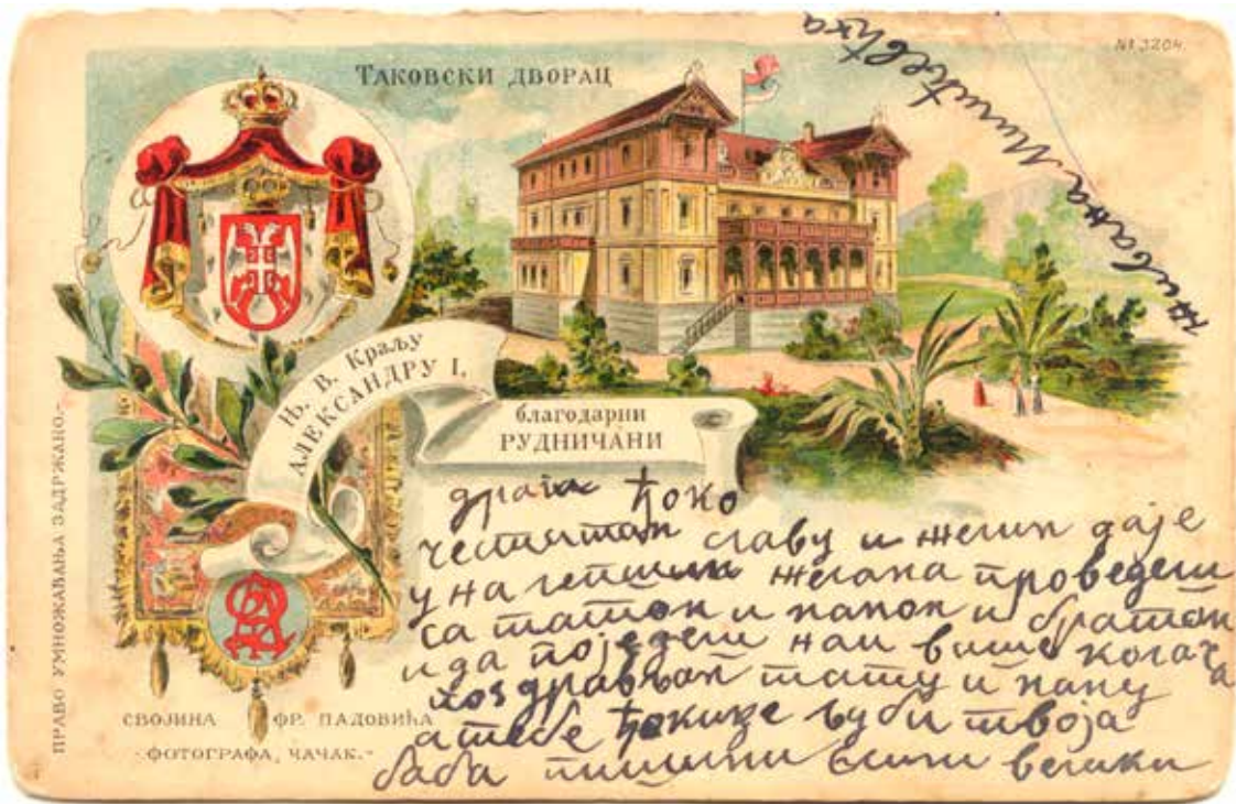
Сл. 6 - Таковски дворца почетком XX века Музеј рудничко-таковској краја

прирезама утрошени по буџету и уредним законима овереним исправама“. 25