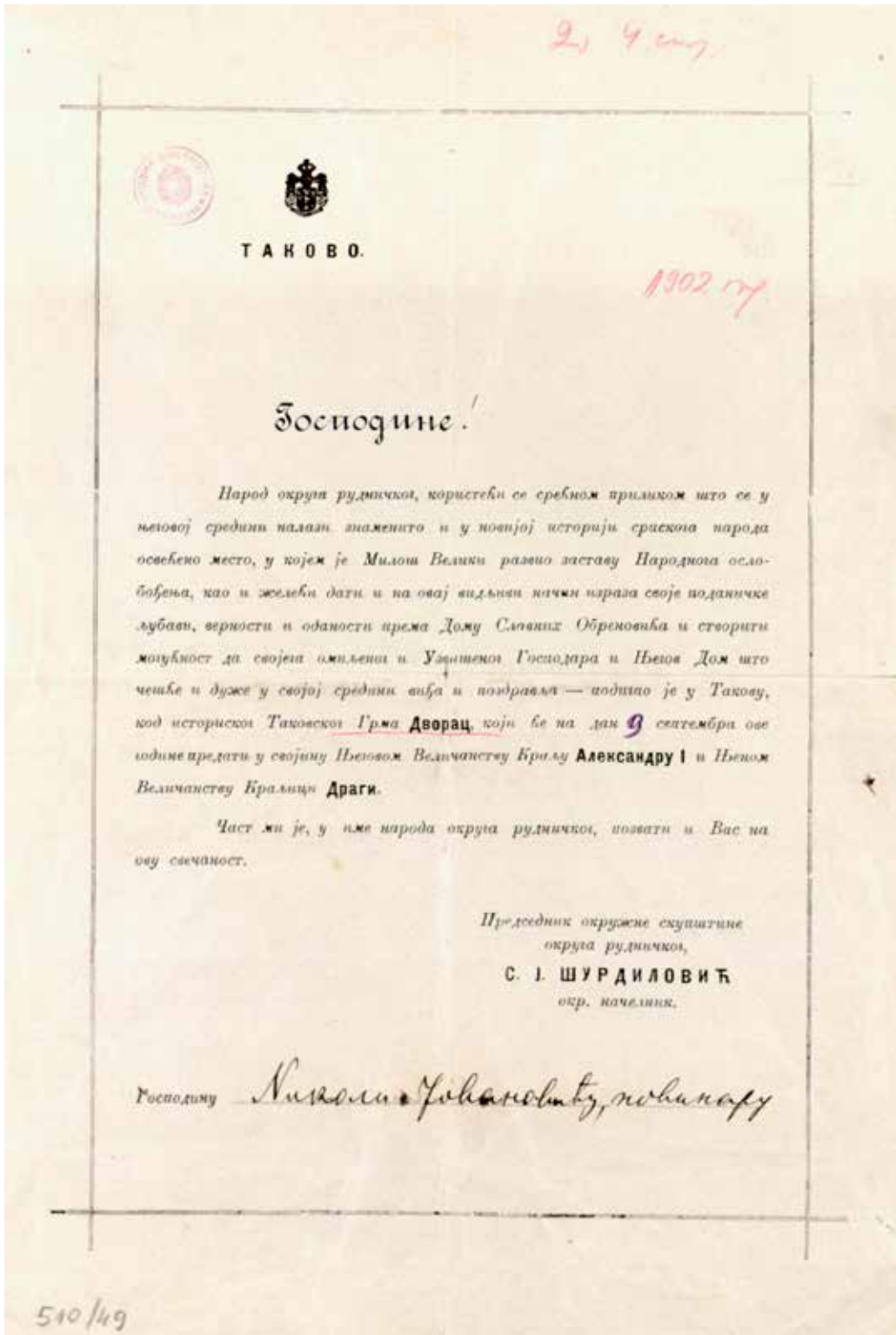
Сл. 2 - Позивница за отварање дворца у Такову Народна библиотека Србије