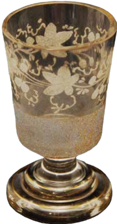
Сл. 9 - Чаша из Таковској дворца Музеј рудничко-таковској краја

опремање Дома Милоша Великог, тј. зграде горњомилановачке гимназије. Нешто од тих предмета данас се налази и у фондусима Музеја рудничко-таковског краја. 32