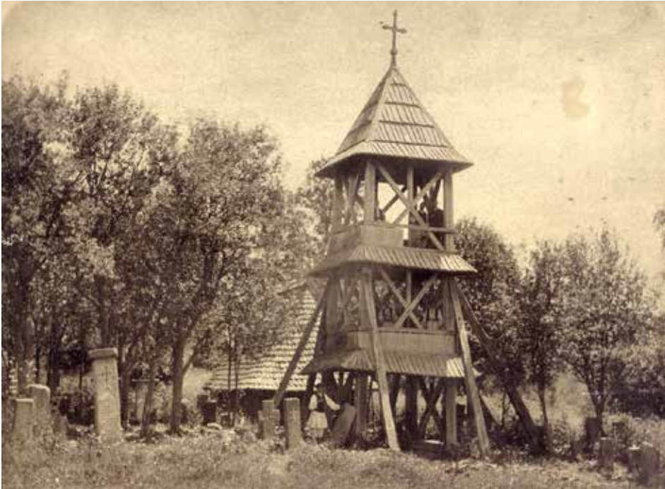
Сл. 3 - Изглед црква брвнара у Такову почешком XX века