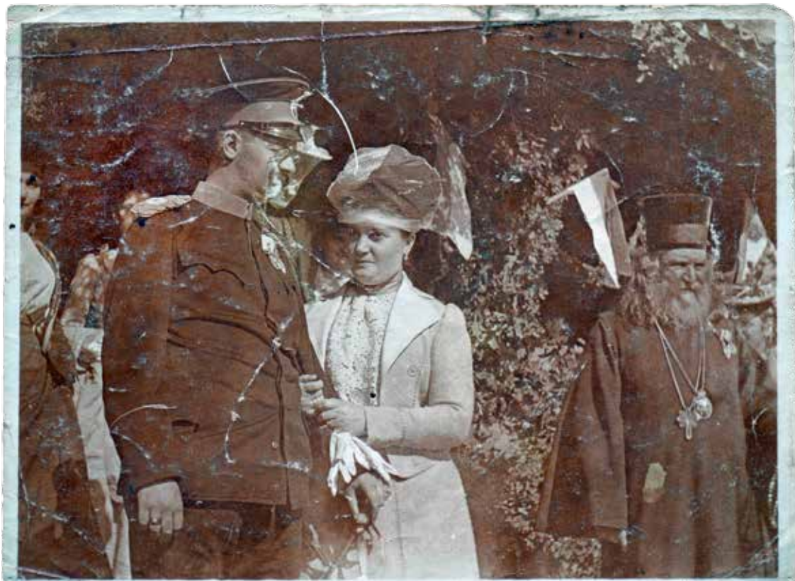
Сл. 14 - Краљ Александар и краљица Драга приликом посете манастиру Враћевшница 1901. Манастир Враћевшница

освећењу споменика приређен је свечани ручак, а око три сата после подне краљевски пар је кренуо за Крагујевац.