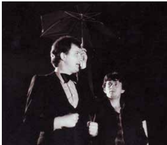
Предсјава „Како је Добрислав ишрчао кроз Југославију“ (1979)