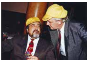
Јубиларна њослава „Задњеї воза за Чачак” у хоћелу Морава