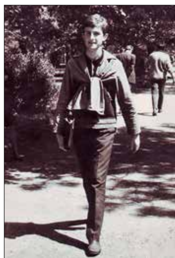
У Градском парку