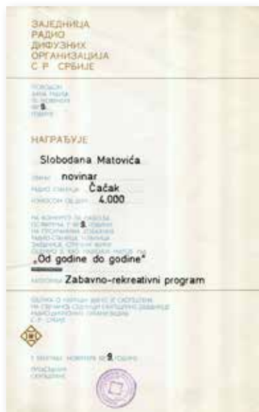
Награда за радио-програма „Од године до године“ (1979)