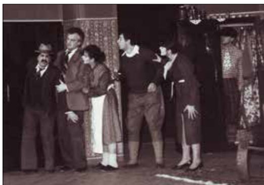
Предсјава „Кус њешић“ (1971)