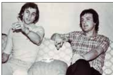
Са музичарем Зораном Бранковићем