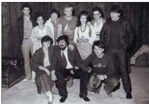
Драмски сјудио Дома културе у Чачку