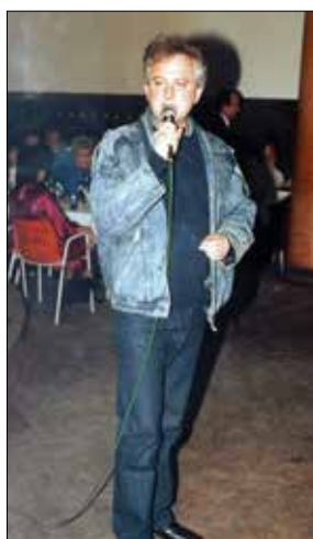
Водишел једне од безброј забава