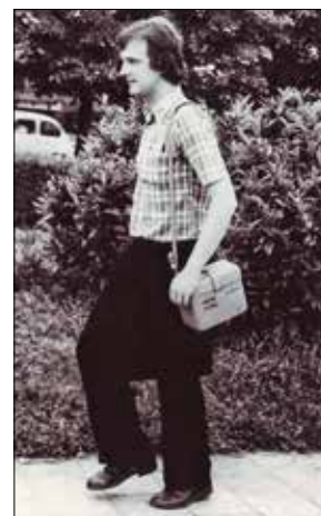
У центру Чачка