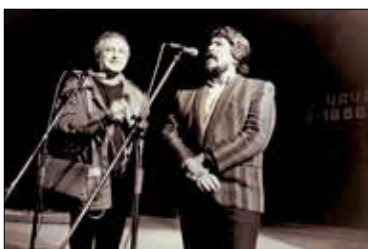
На њослави 20 година Радио Чачка (1966-1986)