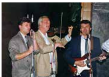
У Дому културе у Чачку