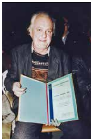
Џаја са Наградом Града Чачка (1999)