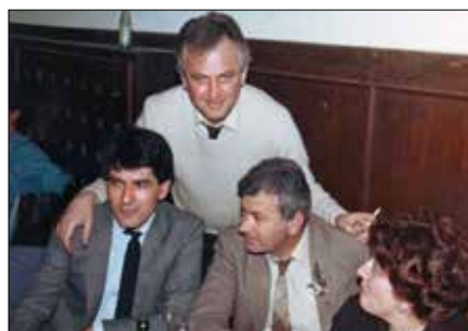
Увек у веселом друшћу