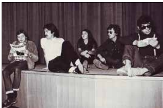
Предсјава Лудак (1971)