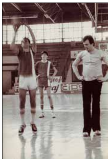
Савезни кошаркашки судија