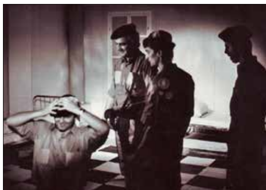
Предсјава „Да ли ваша жена има чујаве ноје“ (1980)