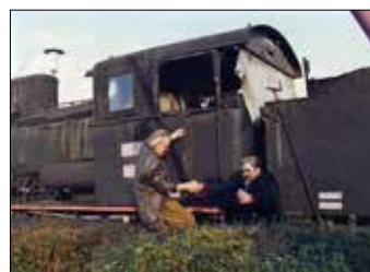
Промо-машеријал за серијал „Задњи воз за Чачак”