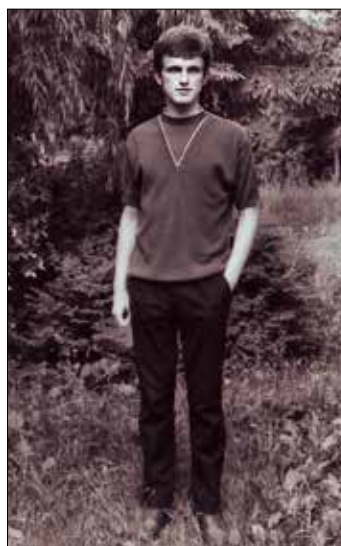
Бард чачанске књижевне и уметничке сцене