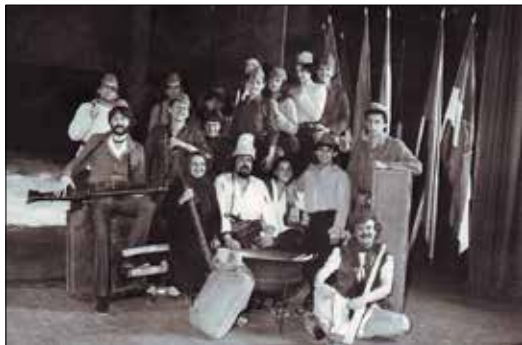
Предсјава „Вук Бубало“ (1980)