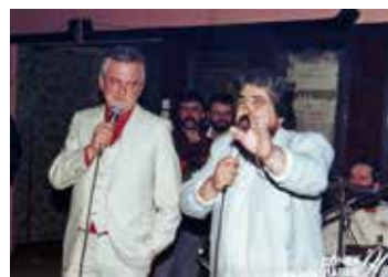
Са Ђембом на дочеку Православне 1990. године у хоћелу Београд