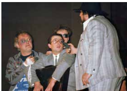
Предсјава Ошмица (1989)