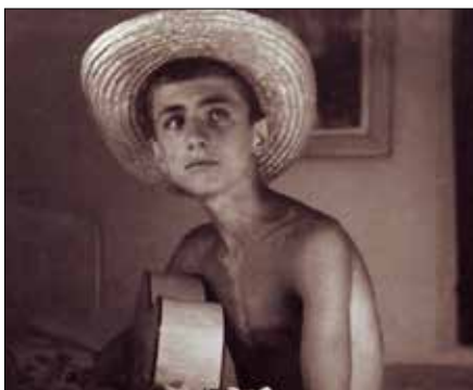
Волео је и музику