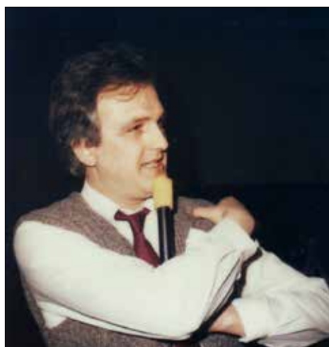
Ненадмашни водишел и шоумен