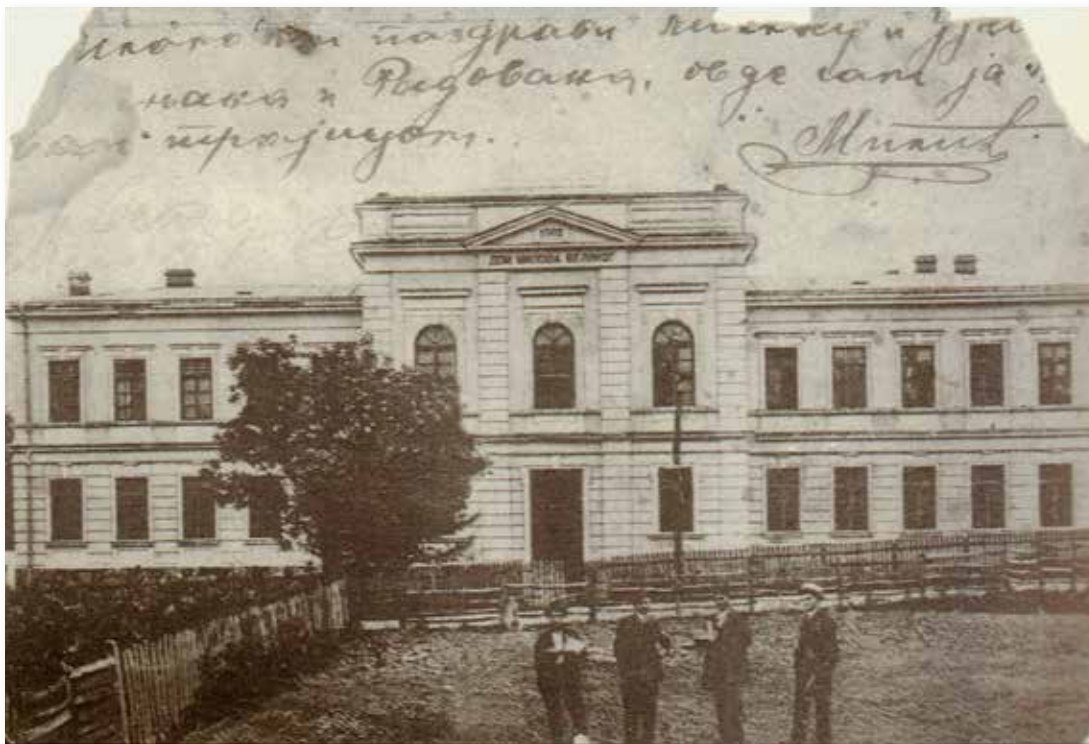
Зграда Гимназије, саграђена 1902. године, као спомен дом Милоша Великог