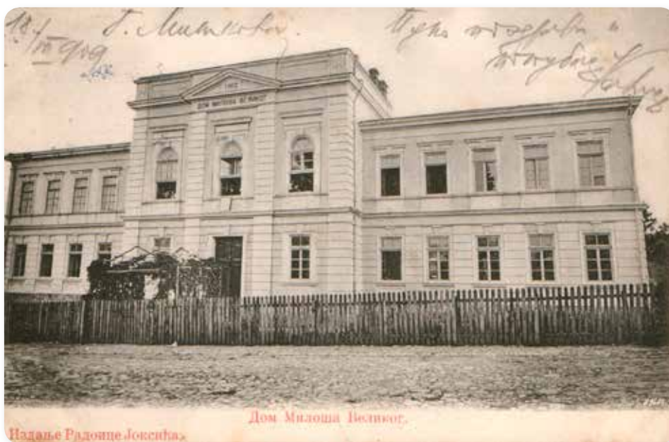
Милановачка Гимназија на разгледницама