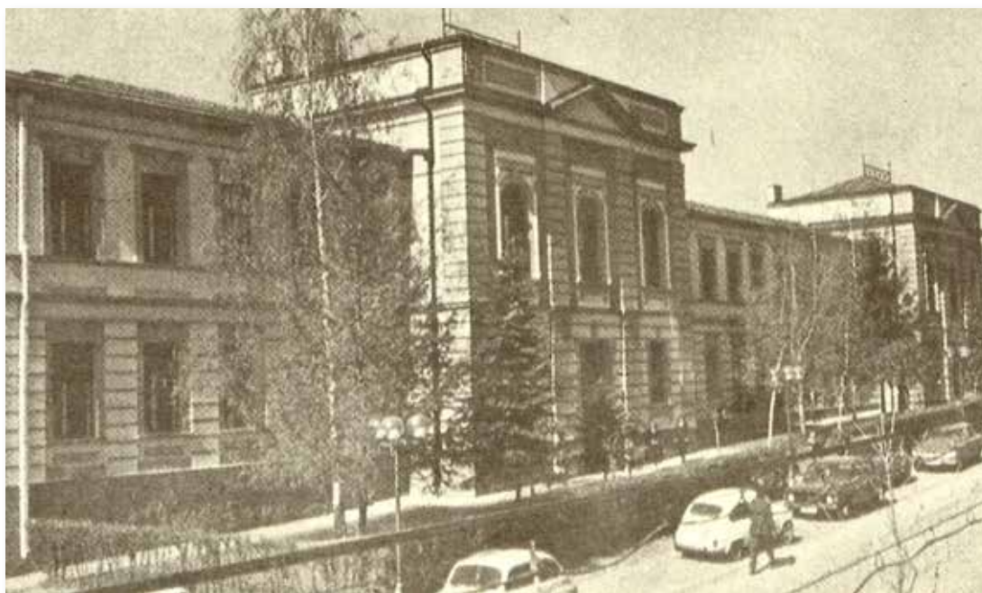
Слика 2: Зграда Гимназије након доградње из 1937. године.