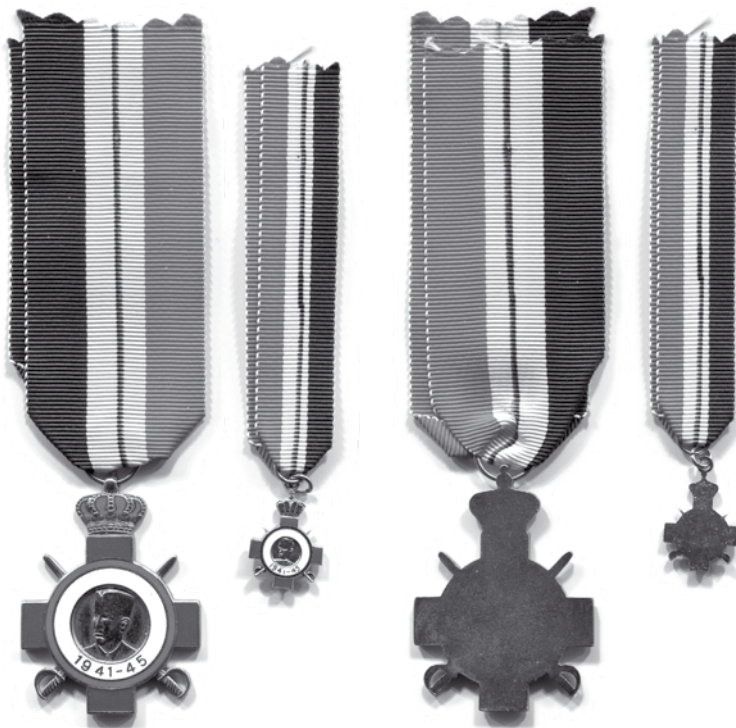
Слике 3 и 4

Други модел је био донекле другачијих карактеристика и према сачуваним представама на поштанским маркама из САД установљен је 1965. године, на двадесетогодишњицу завршетка Другог светског рата. И код њега постоје две варијанте, са ликом Д. Михаиловића на реверсу или без њега. Други модел је, у ствари, донекле увећан први модел, димензија 51,5 x 82 мм. За разлику од првог, други је урађен од позлаћене бронзе и на њему су унети зраци између кракова крста. На прстену централне композиције аверса налази се поред година и натпис In memoriam , а круна је спојницом закачена на крст, што је још једна разлика у односу на први модел. На реверсу се по узору на први модел налази лик ђенерала Михаиловића у црвеном и белом емајлу и натпис In memoriam 1941-45 . (Слике 5 и 6)