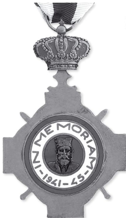
Слика 5 и 6