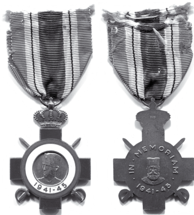
Сликe 1 и 2

различитости у ковањима међу израђеним емисијама. 15