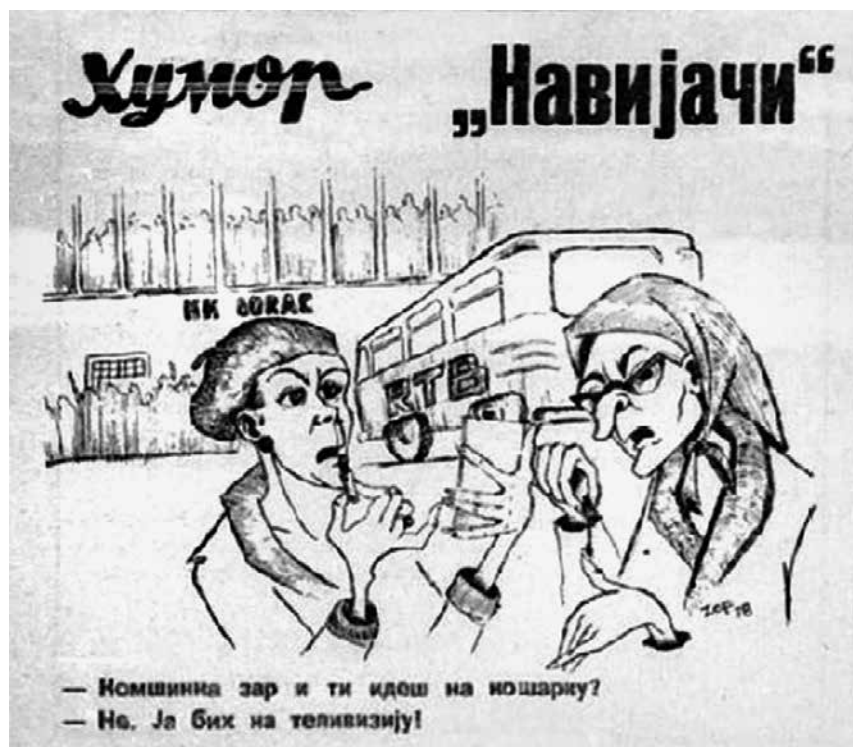
Слика 4. Хумореска из 1978. године у Чачанском гласу која исмева ТВ навијаче