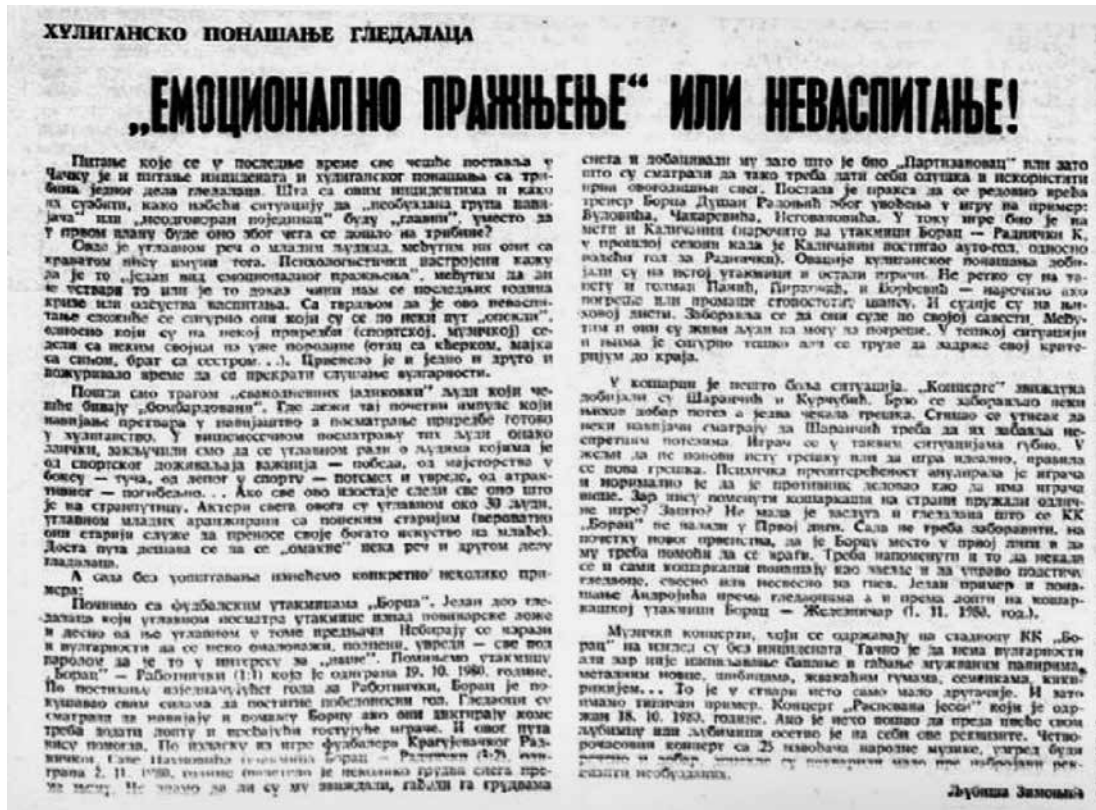
Слика 3. Чачански глас 7. новембар 1980. Текст о понашању публике на спортским приредбама