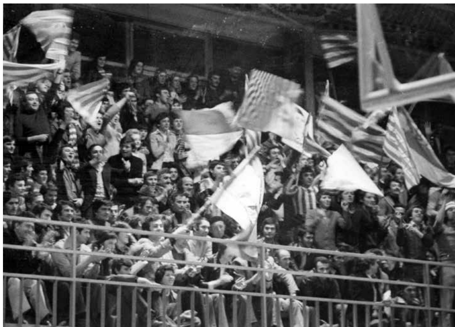
Слика 1. Публика у Хали крај Мораве