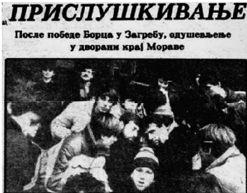
Слика 5. Ослушкивање резултата у Загребу од стране Желових навијача и славље након победе Борца против Цибоне 1982. године