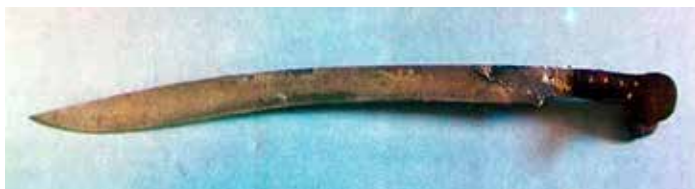
Сл. 2. Јатаган црносапац Танаска Рајића (Војни музеј Београд)