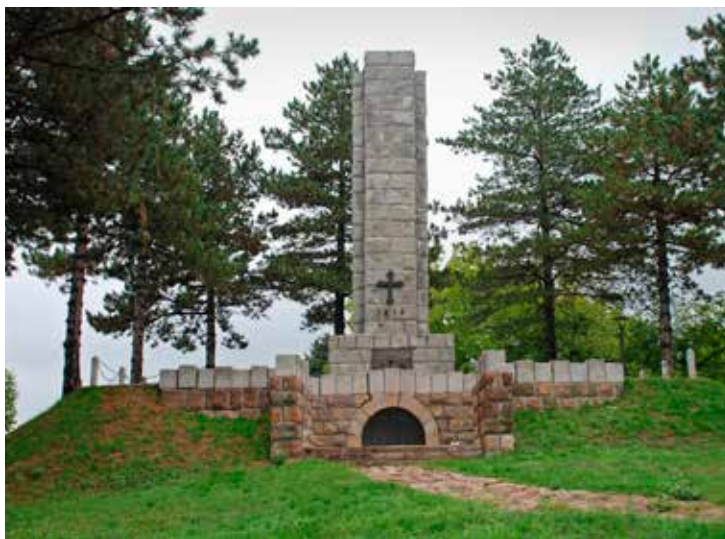
Сл. 14. Споменик на Љубићу