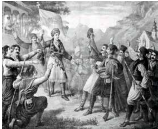
Сл. 12. Стева Тодоровић, Таковски устанак, фотографска репрографија, око 1860.