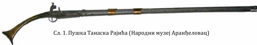
Сл. 1. Пушка Танаска Рајића (Народни музеј Аранђеловац)