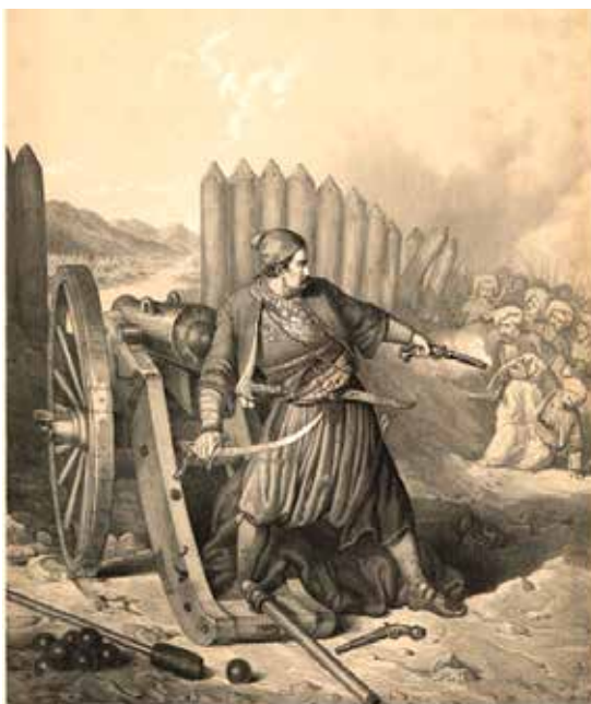
Сл. 7. Анастас Јовановић Јунаштво Рајићево (Национална и свеучилишна књижница у Загребу)