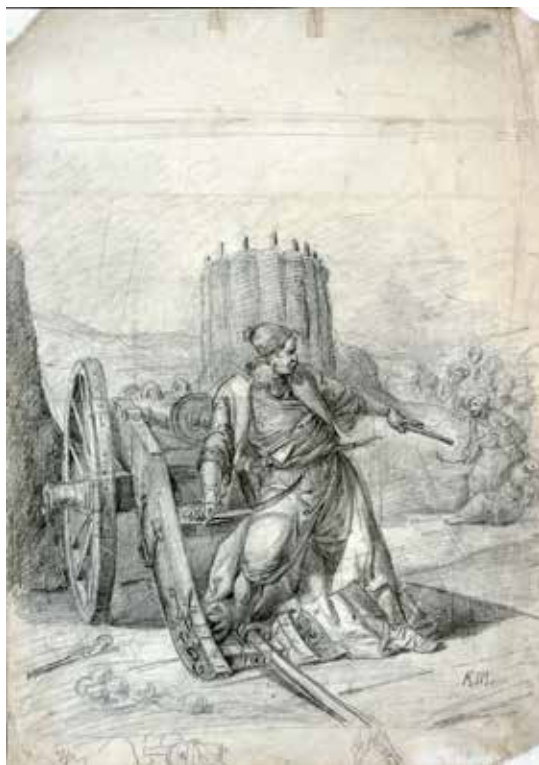
Сл. 6. Анастас Јовановић, Танаско Рајић поред топа, 1848 (Музеј града Београда)