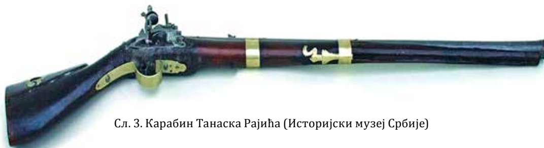
Сл. 3. Карабин Танаска Рајића (Историјски музеј Србије)