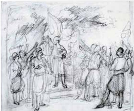
Сл. 11. Стева Тодоровић, Таковски устанак, 1853.