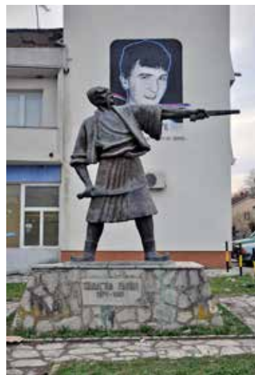
Сл. 15. Споменик Танаску Рајићу у Страгарима