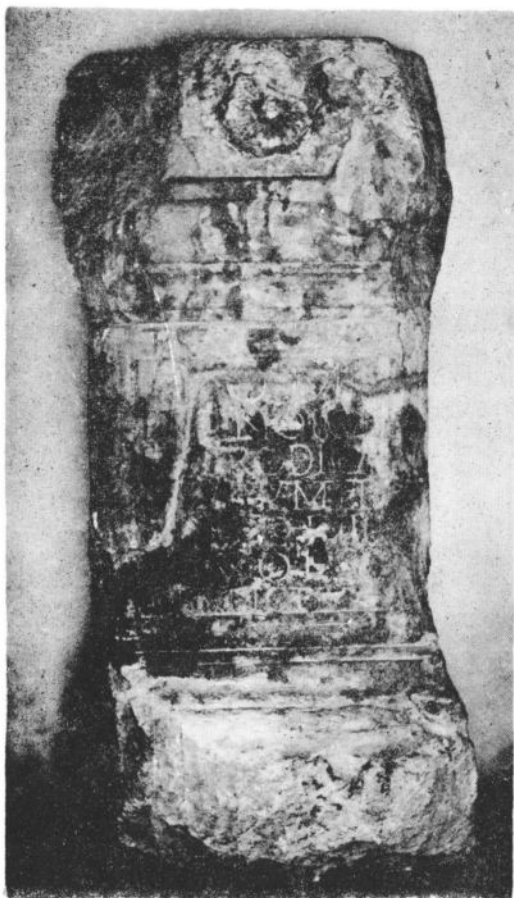
Сл. 1. Ара посвећена Серапису и Изиди нађена у Чачку