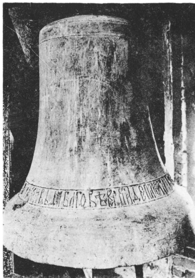
Сл. 3. Звоно из доба деспота Ђурђа Бранковића (1454. година)