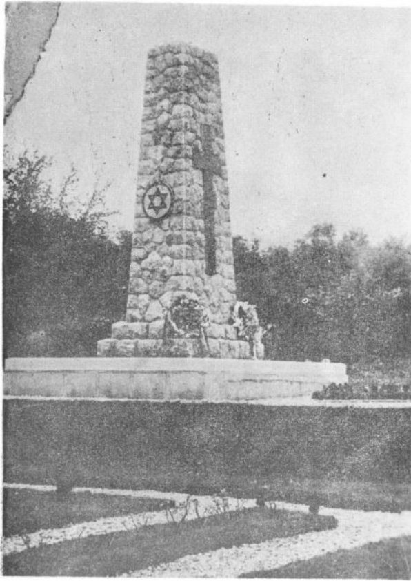
Сл. 5. Изглед споменина са католичним и језрејским симболима