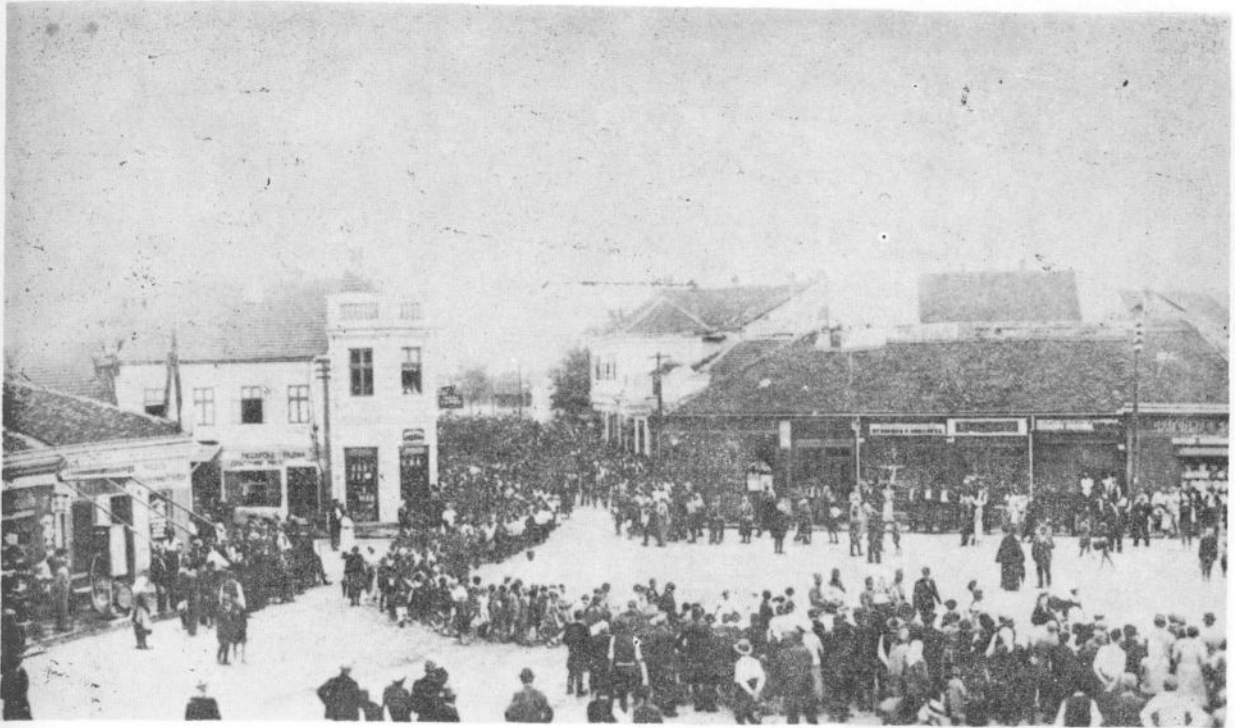
Сл. 3. Чачан: Пролазан свечане поворне нроз град