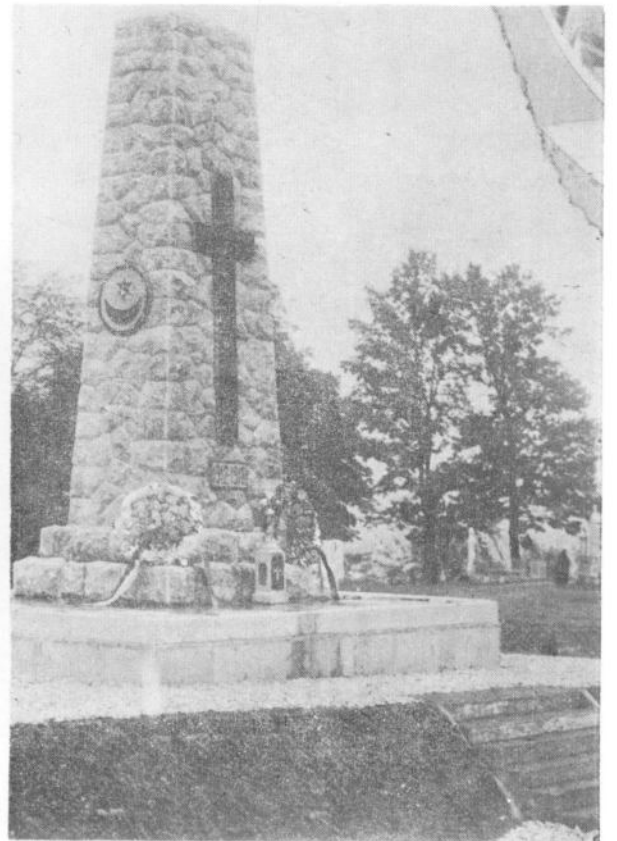
Сл. 6. Изглед споменика са православним и исламским симболима