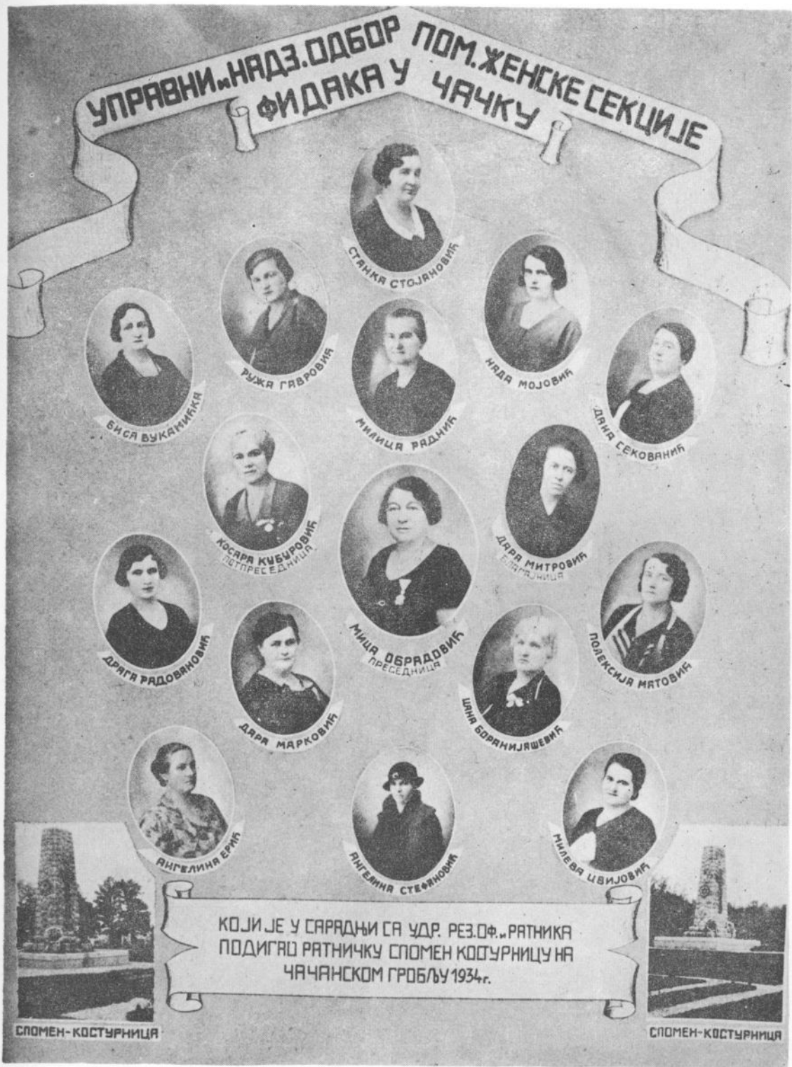
Сл. 1. Чланице Управног и Надзорног одбора чачанске Помоћне женске сенције Фидан