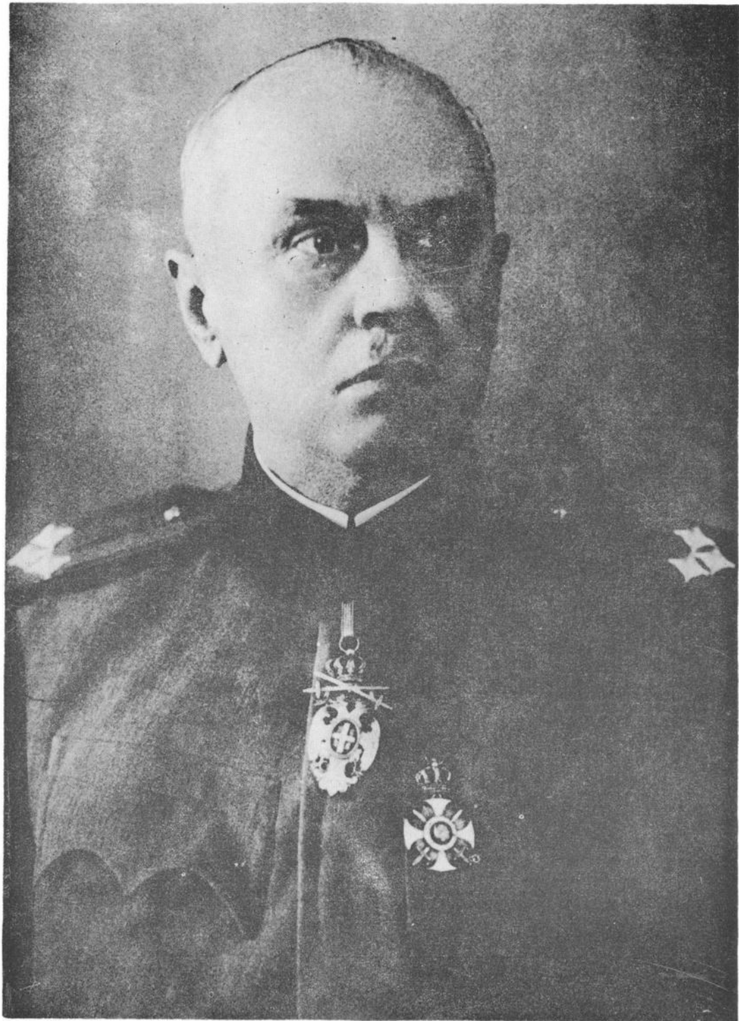
Сл. 1. Пуковник Драгутин Гавриловић