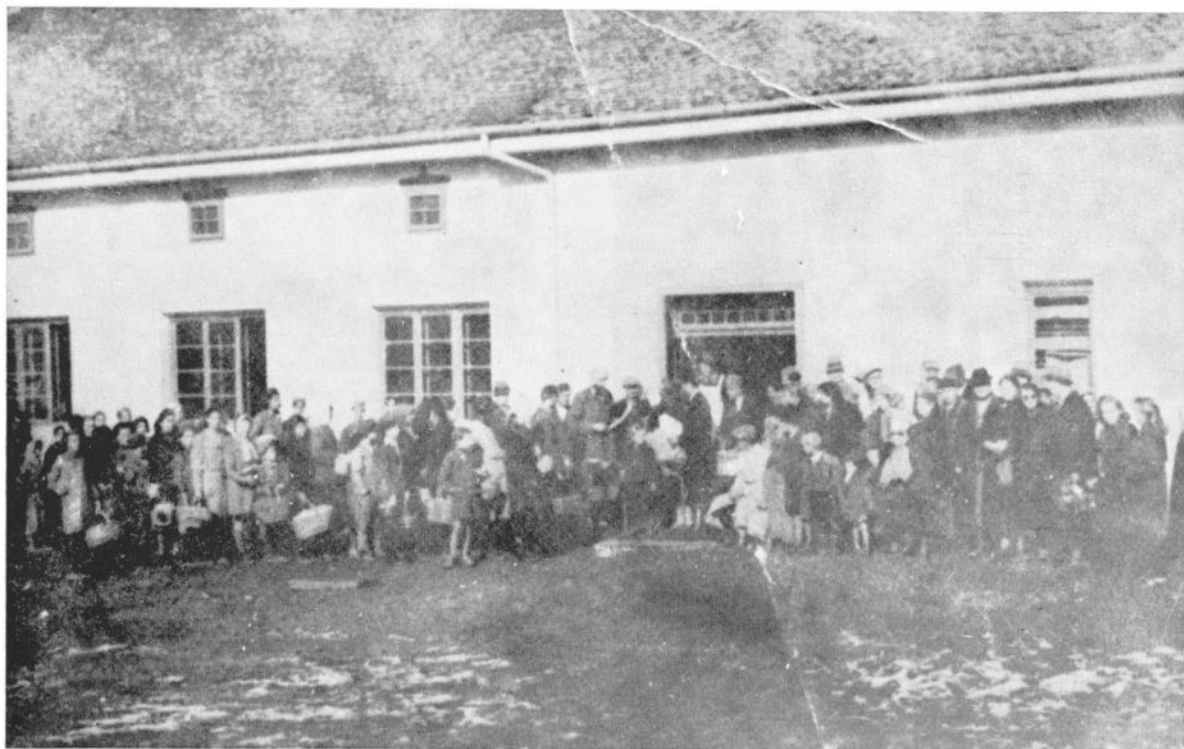
Сл. 3. Народноослободилачки одбор Чачка формирао је кухињу за сиротињу и избеглице. На слици: примање хране.