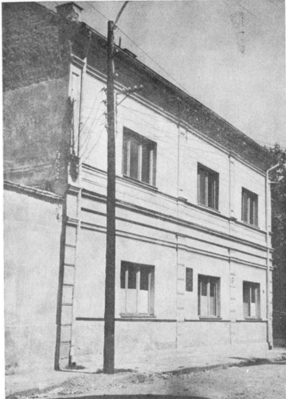
Сл. 1. Зграда НОО Чачка 1941. године