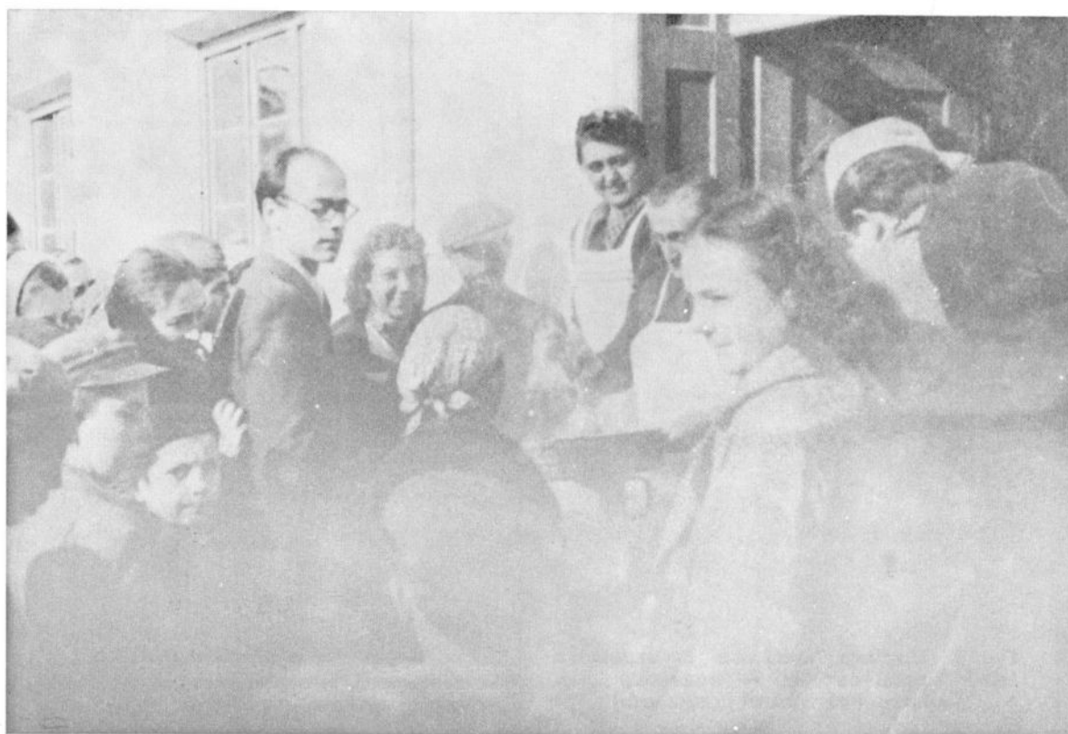
Сл. 4. Примање хране у Народној кухињи у ослобођеном Чачку 1941. године