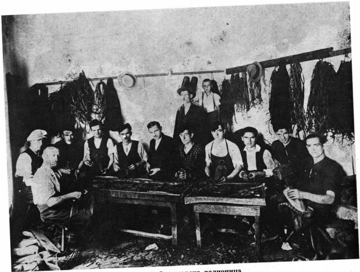
Сл. 4. Опанчарска радионица