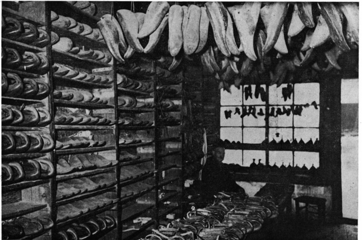
Сл. 6. Опанчарска радња