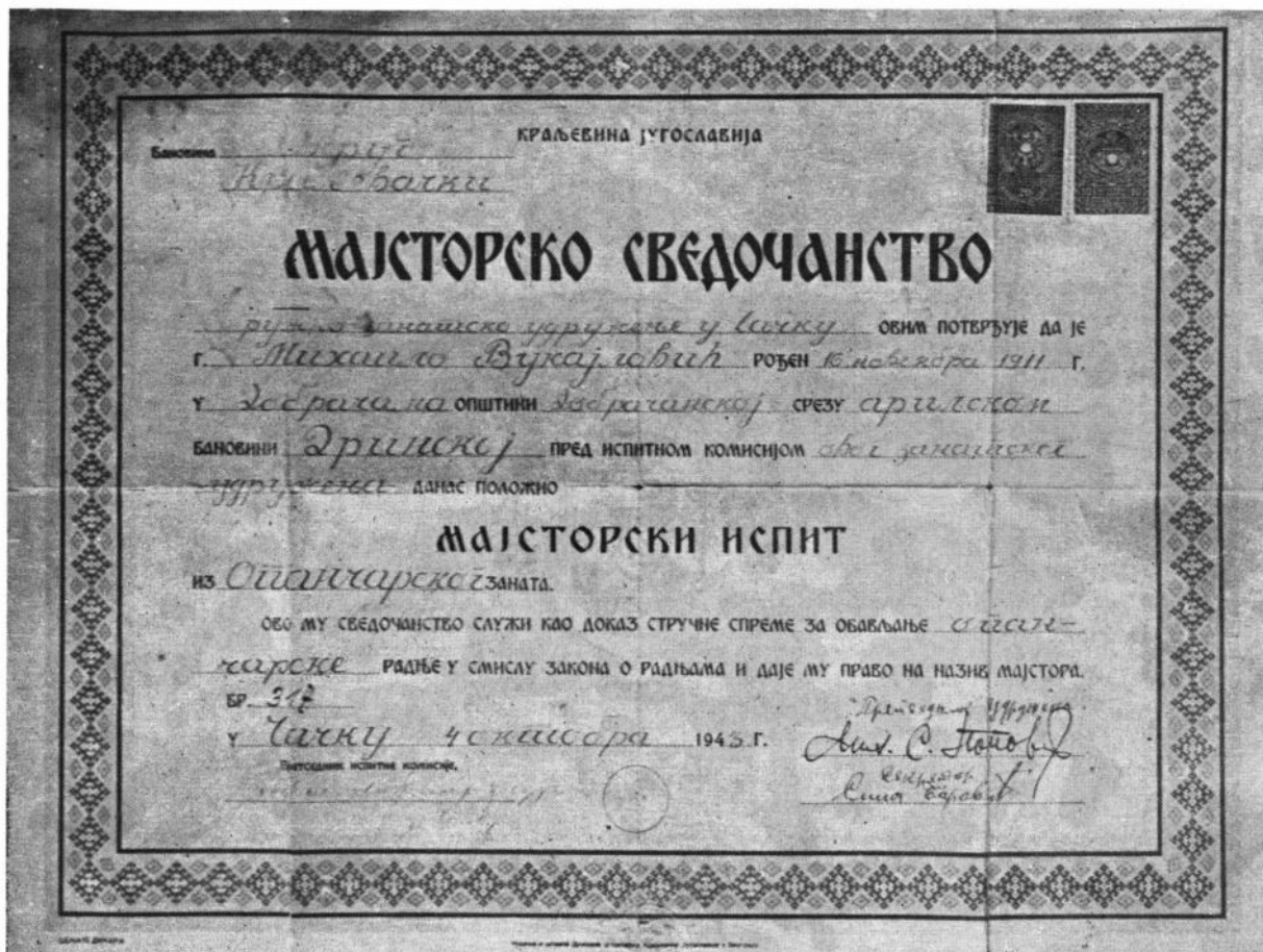
Сл. 1. Факсимил мајсторског писма