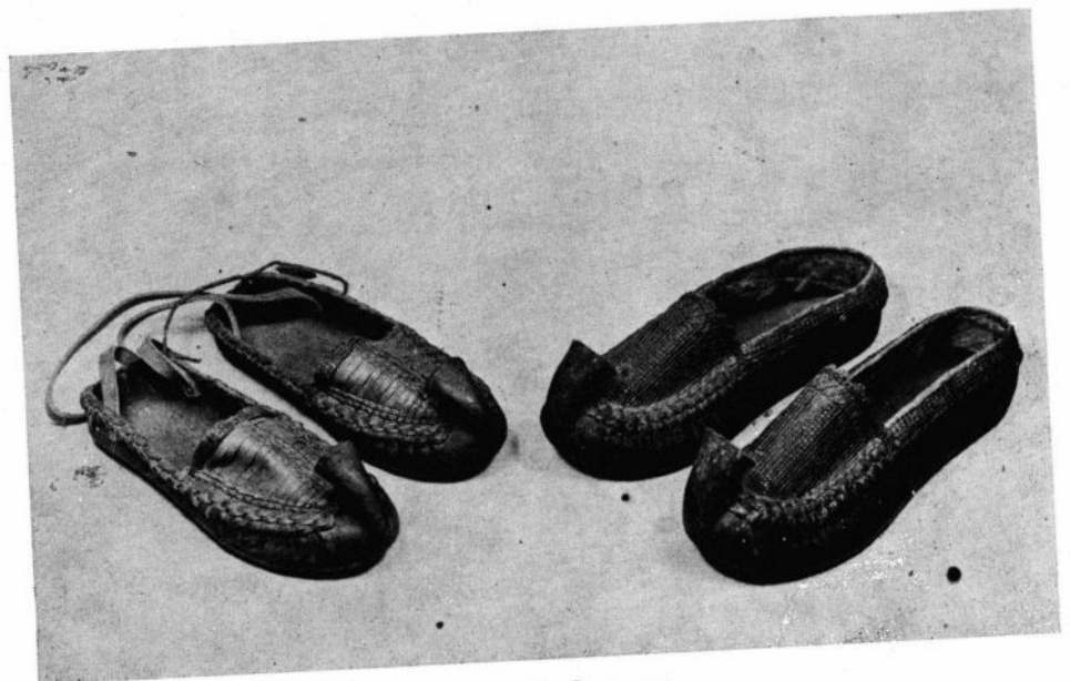
Сл. 3. Опанци